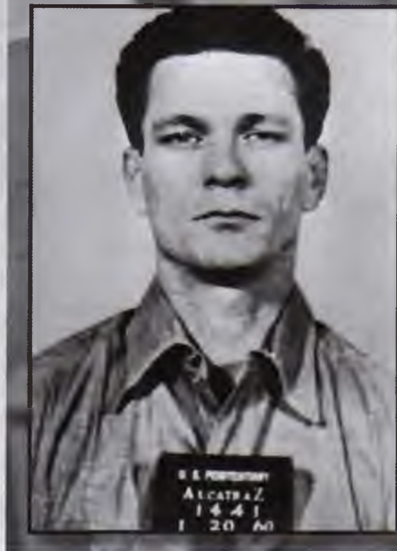
Frenks Moriss ir viens no trim cilvēkiem, kuriem jebkad izdevies izbēgt no slavenā Alkatrazas cietuma.

1962. gada vasarā visi priekšdarbi bija pabeigti, un naktī no 10. uz 11. jūniju plāna realizācija varēja sākties. Jau pašā sākumā bēgļiem gadījās ķibe: viens no viņiem nespēja laikus izkļūt no savas kameras, jo pārāk stin-