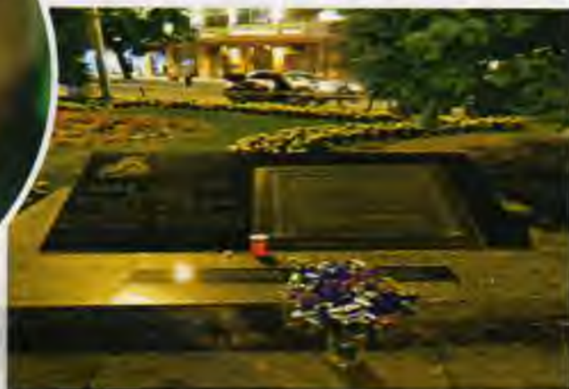
Bijušās Mātes Terēzas mājas atrašanās vietā novietota arī piemiņas plāksne, pie kuras nemitīgi tiek dedzināta svece.

Lai arī, atrodoties Albānijā, par pārsteigumiem nav jābrīnās, albāņu tirdziņos redzētais sākumā rada nelielu neizpratni. Starp ierastajiem fotomagnētiem, krūzēm un albāņu nacionālajiem tērpiem it visur pretī raugās Mātes Terēzas suvenīri. Lielāko daļu sava mūža Māte Terēza pavadījusi Indijā,