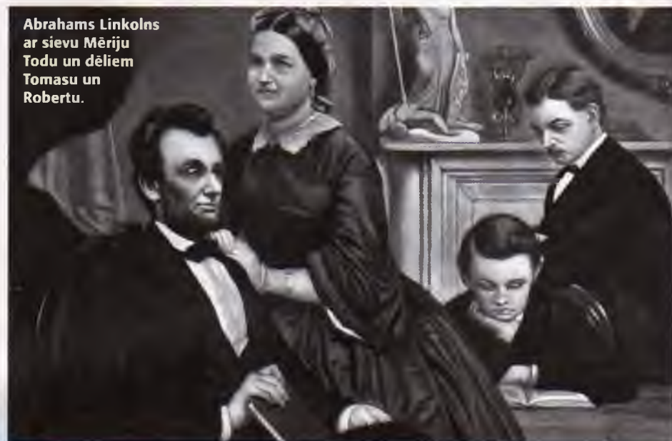
Abrahams Linkolns ar sievu Mēriju Todu un dēliem Tomasu un Robertu.

Par attaisnojumu Linkolna kundzes maņākāļajai aizrautībai ar spiritismu jāmin tas, ka tolaik misticisms Amerikā bija tik populārs, ka daži iebraucēji no Eiropas to dēvēja par istu epidēmiju. Teju katrā pilsētā praktizēja pa kādam medijam, kurš bija gatavs interesentus savest kopā ar viņpasaules iemītniekiem. Vašingtonā šāds medijs bija tobrīd tikai 21 gadu vecā Netija Kolberna, par kuras pastāvīgo klienti tad arī kļuva misis Linkol-