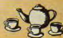
BALLĪTES, AKTĪVĀ ATPŪTA