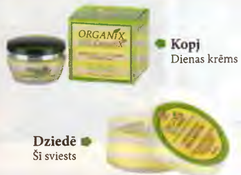
Kopj Dienas krēms