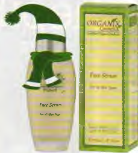
Aizsargā Sejas serums

Ko Tu esi šodien izdarījusi, lai pasargātu savu sejas ādu no VĒJA UN AUKSTUMA?