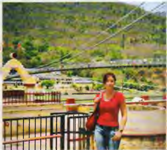
Pie Rišikešas tilta pār Gangu.