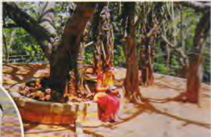
◀ Pie "vēlmju koka" Putaparti, kura zaros vēlēšanos mazu papīrišu veidā.