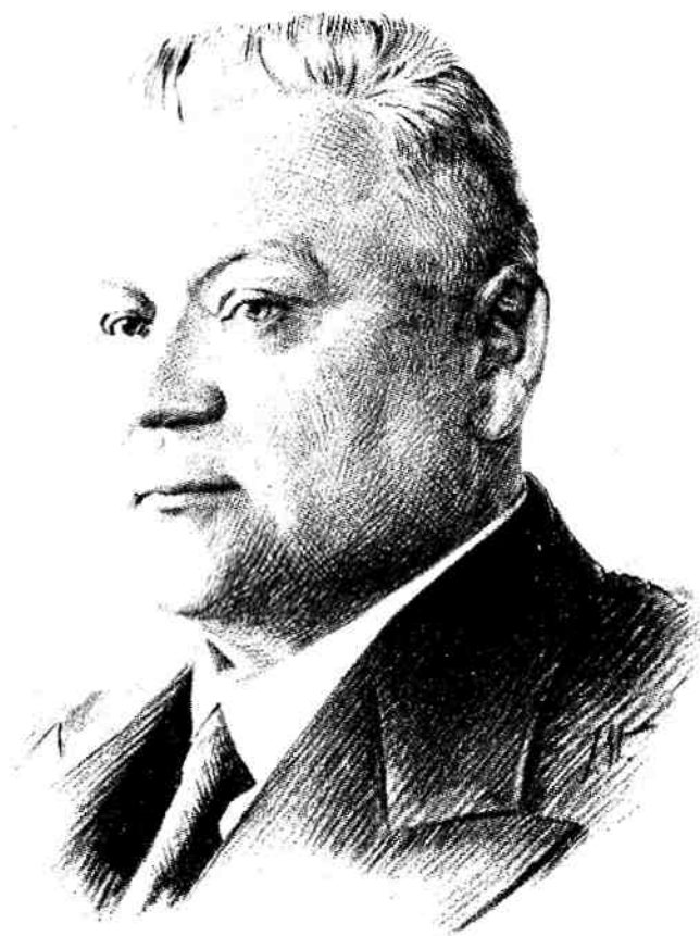
Dr. KARLIS ULMANIS Valsts un Ministru prezidents