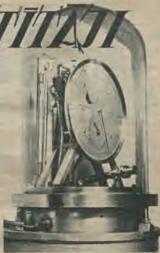
Hermetiski noslēgts no ārpusaules iespaidiem, galvenais astronomiskais pulkstenis pievieno mūžībai sekundi pēc sekundes.

Zinātniekiem vēl daudz bija darba un pūliņu, līdz nonāca līdz mūsdienu precīza-