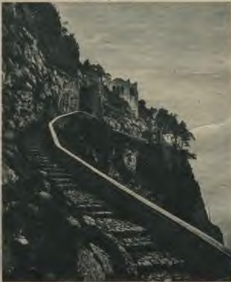
Aksela Muntē slavenā vasarnīca Kapri salā.

Tagad amerikāņu kaņavīri šīs īpatnējās saules svētnīcas vēl nesagrauto daļu pārvērtuši kazarmā un daudzos mākslas darbus bezjēdzīgi izpostījuši vai aizveduši sev līdzī uz Ameriku kā piemiņas lietas.