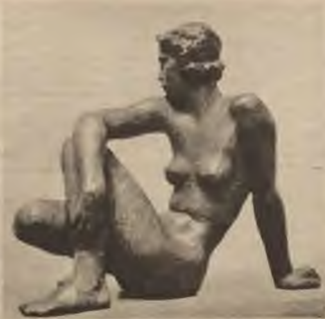
Fritz's Klimsch's: Vērotāja.

Tikpat izvirtusi kā glezniecība bija arī tēlniecība. Tautai tika rādīti kropli idioti kā „mākslas darbs”.