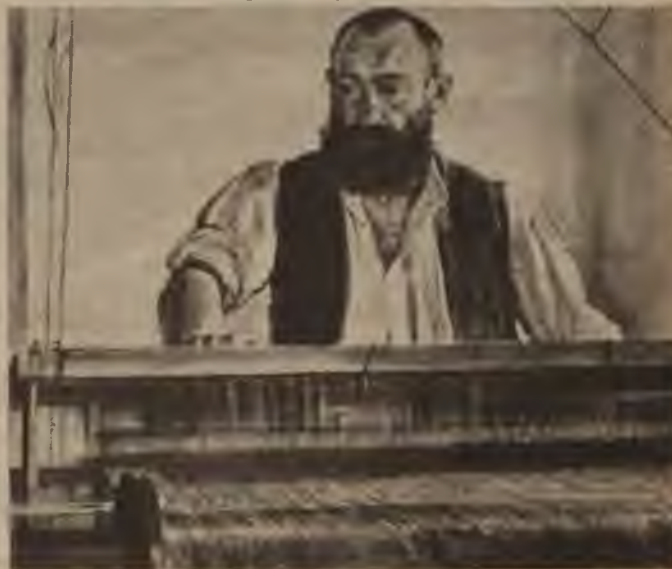
Baumgartner's: Tegernas ezera apvidus audeklis. Tāds izskatās īstenībā vācu strādnieks.

Izvirtušā māksla darināja „gleznas”, kas bija apkaunojums ikvienam darba cilvēkam. Te redzams kāds idiotu mākslas tipisks piemērs. Liekas gluži nelicami, ka tanīlīdzīgus darbus pirka muzeji par tautas līdzekļiem!