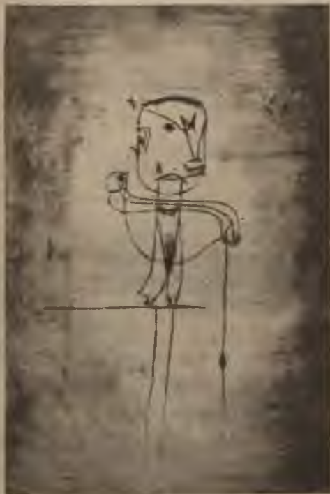
Pauls Klee: Zvejnieks.

Atklājot 1937. g. Vācu mākslas namu, Vadonis savā ievērojamā runā spilgti notēloja mākslas stāvokli pagrimuma laikmetā un skaidri nosprauda jaunās vācu mākslas