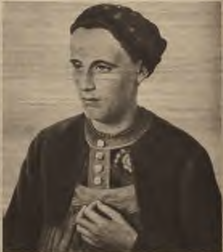
Hermann's Tieber's: Vācu zemaiete.

Tajos bēdīgajos laikos tiešām daudzi jo daudzi turējās pie mākslas kritiķa žīda Al-