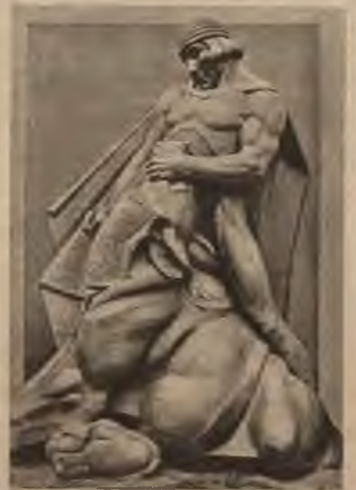
Lāčplēša tēls Brīvības piemineklim Rīgā (mets).