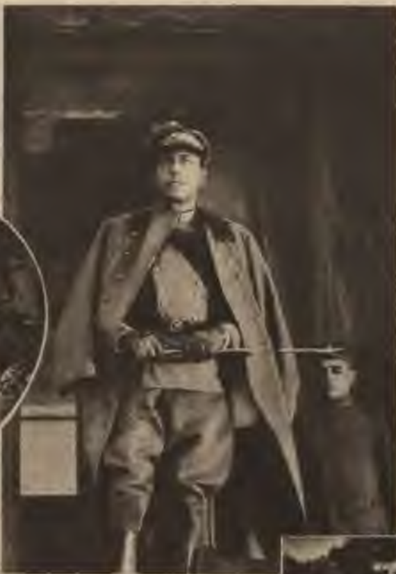
Willy's Birgel's filma „...Auļo pār Vāciju”.