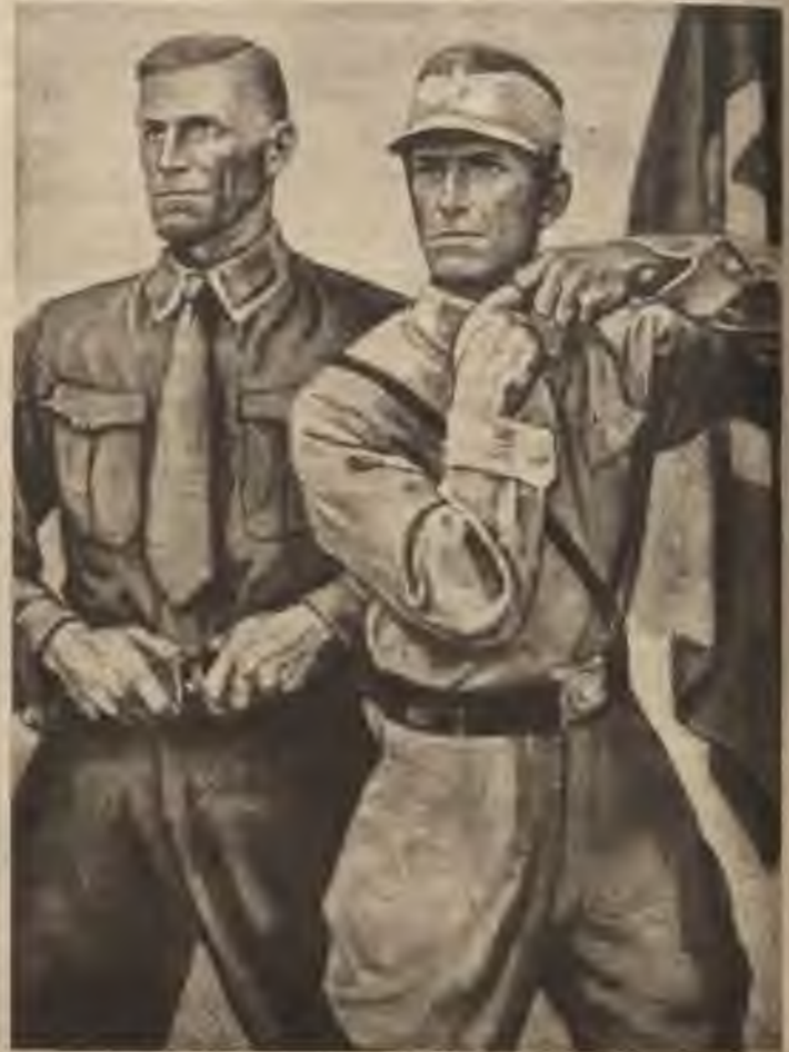
Elk's Eber's: Aicinājums 1933. g. 23. februārī.

frēda Kerra receptes: „Nevajag jautāt, vai kāda lieta ir vērtīga un aizstāvama, bet gan, ko ar šo lietu var izdarīt un panākt.” Proti — kādus veikalus var ar mākslas darbu