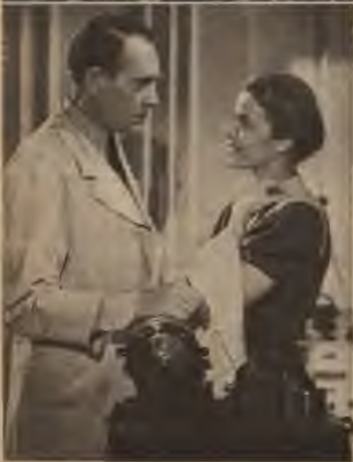
„Es apsūdzu” ar Heidemarie Hatheyer'i, Paul'u Hartmann'u, Mathias Wiemann u. c.

Filmā kāds iecienīts ārsts, paklausīdams savas slimās sievas lūgumam, palīdz tai aizmigt vieglā nāvē. Nonācis pēc tam uz apsūdzētā sola, pats apsūdzētais vērsas pret visiem tiem, kas viņu grib tiesāt, ar smagu pretapsūdzību: Vai nav vēl lielāks noziegums mākslīgi pagarināt kāda nedziedināma cilvēka