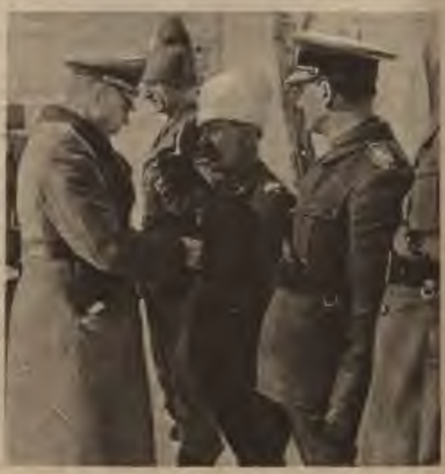
Feodosijas atgūšanā piedalījās arī rumāņu vienības. Par izcilu varonību rumāņu virsnieki saņem Dzelzs krustu.