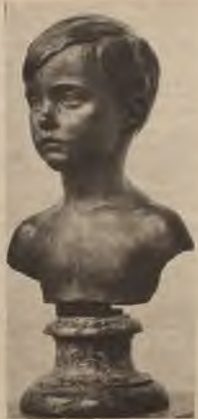
Max's. Bezner's: Zena krusu tēls.

augstāko darba veiksmi, seko skaistam, vecam izteicienam: rūgtas nēdējas dienas, bet liksmi svētki.