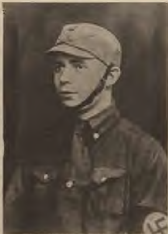
Horst's Wessel's, nacionālsociālistiskās kustības dziedonis un cīnītājs (1927. gada uzņēmums). Sturm- führer's Horst's Wessel's mira Berlīnē 1930. g. 23. februārī boļševiku noslepkavots.

Horst's Wessel's! Sai vārdā ir vācu atjaunotības vētra, skan soļojošo SA vienību cīņas sauciens; pār to plīvo liesmaini sārtaie karogi ar saules zīmi — kāšu krustu — baltā laukumā. Sai vārdā ir lepnums un spīts, gatavība un ziedošanās drosme; tas sen jau kļuvis par simbolu Vācijas jaunajai kustībai, uzvaras vainagotām cīņām un nāvei par jauno ideju, kurā vācu tauta iecerēja savu glābiņu. Horst's Wessel's — jaunatnes cīnītājs un tautas cīnītājs, par kuŗu viņš iestājās, kuŗai ziedoja savu darba sparū un laiku, par kuŗu beidzot mira, kad liktenis bija lēmis, bet kuŗā viņš arī mūžīgi tālāk dzīvos kā simbols.