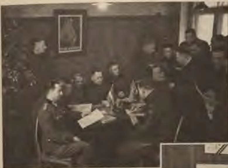
Brīvprātīgo pieteikšanās punktos no rīta līdz vakaram pulcējas latvju vīri parakstīt solījumu nesaudzīgai cīņai pret boļševiem.