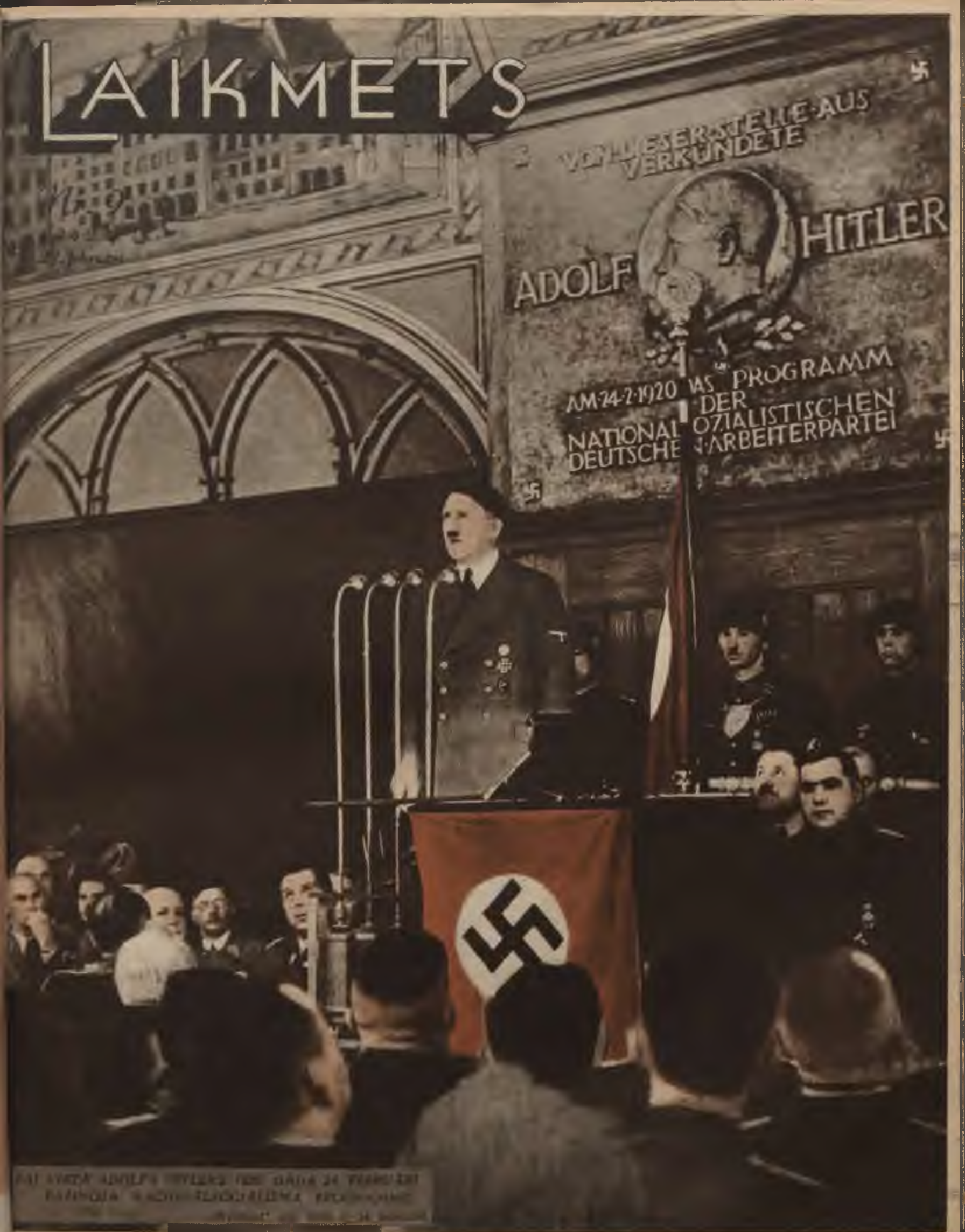
PAI LYDIA ADOLFS HITLERIS PES DADA 24 TAVANISI KÄÄNÖIA 9 KÖNIG-LENDUJEDNA PRO... ...