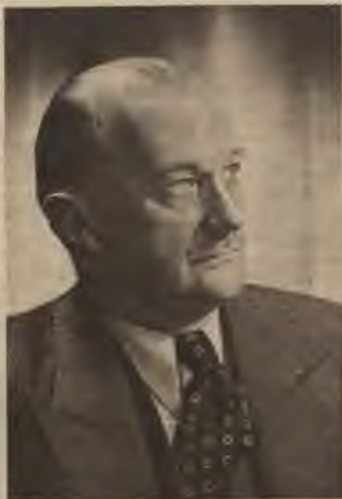
Göttingenas universitātes prof. A. Windaus's, kam lieli nopelni vītāmīnu ķīmijas problēmu atrisināšanā.

Göttingenas universitātes laboratorijās prof. A. Windaus'a vadībā atrisināta D vītāmīna ķīmijas problēma, tā kā tagad šo rachīta dziedniecībā tik ļoti nozīmīgo vielu ražo arī mākslīgi. Prof. A. Windaus's pirmais pareizi noteica arī B 1 vītāmīna sastāvu. Līdzīgā virzienā strādā arī R. Kuhn'a vadībā esošais ķeizara Wilhelm'a institūts Heidelbergā. R. Kuhn'a pasaulesla-