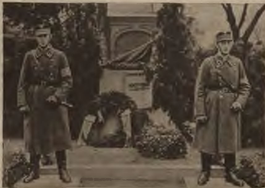
Horst'a Wessela kaps.

Sai dziesmā šodien, tāpat kā kādreiz, dzīvo dziedonis un cīnītājs Horst's Wessel's. Sai dziesmā ir viņa un visas vācu nācijas lielā ticība un uzvaras pārliecība. Nacionālsociālistiskās kustības vadīta un uzticīga savam iemīļotajam Vadonim, vācu nācija izpilda savu pienākumu šai kaŗā, kas jāizcīna par jaunu un labāku kārtību Eiropā.