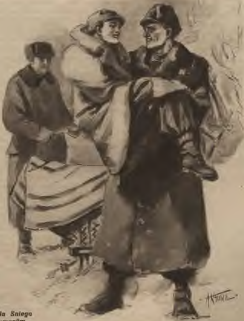
Dāgs izcēla Sniega Rozi no kamanām.