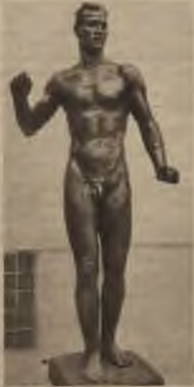
Georg's Kolbe: Jaunais cīnītājs. Un tāda izskatās mākslinieciski vērtīga skulptūra, kas rāda spēku un daiļumu.