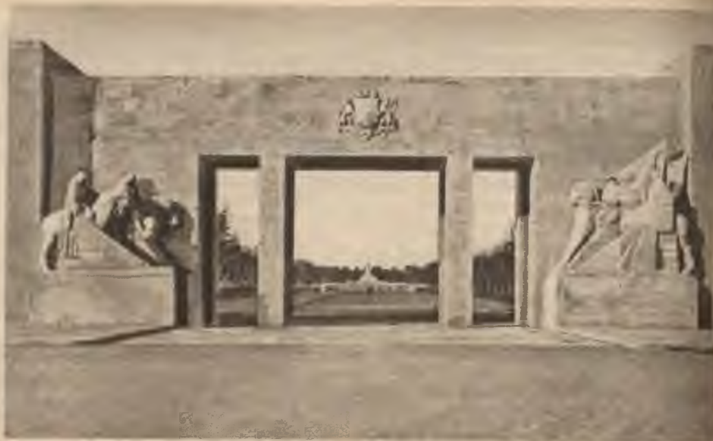
Brāļu kapu ieejas vārti.