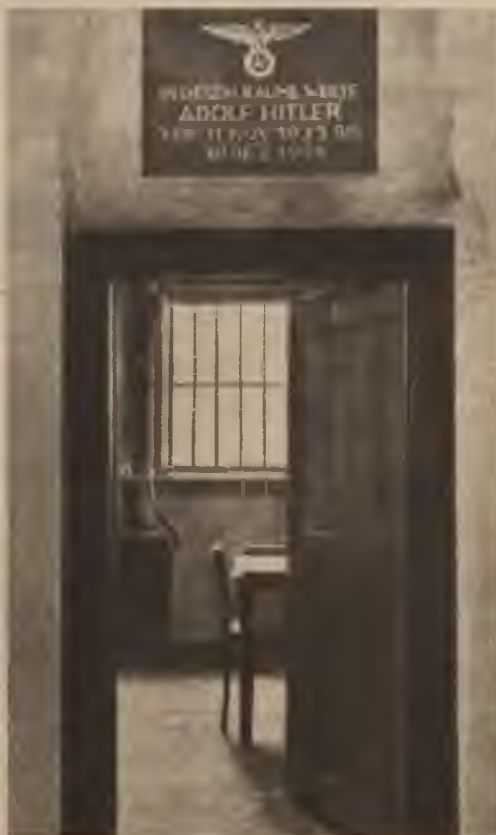
Landsbergas cietokšņa istaba Nr. 7, kur Adolf's Hitler's sarakstīja savu ievērojamo grāmatu „Mein Kampf”. Vīrs ieejas — 1933. g. 7. novembrī piestiprinātā piemiņas plāksne.

Pieskaroties sociāliem jautājumiem, vispirms jāpievēršas jēdzienam par darbu (10. p.). Līdz šim demokrati un marksisti mācīja, ka darbs ir tikai ražošanas funkcija, par ko saņem naudu. Šī aplamā mācība samaitāja darba ļaudis, pamodinot viņos ļaunus instinktus. Tai jānostāda pretim uzskati par darba isto būtību un vērtību. Tas izpaužas pienākuma apziņā. Darbs pieder pie tautas kopīgās dzīves, kur visiem jāstrādā vispārīgai labklājībai. Starpība starp garīgu un fizisku darbu tādēļ zūd, jo darbs jāvērtē pēc spējām, kādas katrs cilvēks ieliek savā darbā. Pēc tā, ko katrs veic, spriež par viņa krietnu-