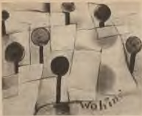
Pauls Klee: Koki.

Visos laikos mākslinieki pratuši cildināt savas dzimtenes āres. Bet ko gan nozīmē pasaules klaidoņiem žīdiem un viņu perversiem sekotājiem vācu ainava? Dabas skaistums te ļauni izķēmots.