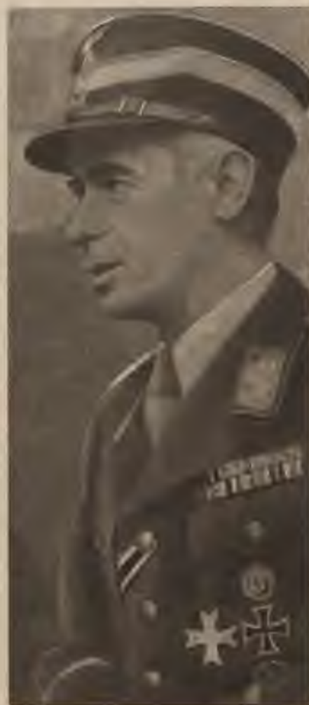
Von Tschammer und Osten's — Lielvācijas sporta dzīves vadītājs.

Kopš 1937. gada Lielvācijā riko Hitler'a jaunatnes ciņas spēles līdz ar sacensībām jaunatnei visdažādākos sporta veidos — slēpošanā, slidskriešanā, ledus hokejā, vieglatlētikā, boksa, peldēšanā, futbolā, rokas bumbas spēlē, lauku hokejā, ūdens polo, daiļlēkšanā, tenisā, šaušanā un skrituļu sportā. Tās risinās visos apgabalos finālistu izlasei. Finālisti satiekas jaunatnes meistarības izcīņās. Tur spītīgi redzami jaunatnes augstie sasniegumi. Dažās sporta disciplīnās vieglatlētikā jaunatnes sasniegumi ir valsts mēroga. Pagājušā gadā jaunatnes sasniegumi trisroli bija labākie valsti. Arī sprintā un augstlēkšanā tie tuvi meistarklases rezultātiem.