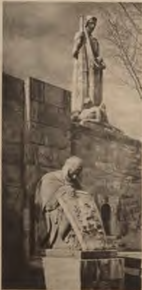
Brāļu kapu noslēguma siena ar heraldisko senlatviešu kapavīra figūru un Māti — Latviju.

Liepājas mūrnieka dēls, kas bija mācījies tālajā un svešajā Kazanā mākslas skolā, pēc tam Pēterpils Mākslas akadēmijā un tur pieredzē gūtās zināšanas pakļāvis savai latviskai izjūtai, bija atradis