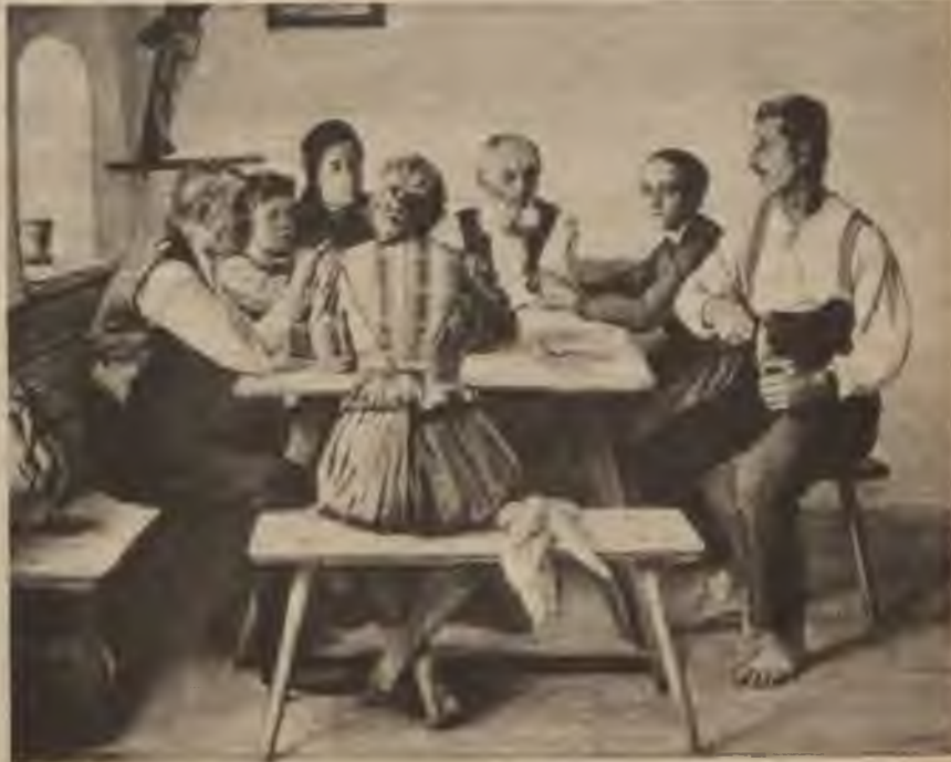
Baumgartner's: Zemnieki azaidā.

Zemnieks aizvien ir bijis boļševisma ienaidnieks. Tāpēc izvirtušā māksla ķengāja zemnieku, tēlojot to kā trulu un muļķīgu būtni, padarot viņu smieklīgu un nicinot zemkopja darbu.