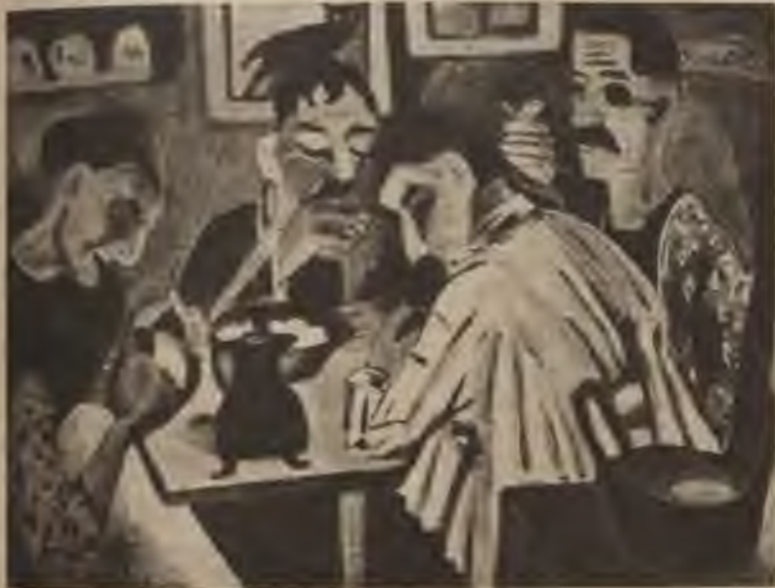
Kirchner's: Zemnieku azaidi.

Mākslai, kas aug no zemes un asinīm, jāvirza cilvēka gars un cilvēka dvēsele