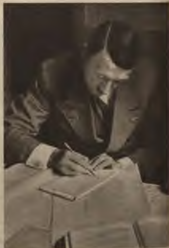
Tā radās Vadoņa lielle darbi. Visi grandiozie Vācijas jaunuzbūves darbi radušies, Vadonim personīgi ņemot tiešu dalību projektu izstrādāšanā.

Izejot no tā viedokļa, ka tautai, kuru vieno rase, asinis, valoda un parašas, ir tiesības uz valsti, partijas pirmais punkts uzstāda prasību par visu vācu apvienošanu Lielvācijas valstī. Kā zināms, pasaules karā Vācija ļāvās ievilināties miera priekšlikumā, kas nāca no Amerikas ar tā saucamiem Vilsona punktiem. Izrādījās, ka šis priekšlikums bija tikai blefs. Vācija nolika iero-