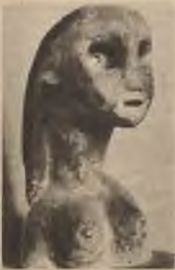
Hoffmann's: Meitene ar ziliem matiem.

Tikpat izvirtusi kā glezniecība bija arī tēlniecība. Tautai tika rādīti kropli idioti kā „mākslas darbs”.