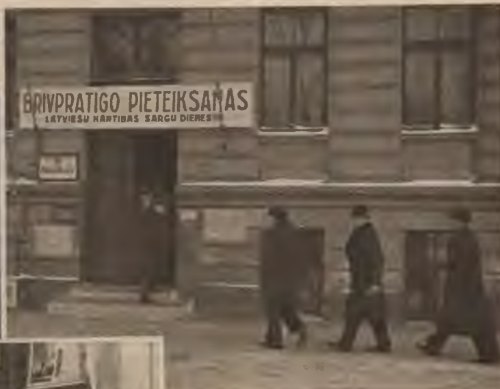
kiem. Ar kvēlu apņēmību sirdīs un smaidu sejās viņi atstāj reģistrēšanās telpas, lai dotu vietu nākamajiem.