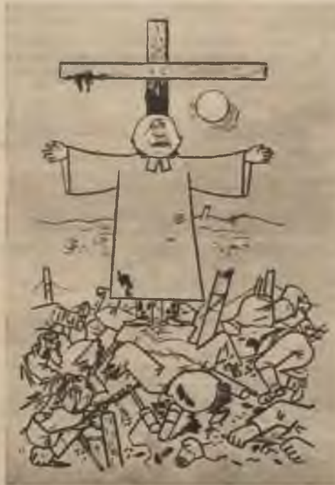
George Grosz, šis nožēlojamais boļševistiskais smērētājs, daudzos „darbos” pārspēj pats sevi frontes kaņavīru pulgošanā. Kāds žīdu mākslas rakstnieks saskata Groszā „aristokrātisku raksturu”. Galerijas kādreiz kārī pirka viņa noziedzīgos rokdarbus.