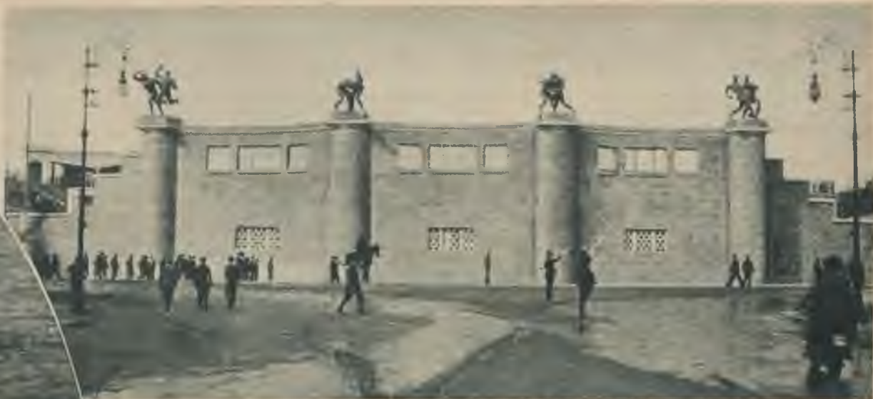
Fašisms audzina stipru jaunatni, gādājot arī par priekšzīmīgiem sporta stadioniem. Fašistu partijas sporta stadions Romā.