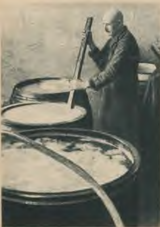
No alus brūžiem sapemto raugu vispirms skalo īpašos akmeņos, atdalot liekās rūgtuma vielas.