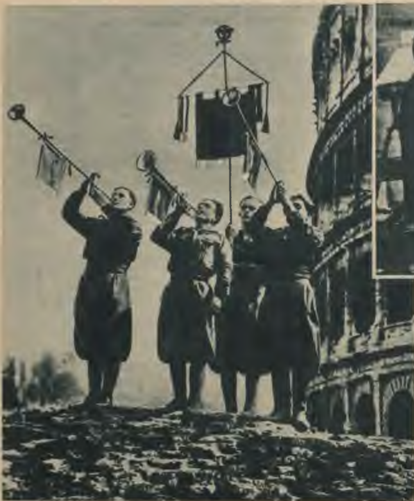
A u g š ā: Jaunā Itālija sauc! Uz senās Itālijas fona aug un vel- dojas jaunā fašistiskā valsts. Senais ilktoru varas simbols — rikšu salēklis ar tajā iesietu cirvi — apvienojis Itāļu tautu vie- nā ciešā saimē.