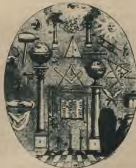
Brīvmūrnieku kabalistiski raibā simbolika, kuņā redzam 3 lukturus, bibeli, leņķmēru, cirkuli, globusus, rokas spiedlenu u. t. t.