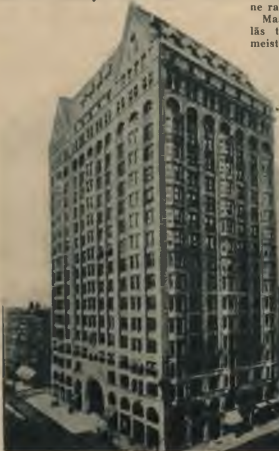
Žīdu lielloža B'nai B'rith Čikago pilsētā, kur notiek pasaules slepenās valdības apspriedes.

Ložām centās piesaistīt iespaidīgas personas no visādām aprindām, galvenā kārtā diplomātus. Ar to brīvmūrnieki gribēja realizēt savus politiskos nodomus. Pat baznīcu ievilkā šīni slepenā organizācijā, lai tā kalpotu brīvmūrnieku resp. žīdu interesēm. Tā, piemēram, archibīskapi Anglijā, Zviedrijā un citās zemēs iestājās ložās. Arī katoļu baznīcu mēģināja ievilināt masonībā,