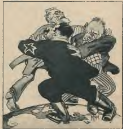
NESSVETĀ TRĪSVIENĪBA: Domā stumt un tiek stumti.

Kurpnieku arteļa „Staļina zābaks” vadība aprēķina peļņu.