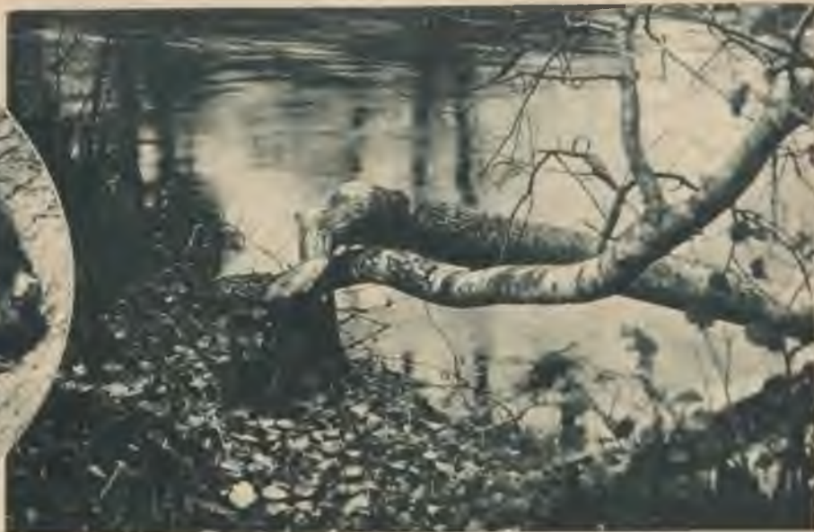
Pirmā nograuztā apse Kurzemes mežos.

Sumī, manu sabulīti, Tu noslīki Daugavā, Ūdru, bebru meklēdams, Kungam skaista kažociņa. (T. dz.)