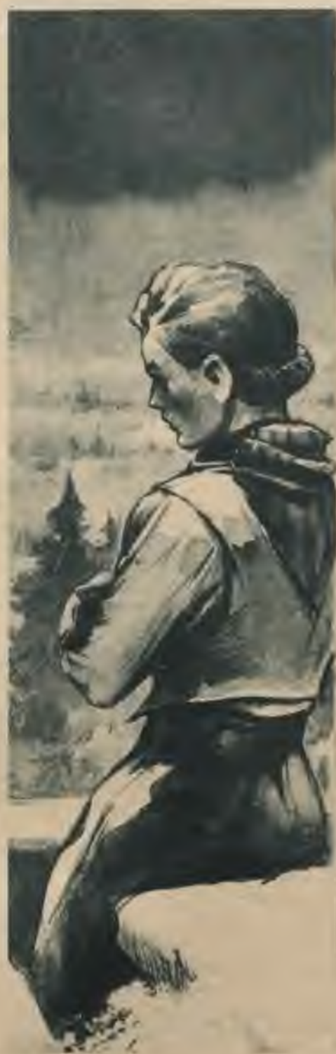
Tur viņa stāvēja kā sastingusi baltajā mēness gaismā un skatījās melnajā mežu svītrā pie apvāršņa.

„Tu, mīļā meitene, nemaz nepriecājies, ka es atbraucu! Jāslēpo tev būs vēl vai-