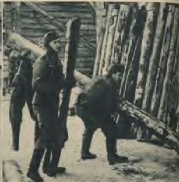
Lai aizsargātos pret bargo salu, vācu karavīri cēlušī blīvas balķu ēkas. Nodrošinot tās arī pret granātu šķembām, ārsienas nostiprina ar stāvbalķiem.