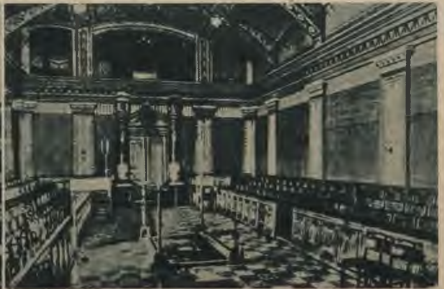
Budapeštas brīvmūrnieku templis, kur nav neviena loģa. Masoņi sapulcējas uz savām slepenām sēdēm tumšās telpās.