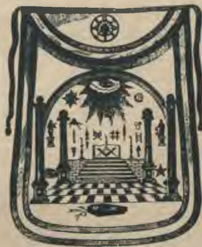
Prēkšauts, kādu lieto Vašingtonas ložas masoņi.