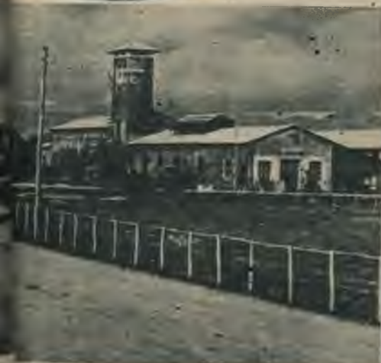
Viena no daudzajām Littorijas paraugsaimniecībām.