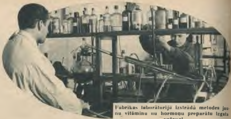
Fabrikas laboratorijā izstrādā metodes jaunu vitamīnu un hormonu preparātu izgatavošanai.