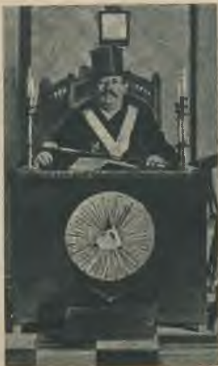
Eiropas brīvmūrnieks ložas tērpā.

bet tā pie laika atsedza brīvmūrniecības viltību. Tā 19. gs. pāvesti Leo XII, Pius VIII, Gregors XVI un citi ar savām enciklikām vērsās pret slepenām savienībām, sevišķi brīvmūrniecību.