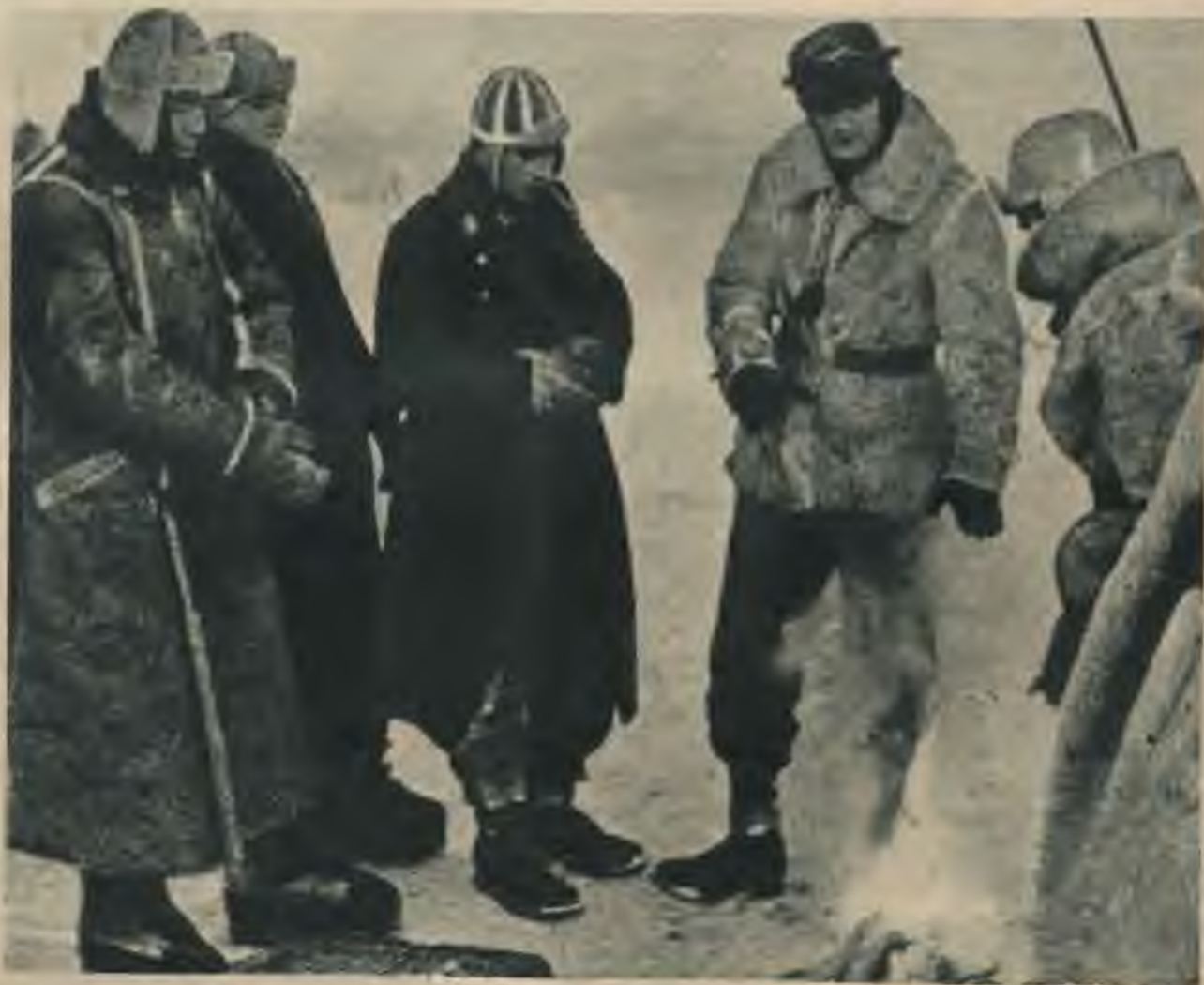
Sniegā un salā vācu kaņavīri austrumu frontē veido stingru valni Eiropas drošībai.