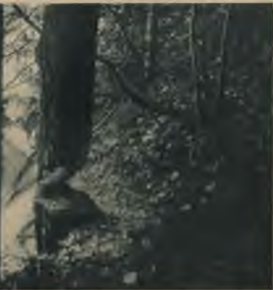
Simtgadīgais ozols arī bebra zobiem izrādījies par cietu.