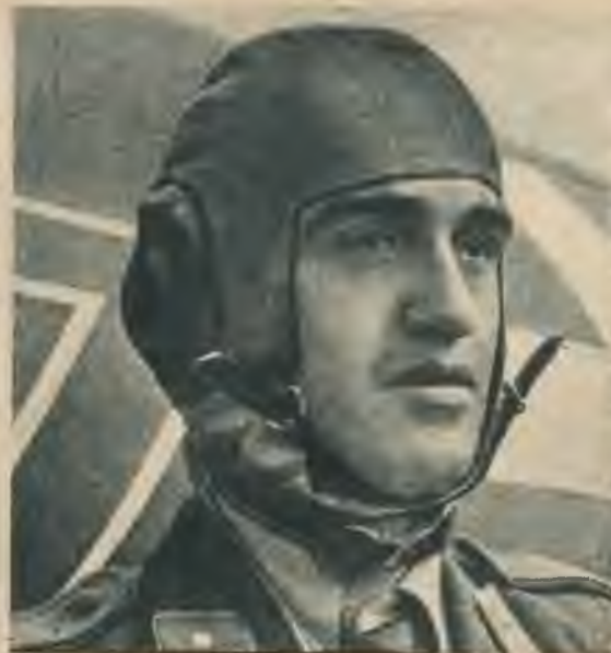
Viens no drosmīgākajiem ungāru aviā- cijas eskadrijas komandieriem, kas vairākkārt pieminēts virspavēlniecības ziņojumos par izciliem panākumiem gaisa kaujās.

Laikmets, ko mēs patlaban pārdzi- vojam, ir liels un vienreizējs. Pirmo reizi pasaules vēsturē visas Eiropas tautas apvienojušās kopējai cīņai pret boļševismu un angļu - amerikāņu ka- rā kūditājiem. Lielvācijas saktajai brīvības cīņai, bez Itālijas un Japā- nas, pievienojušās arī daudzas citas Eiropas tautas, kuŗas izpratušas jau- nā laika garu un savus pienākumus pret to. Rumānijas, Ungārijas, Slo- vakijas un Somijas karavīri, norveģu, dāņu, spāņu, beļģu, holandiešu, fran- ču un kroātu brīvprātīgo vienības ko- pā ar latviešu brīvprātīgajiem austru- mos atrodas cīņā pret boļševismu. Eiropas tautas sakusušas vienā kopē- jā saimē, ar vienotu domu un vienotu gribu. Vienotā Eiropa pieteikusi cīņu miera grāvējiem un tautu kalpinātā- jiem. Šī kopējā cīņa radījusi Eiropas tautu ciešu draudzību, ko nekāds spēks vairs nespēj dragāt. Kl.