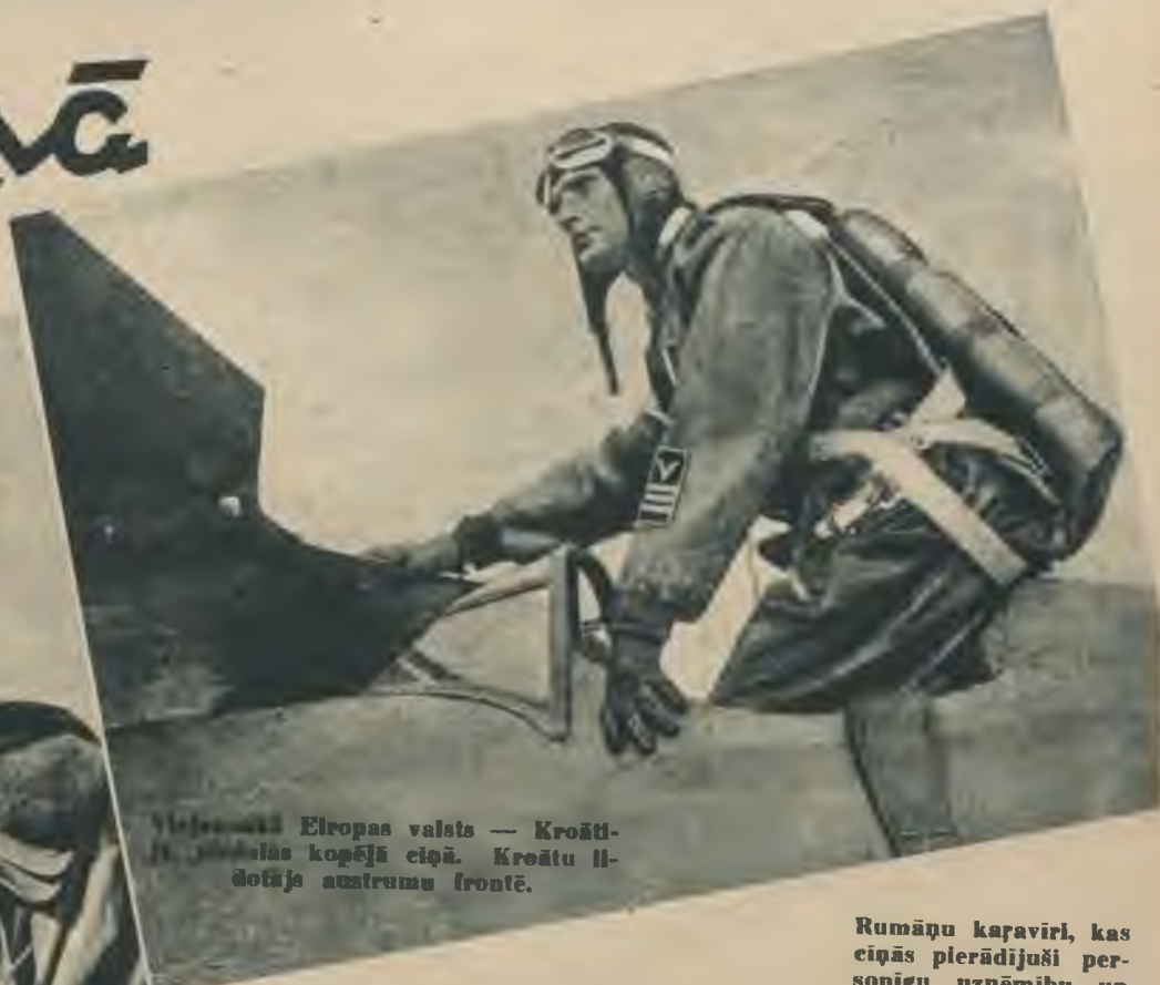
Viešmāts Ēiropas valsts — Kroāti- las kopējā cīņā. Kroātu li- dotājs austrumu frontē.