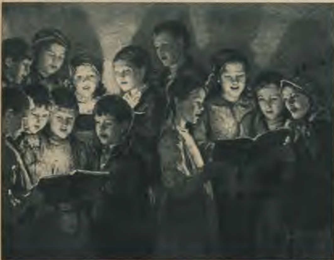
N. Bogdanovs - Beļskis — Bērnu koris.

dzošas radniecības ar līdzīgām celtnēm Lībekā Rāceburgā un Rostokā, generālkomisārs piegrīzās šodienas (pēdējos simts gados) tēlojošai mākslai, kas nav jāvusi ietekmēties no Pēterpils akadēmijas (izņemot nedaudzus māksliniekus), kā to varēja sagaidīt divi simti gadu ilgajā krievu virskundzības laikā, bet gluži otrādi — plaukusi kultūrālās attiecībās ar Vāciju. To liecinot apstākļi — daudzo šejienes mākslinieku izglītības smelšanās Drēzdenē, Diseldorfā un Minchenē. Daudzi no šiem māksliniekiem palikuši Vācijā, pat darbojušies par profesoriem vācu akadēmijā.