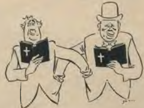
1942. g. jaungads Vašingtonā.