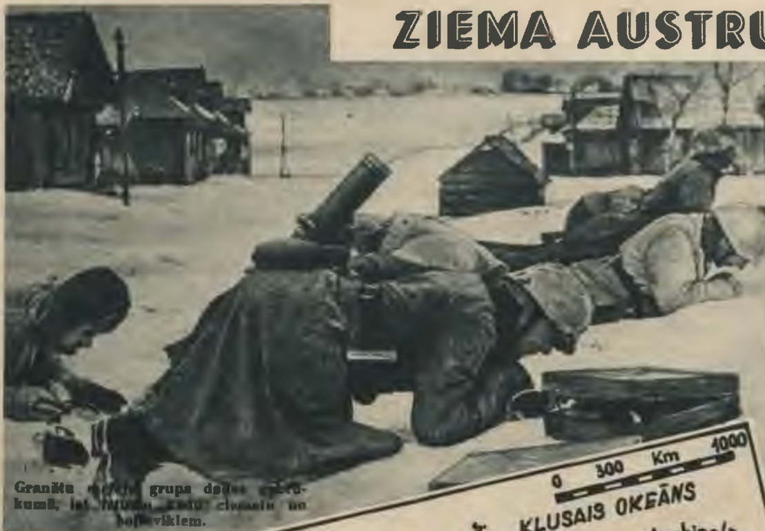
Granātu metēju grupa dodas uz priekšu, lai nodrošinātu celiņus un bojavīkiem.