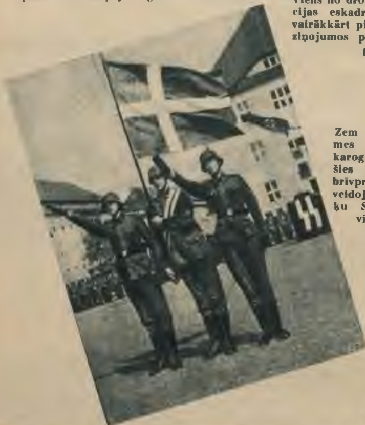
Zem savas zemes nacionālā karoga pulcēju- šies arī dāņu brīvprātīgie, iz- veidojot atsevišķu SS ieroču vienību.