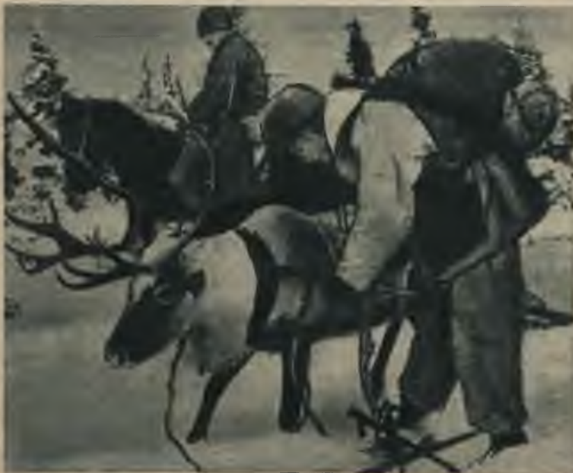
Somu vienības Ziemeļkarelijā apgādes transportā plašos apmēros izmanto ziemeļbricēkus, kas spēj pārvarēt dziļāko sniegu.