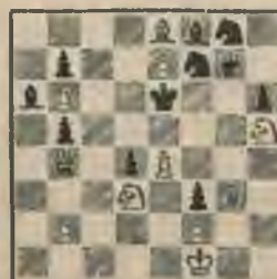
Mats 2 gājienos.