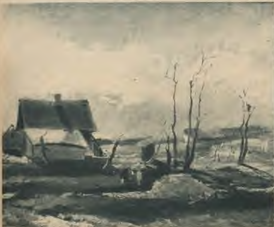
Edgars Kalniņš — Pavasaris.

MĀKSLAS IZSTĀDE RĪGĀ, PILSĒTAS MĀKSLAS MŪZEJĀ 22. I — 22. II 1942.