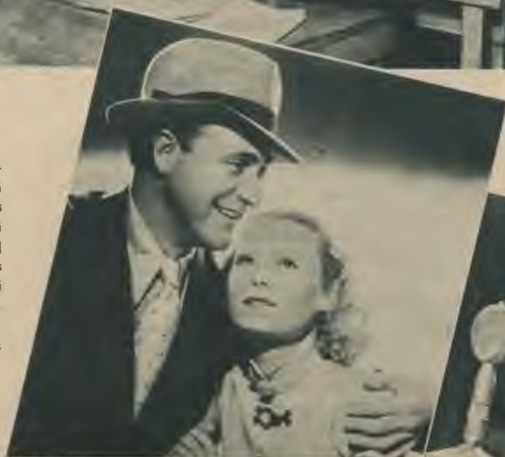
Lillian Harvey's un Will Fritsch's filmā „Laiques bērni”.

Neraugoties uz kara apstākļiem, vācu filmu rūpniecībā darbi rosīgi turpinās. Jaunās vācu filmu mākslas pamatā likts princips, ka filmai jāizceļ un jāstiprina tautas radošais gars. Filmai jābūt virzītājai un ceļa rādītājai. Blakus nopietna satūra mākslas filmām galavo arī vieglākas jautrības filmas atpūtas brīžiem.