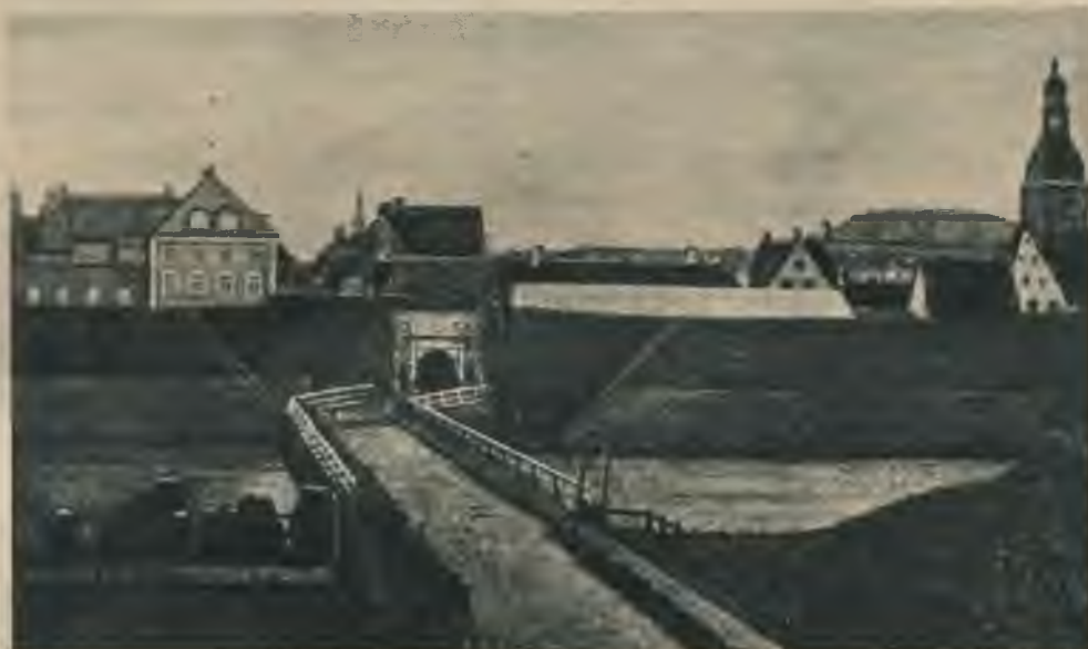
Smilšu vārti (iekšējie, Kaļķu ielas ga- lā). Pāri cietokšņa grāvīm veda sešstūrai- nlem ozola klučiem bruģēts koka tilts. Ma- zais tornītis aiz namu jumtļiem — Rātsnama tornis. Pa labi — Doma baznīca.

Ārējie Smilšu vārti (Smilšu ravelnā). Tilta galā pa labi laukums braucējiem, kur paba- rot un padzirdīt zirģus. Vļņpus vaļņiem no kreisās puses kādreizējā Reimersa acu kli- nika, pa labi no tās — konsula Wōhrmann's nams, aiz kuņ saskatāms paretzģeģo Aleksandra Ņevska bazģnģas kupols. Pa la- bi no Vērģmaņa nama — Hģnnģ cirka koka celģne.