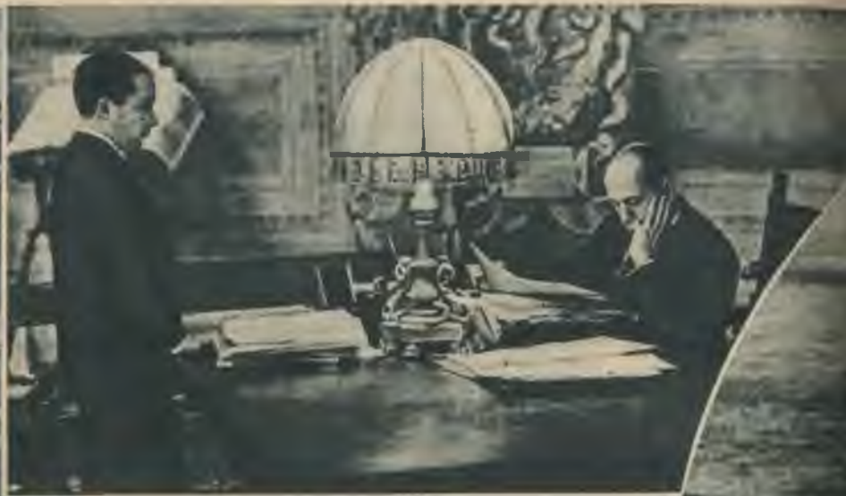
Itālijas duče Benito Musolini savā darbu kabinetā. Viņa priekšā uz galda patlaban uzšķirta „Carta del Lavoro“ — likums par darbu un strādnieku tiesībām.