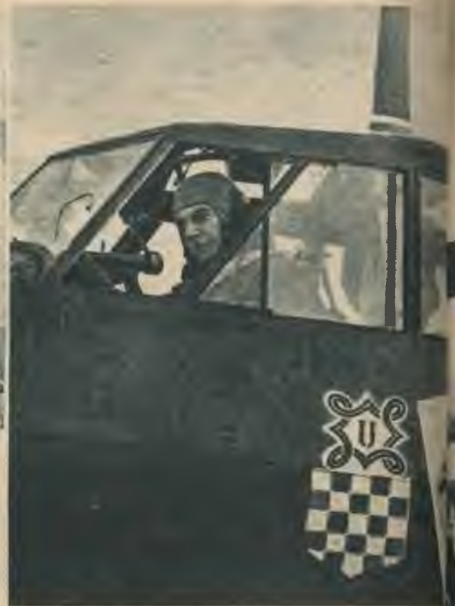
Kroātijas aviācija apgādāta modernā- kiem lidaparātiem. Lidmašīnas apzi- mētas ar Kroātijas ģerboni.