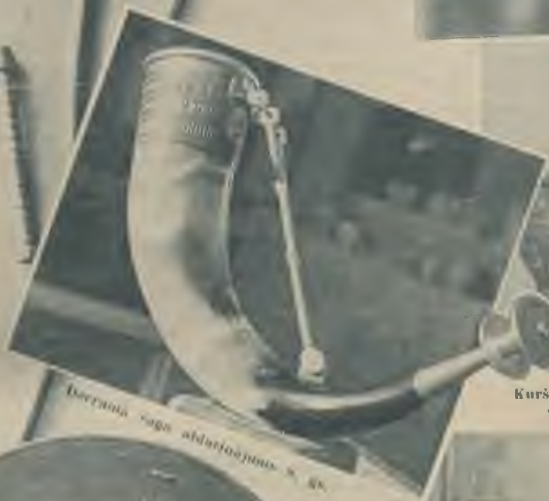
svaigā piens ierocēn alda stājumi.