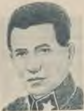
Ježovs — kas „likvidēja“ 386 ģenerāļus un 35.000 virsniekus.

iekļuva Ukrainas boļševiku partijas centrālkomitejā, pārīš gadus vēlāk viņš bija jau lauksaimniecības tautas komisārs un kadru priekšnieks. Židu atbalstīts, Ježovs vērsa uz sevi augstāko boļševiku uzmanību un Staļins viņam uzdeva izmeklēt Kirova nāves lietu. Ar to Ježovs sāka savu darbību čekā.