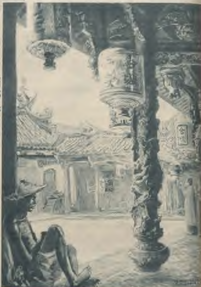
Ķīniešu budistu templis Singapurā — profesora Franza Klenmayer'a glezna.

Tagad japāņu ar ļoti lielām sekmēm ievadīt uzbrukumi šim Lielbritānijas kara flotes spēcīgākam atbalsta punktam austrumos tuvojas arvien vairāk un vairāk savam noslēgumam.