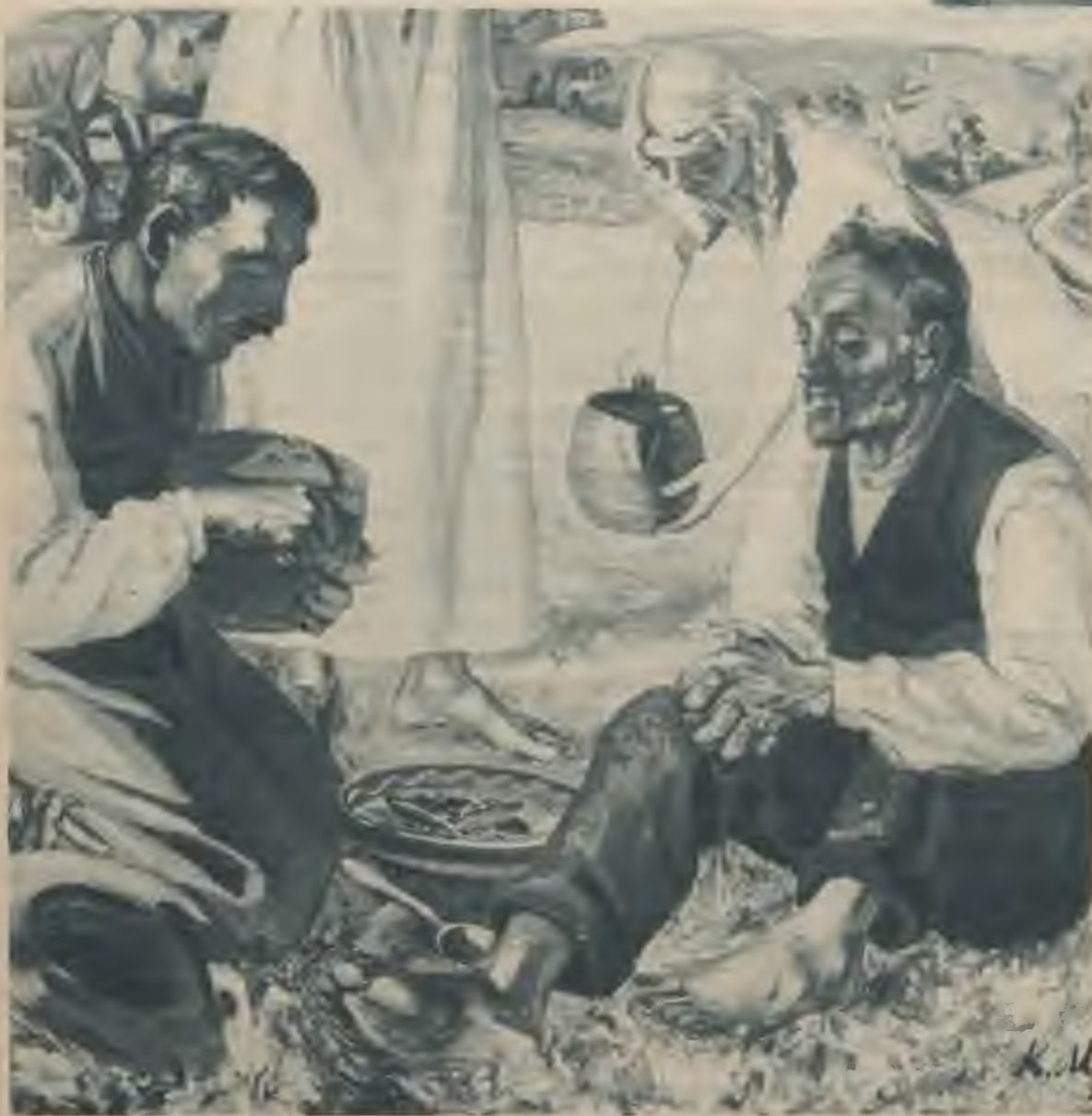
Kārlis Miesnieks — „Mūsu dieniško maizi doņ mums šodien“, Salaspils baznīcas altāra gleznas fragments.