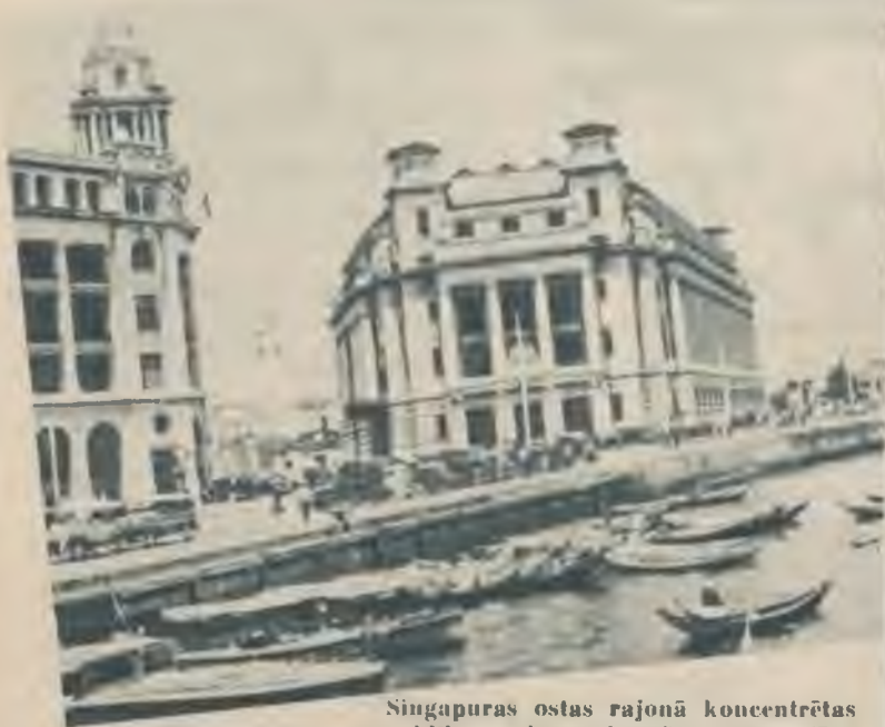
Singapuras ostas rajonā koncentrētas valdības galveno iestāžu celtnes. Tur visraksturīgāk pulsē šīs pilsētas dzīve.

Singapura ir sliekšnis starp diviem lieliem okeāniem — Indijas un Kluso. Angļi to ieguva vairāk kā priekš 100 gadiem un izveidoja šo stratēģiski svarīgo vietu par vienu no Lielbritānijas impērijas stiprākajiem cietokšņiem. To Anglija veikusi, kā angļi paši atzīstas, ievērojot arī amerikāņu vēlēšanos. Praktiski tas nozīmē — šķēpu, vērstu galvenā kārtā pret Japānu.