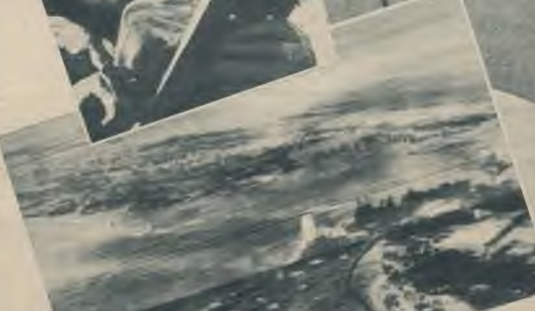
Kaujas kuģi, kas okeana dzelmē: Oklahoma, West Virginia, Arizona, Prince of Wales un Repulse.