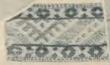
17. gadsimta audums