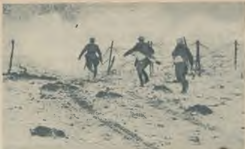
Ložu krusā pāri dzelozstieplu žogam vacu karavīri dodas triecienā.