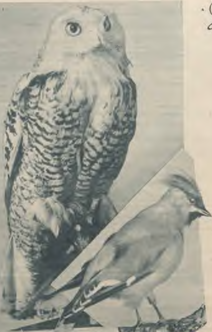
Augšā: Baltā pūce.

Baltā pūce, sniega pūce ( Nyctea nyctea L.), apdzīvo Āziju un Amerikas polāros apgabalus. Eiropā kā perētāja sastopama Skandināvijas ziemeļu daļā, Lapzemē un Ziemeļkrievijā. Tā stalta un spēcīga, gandrīz ūpja liekumā. Pie mums parādās jau oktobra mēnesī. Mīl klajumus ar krūmiem un jaunām ataudziņām, no lieliem mežiem izvairās. Pateicoties baltajai krāsai, to var ieraudzīt tikai vērtīga acs. Perē tāļos ziemeļos — tundrā; ligzdu taisa zemē, kurā atrod 6—7 nelīri baltas olas. Pie mums baltās pūces galvenā barība zaķi, kurus tā viegli pieveic; netaupa arī irbes.