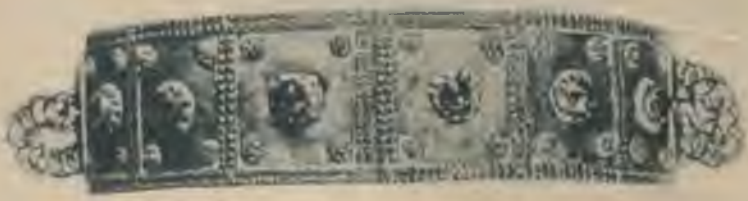
Ventspils viriešu jostas.