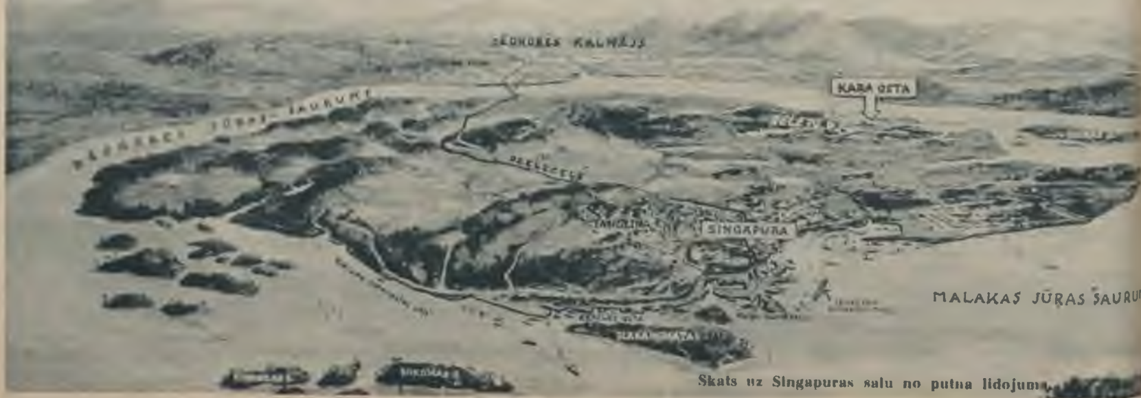
Skats uz Singapuras salu no putna lidojuma.