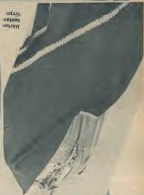
Slovāņu galvas- pota.