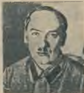
Trešais čekas priekšnieks — žīds Heršels Jagoda - Jehuda.

Jagodam uzņemoties čekas vadību, tajā notika daudzi pārkartojumi. Vispirms mainīja nosaukumu — čekas vietā radās GPU, ko vēlāk mainīja uz NKVD. Taču nosaukuma maiņa negrozīja šīs iestādes raksturu. Žīda Jagodas vadībā čeka kļuva vēl bries-