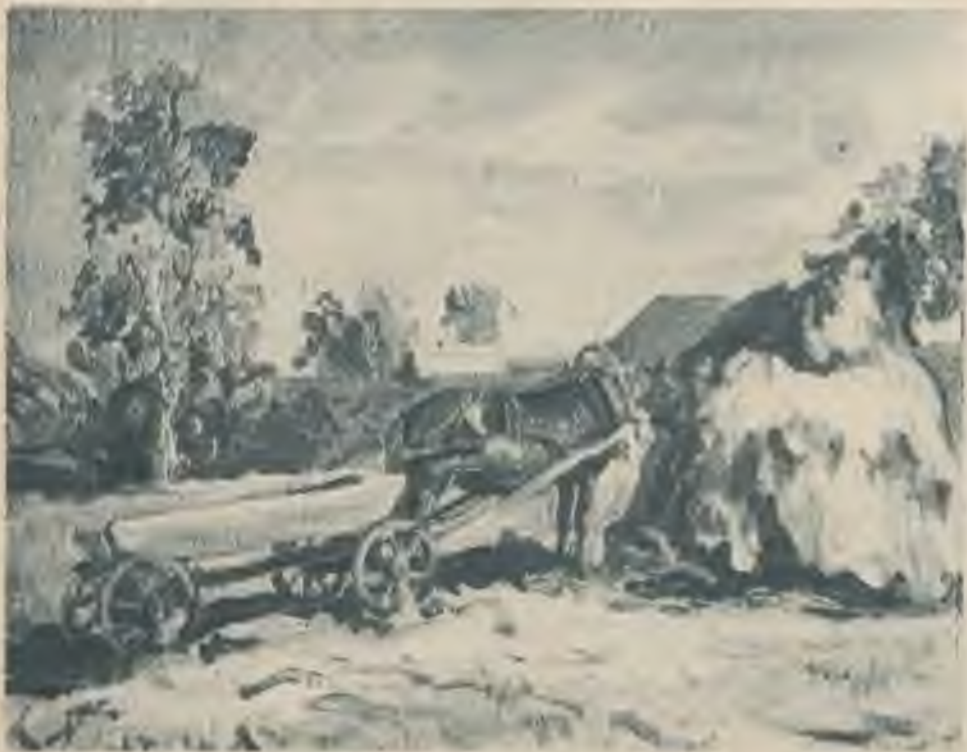
Kārlis Miesnieks — Rudens ainava.