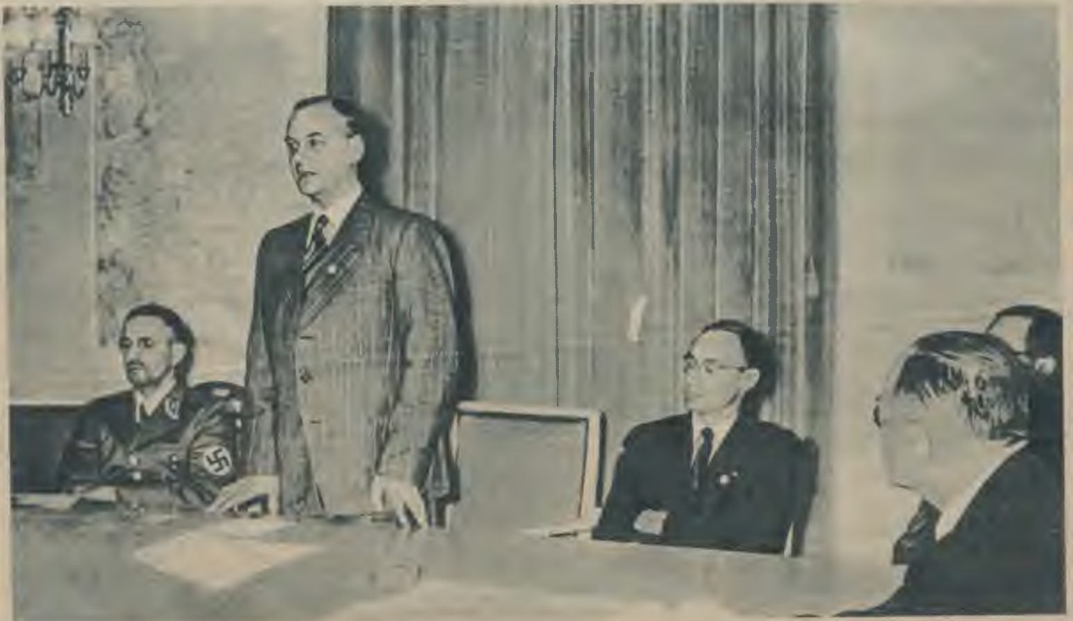
Reichsministrs iepazīstina Austrumu apgabalus Alfred's Rosenberg's sniedz paskaidrojumus vācu preses pārstāvjiem par saviem turpmākiem uzdevumiem.