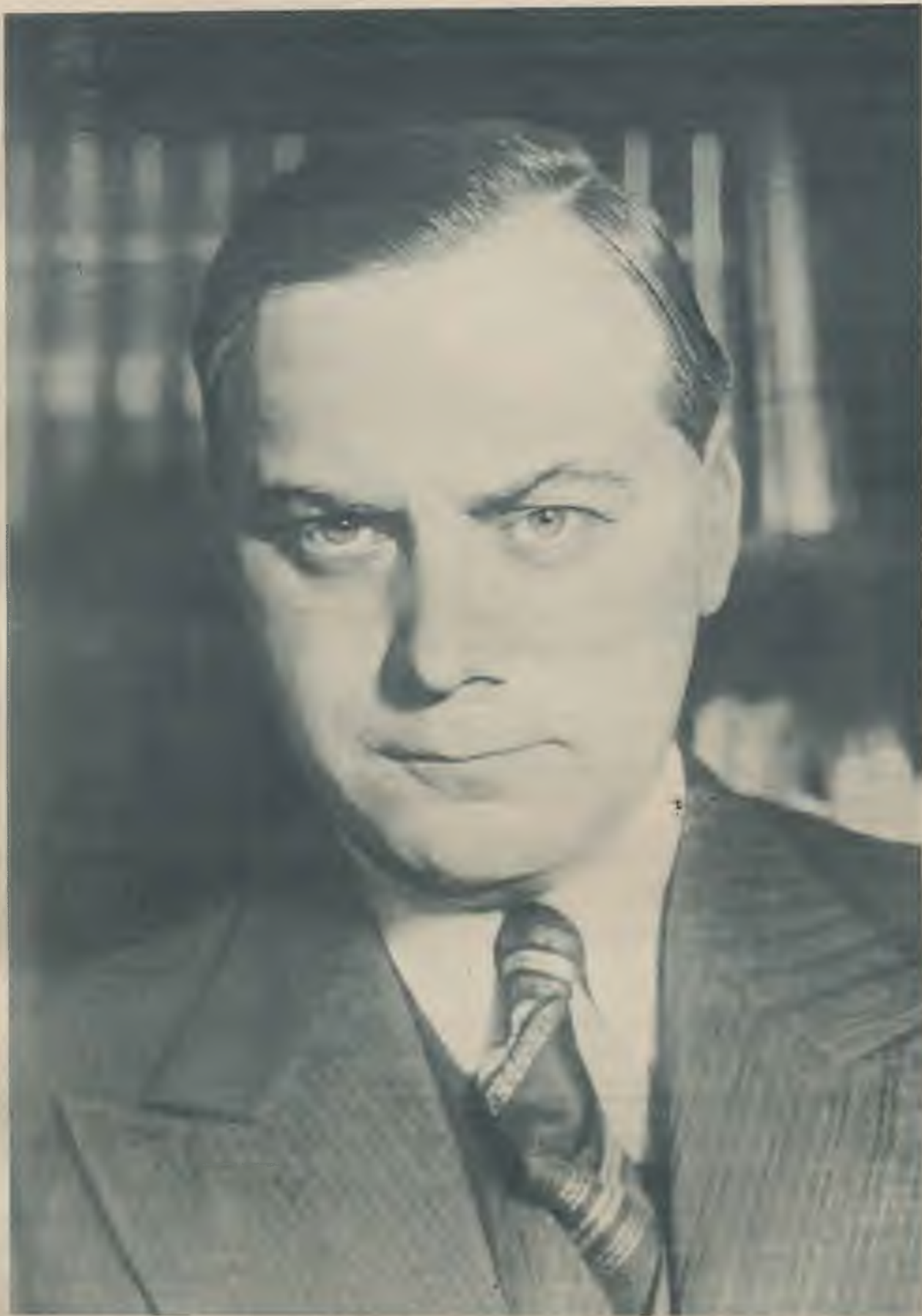
Alfred's Rosenberg's Reichsministrs ienemtiem Austrumu apgabaliem