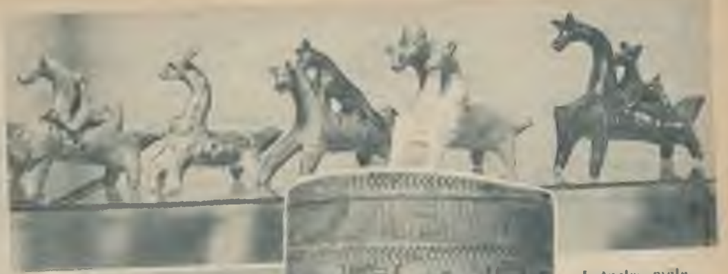
Latgales mala zirdziņi.