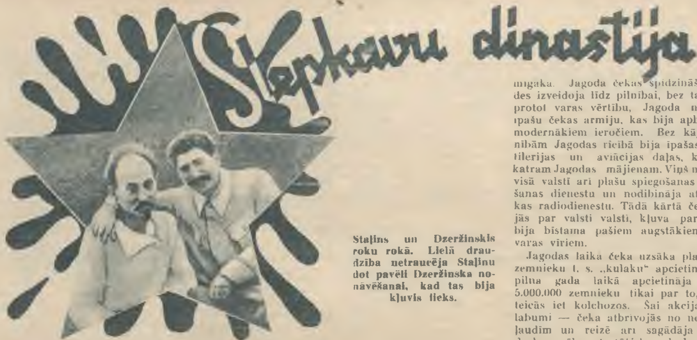
Staļins un Dzeržinskis roku rokā. Lielū draudzība netraucēja Staļinu dot pavēli Dzeržinska nonāvēšanai, kad tas bija kļuvis lieks.

Viena gada ilgais boļševiku valdīšanas laiks latviešus jau pietiekami labi iepazīstināja ar pasaules lielākā ārprāta režīmu. Viena gada sistās brūces latviešu tautai vēl ilgi nesadzīs, jo desmitiem tūkstošiem mūsu ģimeņu sēro par Sibīrijas tundrās aizvestiem piederīgiem, kamēr tūkstoši citu latviešu jaunekļu un viru čekas nomocīti un noslepkavoti tagad guļ smiltājā.