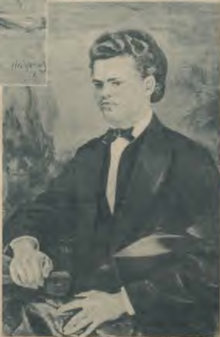
Kārlis Miesnieks — Ausekļa (Krogzemju Mikus) portrets.