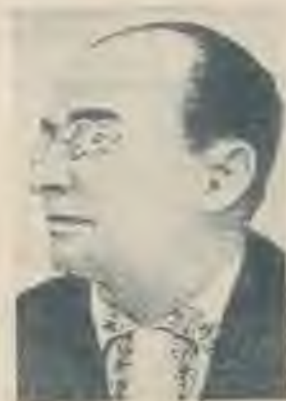
Berija — pēdējais valdnieks slepkavu dinastijā — vēl tagad turpina savu darbu.

Berija centās attaisnot Staļina uzticību. Slepkavu dinastijas pēdējais valdnieks varēja rīkoties vēl plašāk kā viņa priekšgājēji. Viņa rokās bija nodoti jauni miljoni boļševisma jenaidnieku Latvijā, Lietuvā, Igaunijā, Somijā, Polijā un Besarabijā. Šīs zemes viena gada laikā pārdzīvoja šausmas, ko tautas Padomju savienībā cietušas vairāk kā divus gadu desmitus. Tūkstoši latviešu,