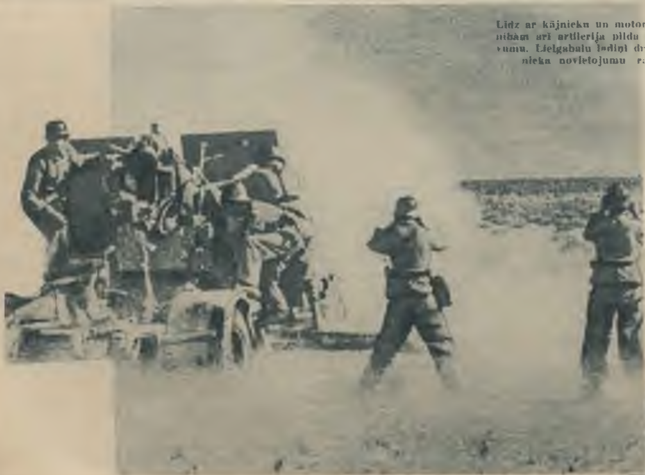
Līdz ar kājnieku un motorizētām vienībām arī artilērija pilda savu uzdevumu. Lielgabalu ierīši dragā ienaidnieka novietojumū rajonus.