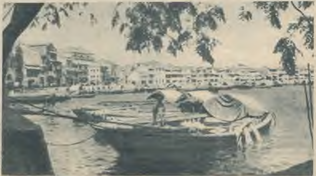
Attēla Singapurā piekrastei raksturīga ainava ar malajiešu laivām un ķīniešu džonkām, uz kupām vēl arvien lielā nabadzībā un netiramos mītnēs tūkstošiem iedzīvotāju, līdzīgi tam kā Šanhajā un Honkongā.

Un tomēr Singapūra ir viena no bagātākām pasaules pilsētām. Alva un kaučuks tieši 100 gadu laikā palīdzēja pārvērst agrāko džungļu pilsētu par metropoli ar vairāk ka 450.000 iedzīvotāju, par ievērojamā-