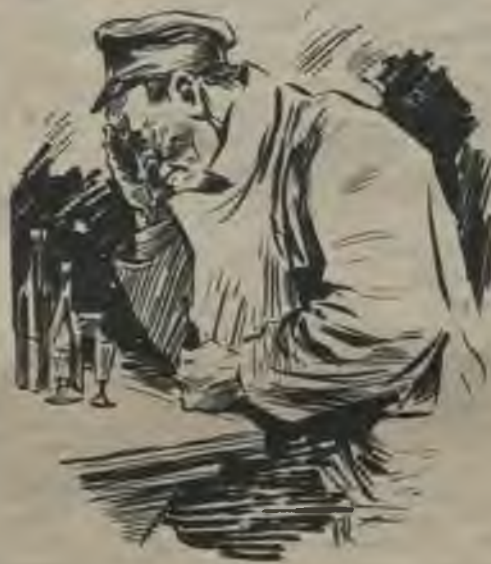
Saimnieks iegriezās centra krogā un dzēra šņabi un alu.

Tik ilgi un neatlaidīgi viņa skandināja par saviem cepšanas brīnumiem, kamēr