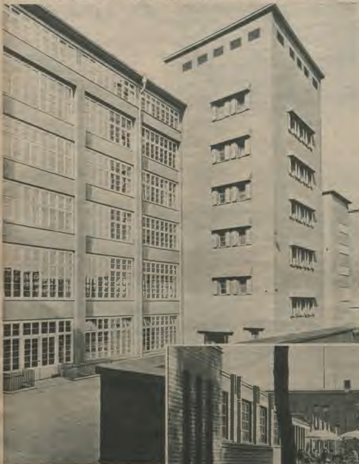
(Augšā.) Vācijas jaunas fabrikas, kurās tagad kopīgu darbu uzvaras nodrošināšanai veic daudzu Eiropas tautu strādnieki, ir ērtas un gaišas celtnes. Veselīgos darba apstākļos strādniekiem rodas iespēja vislabākajiem sasniegumiem.