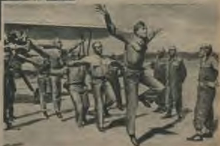
Pa labi: Nēģeru lidotāju priekšpulks. („Life”, 1942. g. 23. martā.)