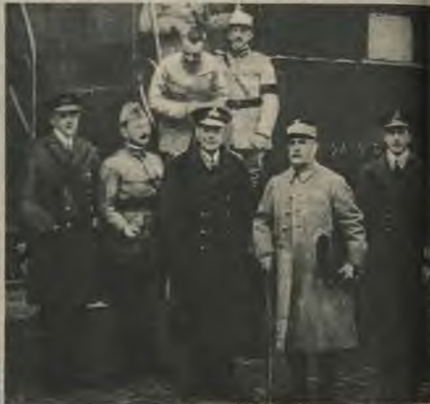
Sabiedroto armiju virspavēlnieks maršals Fošs ar pārējiem Francijas delegācijas locekļiem ierodas uz 1918. gada pamiera sarunām Kompjenas mežānā. Pa kreisi no Foša franču ģenerālis Veigans.

Sai garā arī risinājās sarunas, tika sastādīti pamiera notei-