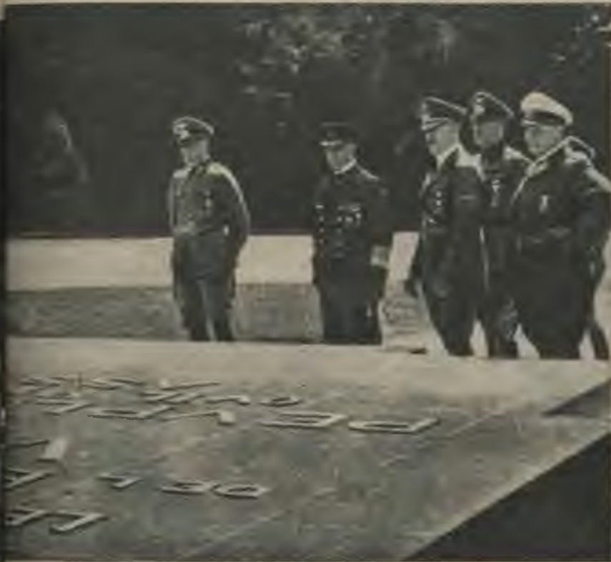
Vadonis 1940. gada 22. jūnijā Kompjēnas mežā pie piemiņas akmens, ko 1918. gadā tur novietojusi franči ar uzrakstu, kas nonievā vācu tautu un kam vajadzēja padarīt mūžīgu Kompjēnas pamiera negodu.