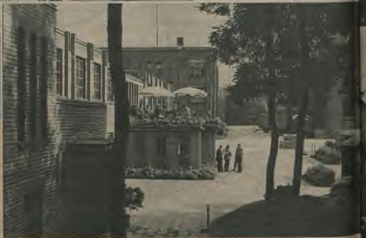
(Pa labi.) Darba vietas praktiskums savienots ar skaistumu: plaši un tīri pagalmi, ēnaini apstādījumi un gaišas terases sniedz veselīgu un patīkamu atpūtu.