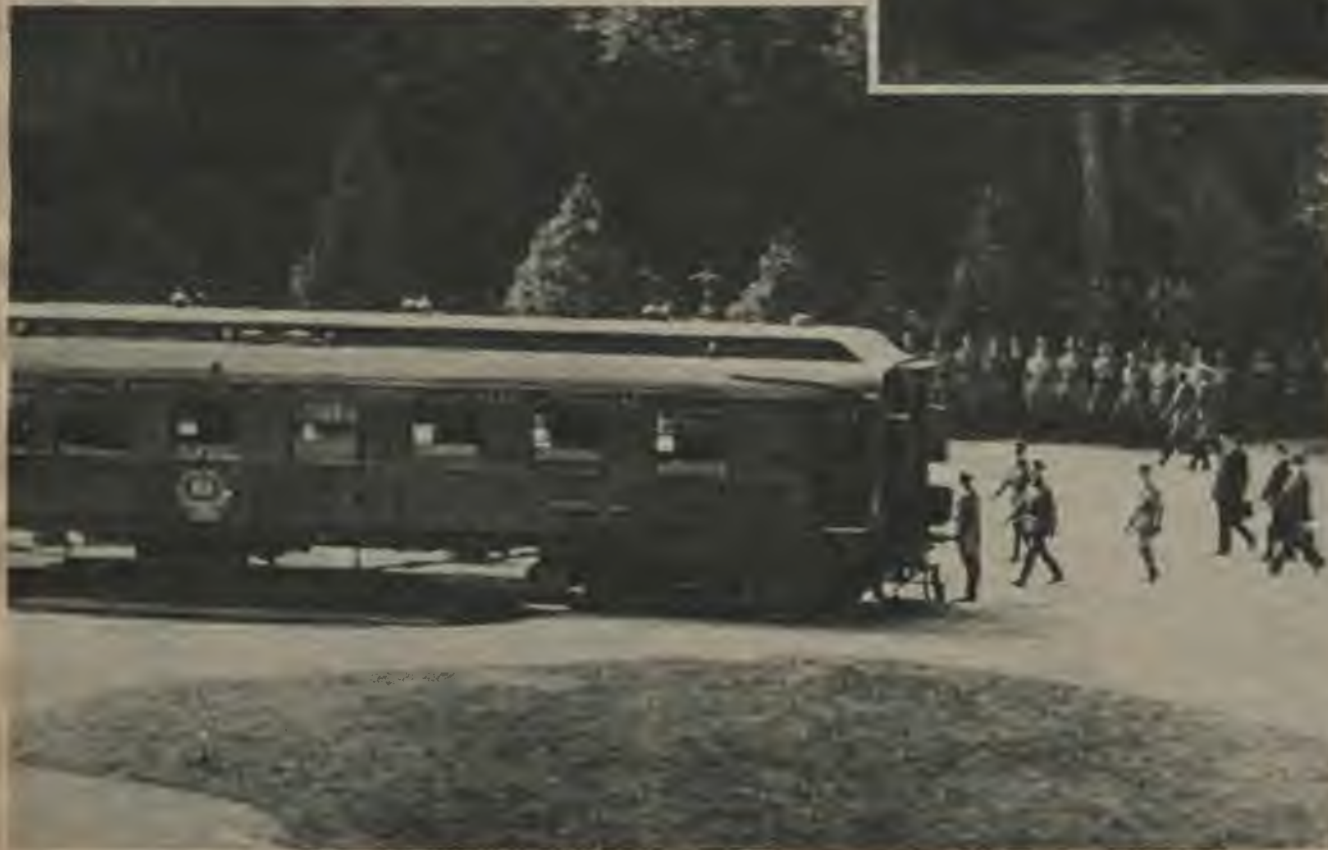
Kompjenas vēsturiskās stundas vieta — Francijas maršala Foša salona vagonu, kur 1918. un 1940. gadā risinājās pamiera sarunas. — Francijas delegācija ar ģenerāli Huncingeru priekšgalā 1940. gada 22. jūnijā ierodas uz pamiera sarunām Kompjenas mežānā.