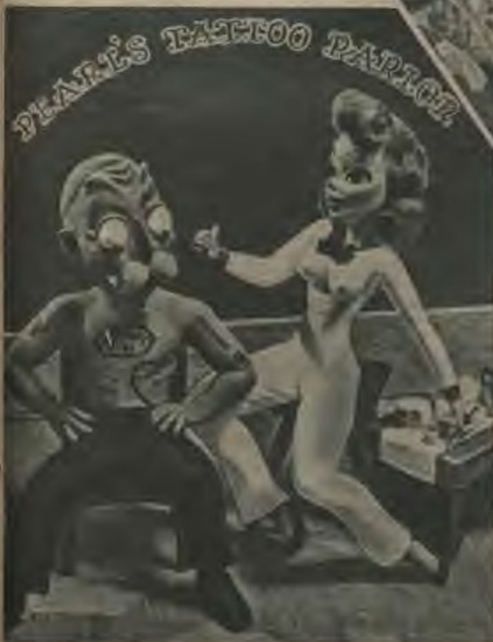
Pa kreisi: Pirms tu dosies uz Peru Harboru, liec sevi tetovēt! („Esquire” 1942. g. aprīli.)