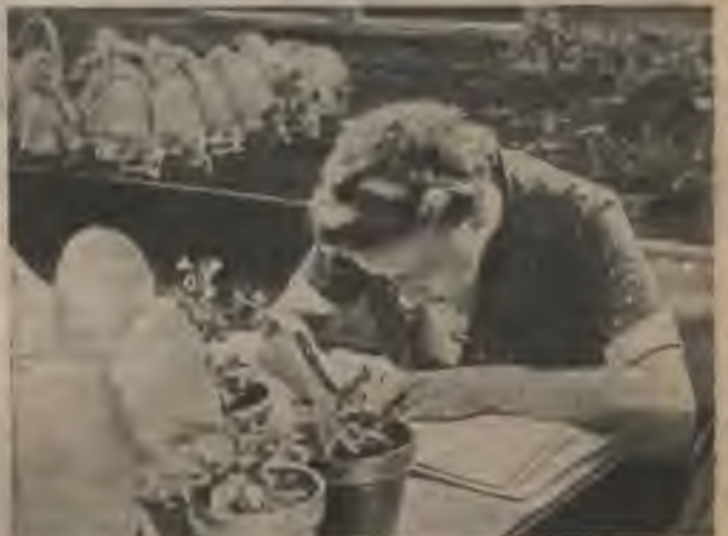
Daudz pūļu prasa kartupeļu stādu izturības izmēģināšana pret slimībām un kaitēkļiem.