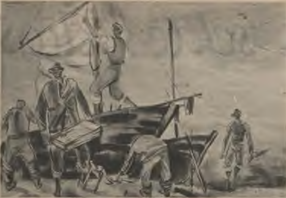
„Zvejnieki” — Gunars Hermanovska akvarelis.