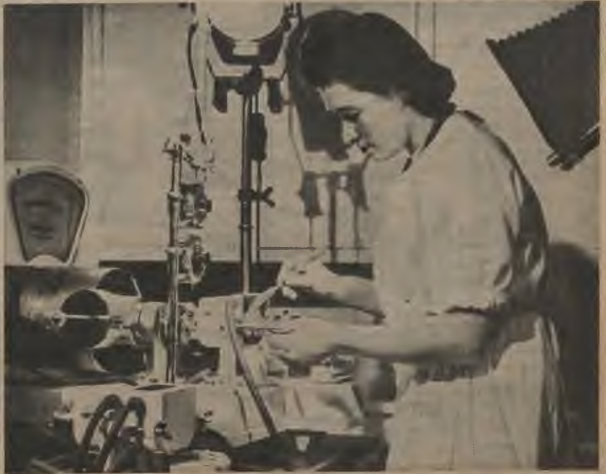
Ari magoņu ziedi pēc krustošanas tiek iesaiņoti, lai aizsargātu tos no kukaiņu pieņestiem ziedputekļiem.