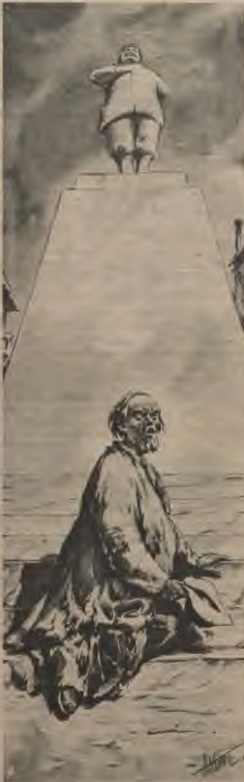
Bez cerības, bez vēlēšanās viņš lūdza kādu dāvanu.

Kuras kreisajā krastā no ūdens paceļas apsūbējušas, apdrupušas daudzstāvu mājas, kas līdzinās nocietinājumu vaļņiem. Tur gar drupu kaudzēm klaiņo armeņi, tur izgāz atkritumus. Taisni pretī ir ar granītu