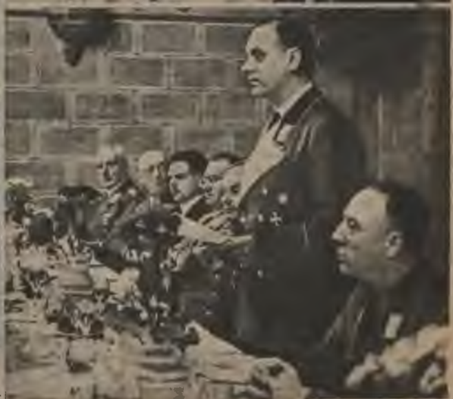
Reichsministrs uzrunā lūgtos viesus oficiālā pieņemšanā Lielajā Ģildē.