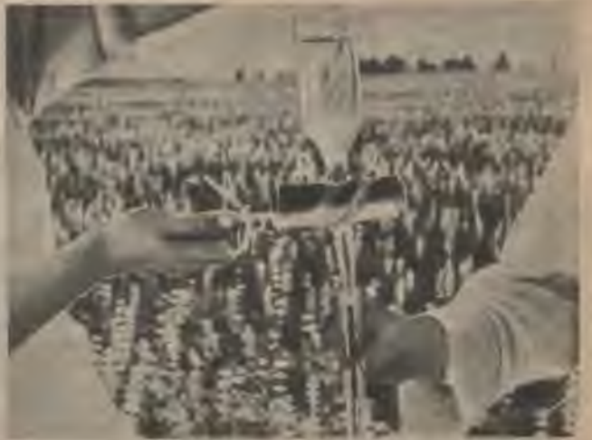
Pētnieki izmēģinājumos cenšas arī lopbarības lupīnām panākt augstāku barības vērtību.