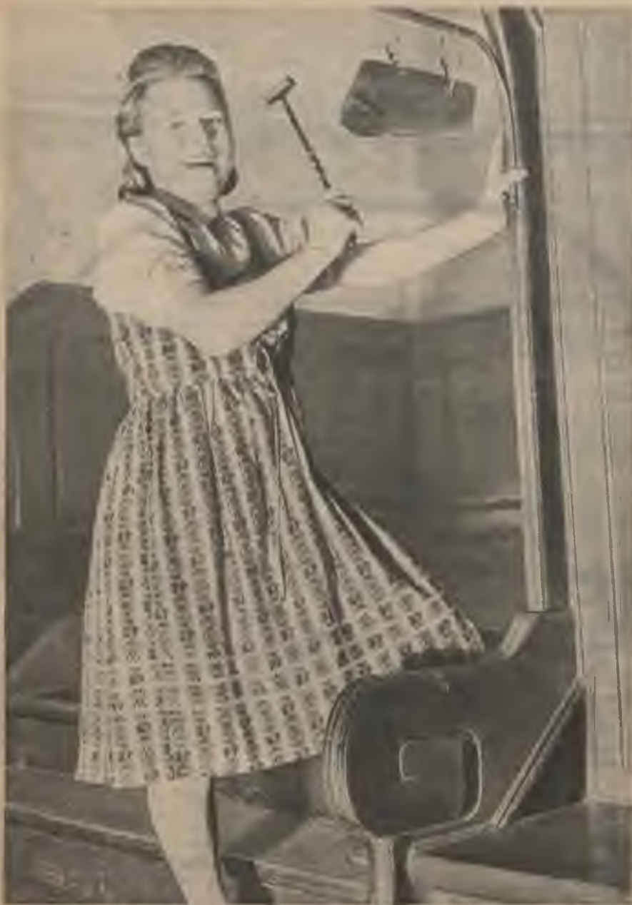
Arkla lemeša skanīga balss aicina kādas vācu zemnieku skolas meitenes kopīgā pusdienās.