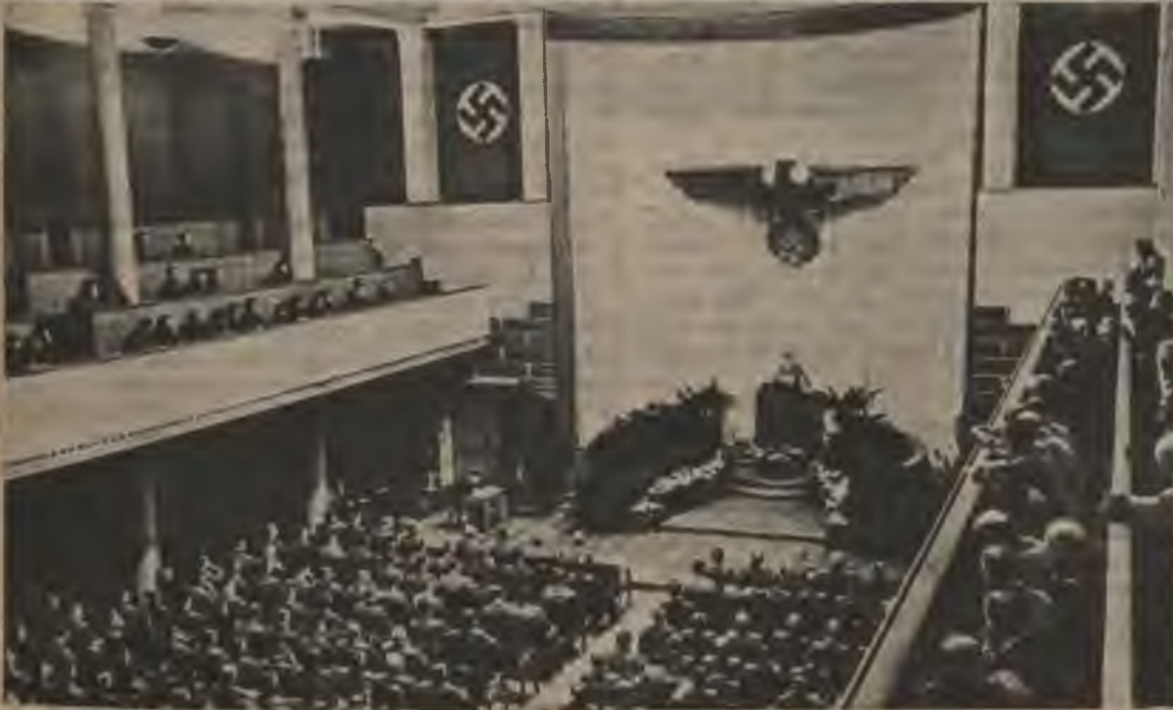
NSDAP Austrumu darba iecirkņa svinīga atklāšana Rīgas universitātes aulā.