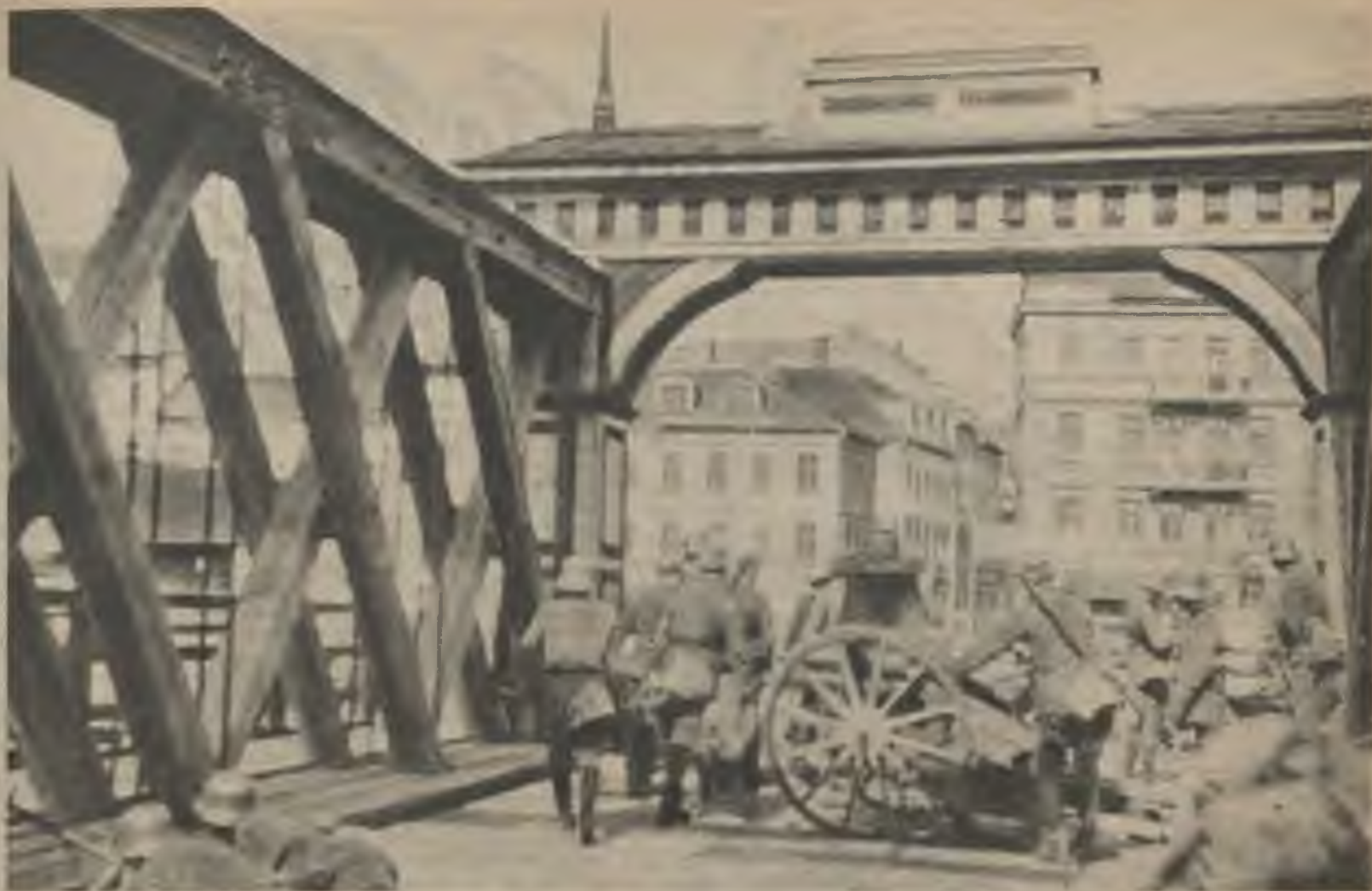
Rīgas atbrīvošana. Triecienu grupa uz Libekas tilta.

22. maija rīta agrumā noteiktajā laikā majora Fletcher'a un pulkveža Baloža kolonnas sāka uzbrukumu. Bolševiku pretošanās visur salauza, un jau ap plkst. 10 abas kolonnas savienojās pie Dzīlnām.