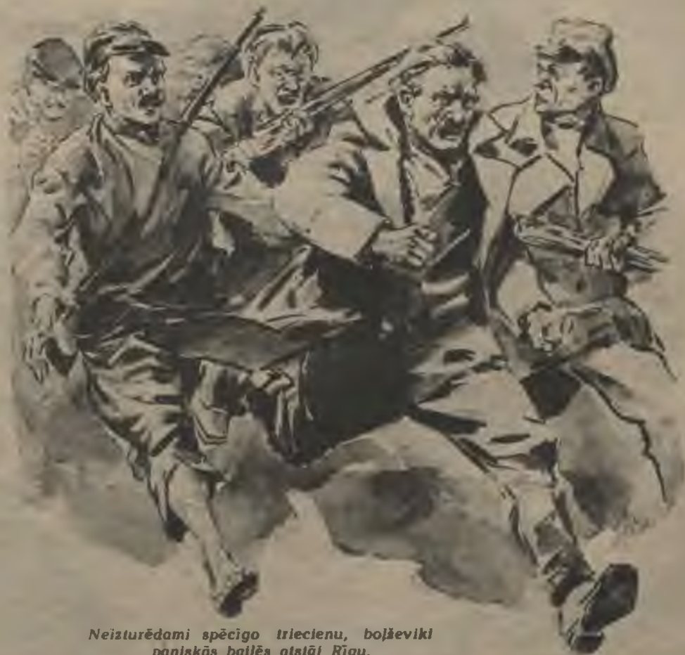
Neizturēdami spēcīgo triecienu, bolševiki paniskās bēgļās atstāj Rīgu.