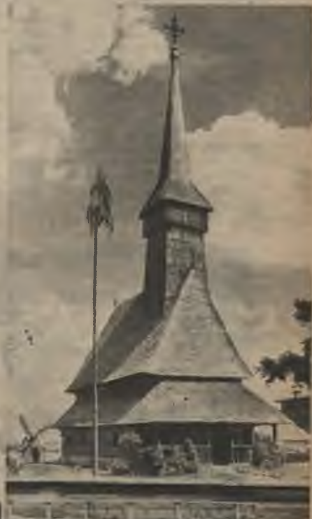
Pa labi: Lauku koka baznīca Transilvānijā. Rumāņu garīgā kultūra celta uz diviem stipriem balstiem — uz tēvzemes mīlestību un reliģiju. Viņu augstākais tikums ir pienākuma sajūta pret senču asinīm un svēdriem slacīto zemi.