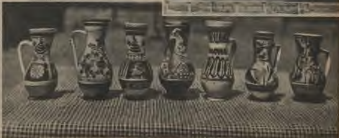
Apakšā: Mājrūpniecība un tautas māksla Rumānijā sasniegusi augstu līmeni.

tikai tagad isti redzams, cik rumāņu zeme bagāta.