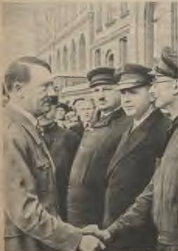
Vadoņa pateicība un atzinība nodrošināta katram radoša darba strādniekam.

Nav tāda vēstures likuma, ko cilvēku neprāts vai nepilnība varētu apgriezt otrādi. Katrs vēstures likums jāievēro. Vēl jo lielākā mērā tas sakāms par tagadējo laikmetu. Ricības likums ir jauno nāciju vadoņu rokās, kas nolikuši sev par mērķi sagādāt laimīgāku nākotni šā kontinenta cilvēkiem. Nav svarīgi, kādās dzīves formās šī nākotne kādreiz izpaudīsies. Galvenais ir tas, ka tiek iznīcināti visi tie spēki, kas nostājas preti un negrib atzīt šai topošajai nākotnei nepieciešamās dzīvības tiesības un vajadzīgo dzīves telpu. Par šo pirmatnīgo prasību pašreiz cīnās gandrīz visu Eiropas tautu labākie dēļi kaujas laukos austrumos. Un viņi stājušies šai cīņai ar atziņu, ka boļševisms un visi ar to sabiedrotie cilvēki un varas ir mūsu kontinenta jaunās kārtības visniknākie pretinieki. Notikumu norise