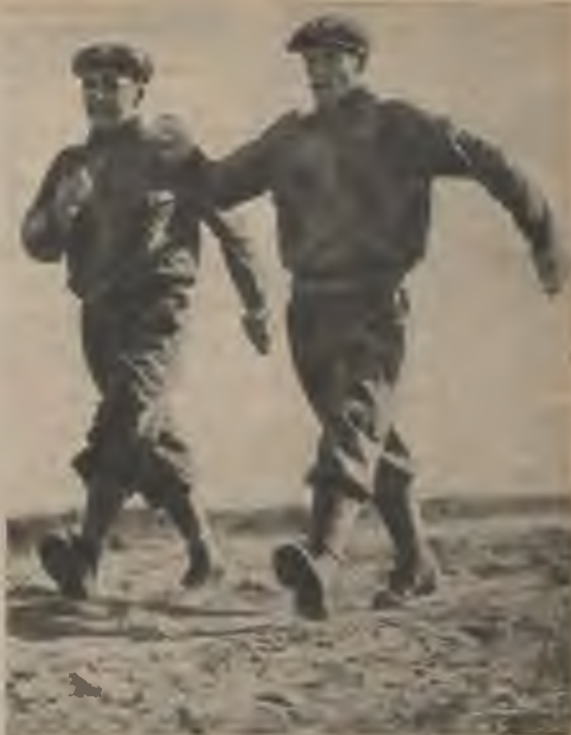
Soļojot meža skrējienā treniņos, ķermeņa augšdaļa ar paceltu krūškurvi jātur taisni. Elkoņos saliektās rokas brīvi ar spēcīgiem vēzļiem jāvirza uz priekšu un atpakaļ. Zemī vispirms skaļi papēdis, tad pēdas ārējā mala. Seko īss un ass atgrūdiens ar pirkstgaliem.

Lai to novērstu, meža skrējiena beigās jāizdara īsi starta vingrinājumi vai īsi skrējieni ar kāpinājumiem. Meža skrējiena ga-