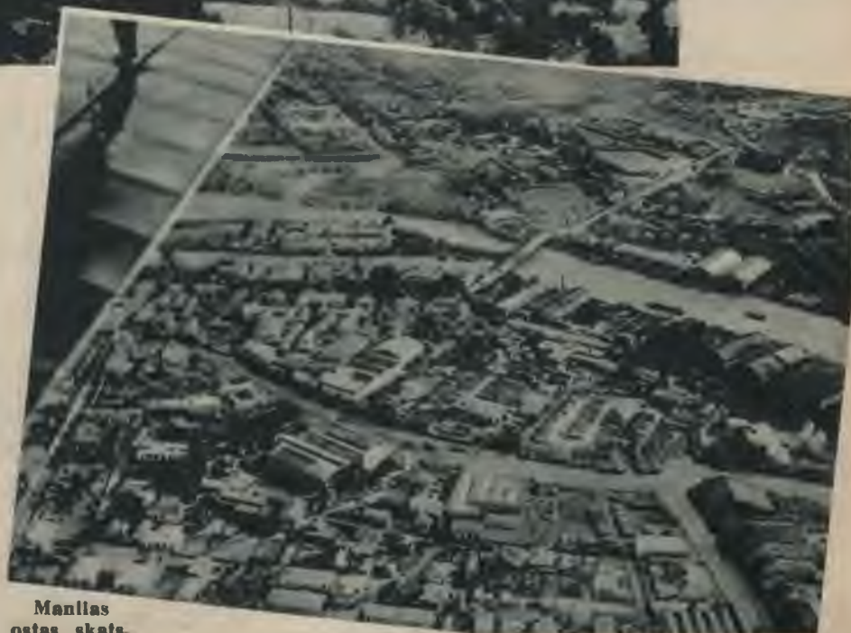
Manilas ostas skats.