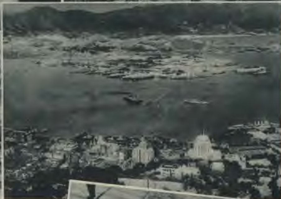
Honkongas ostas skats. Priekšplānā Viktoria-Siti, kas atrodas uz Honkon- gas salas; tā- lāk Kaulu- nas pussala.

cietinājumu galvenais uzdevums ir nodrošināt Malakas ceļu, pa kuru virzās 80% no visas tirdzniecības satiksmes. Miera laikā Singapuras ostā pietāja puse no visas pasaules tāl-satiksmes tvaikoņiem.