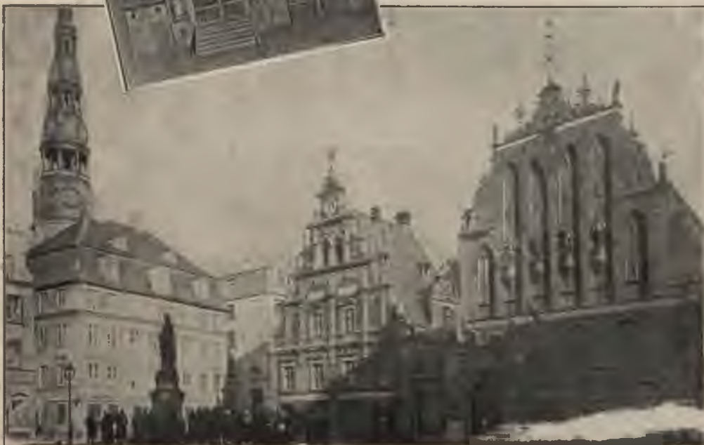
Tāds tas bija 1941. g. jūnija pēdējās dienās.