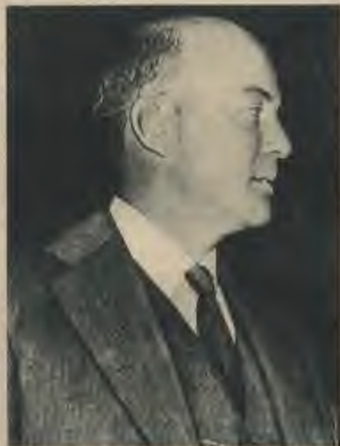
Ruzvelta uzticības vīrs amerikāņu vēstnieks Bullits.

1939. gada 12. janvāra ziņojumā vēstnieks Potockis ziņoja, ka Savienotas valstis iezīmējoties arvien lielāks naidis pret fašismu un visu, kas atgādina nacionālsociālismu. Propaganda galvenā kārtā atrodoties židu rokās, kuriem piederot gandrīz 100% radio,