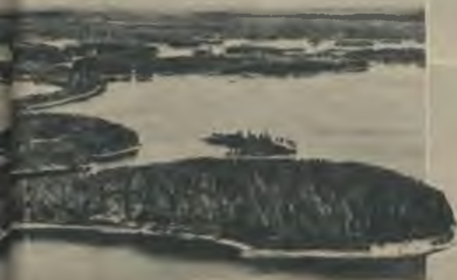
Viena no tūkstoš ezeru zemes jaukākām vietām ir Puncakarju — netālu no vēsturisko cīņu vietas pret krievu iebrukumiem — Olavsburgas.