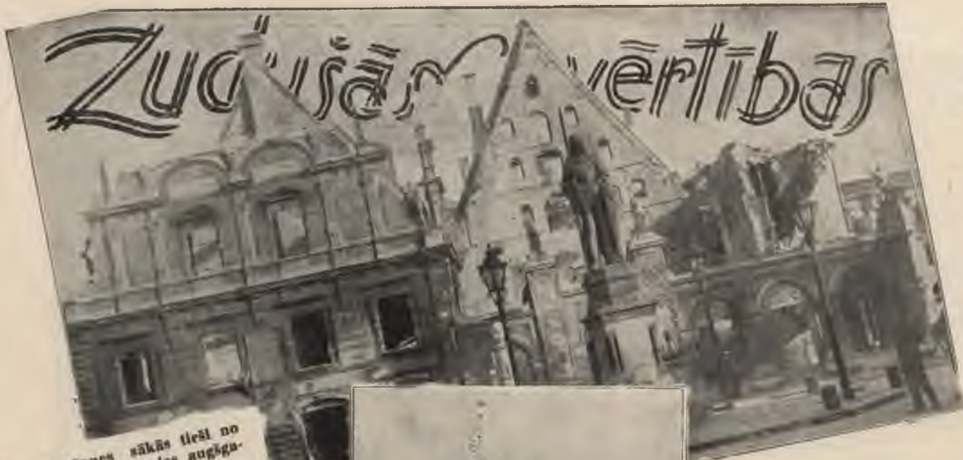
1777. g. kāpnes sākās tīstīt no tirgus laukuma; uzejas augšgalā noslēdza akmens portāls.