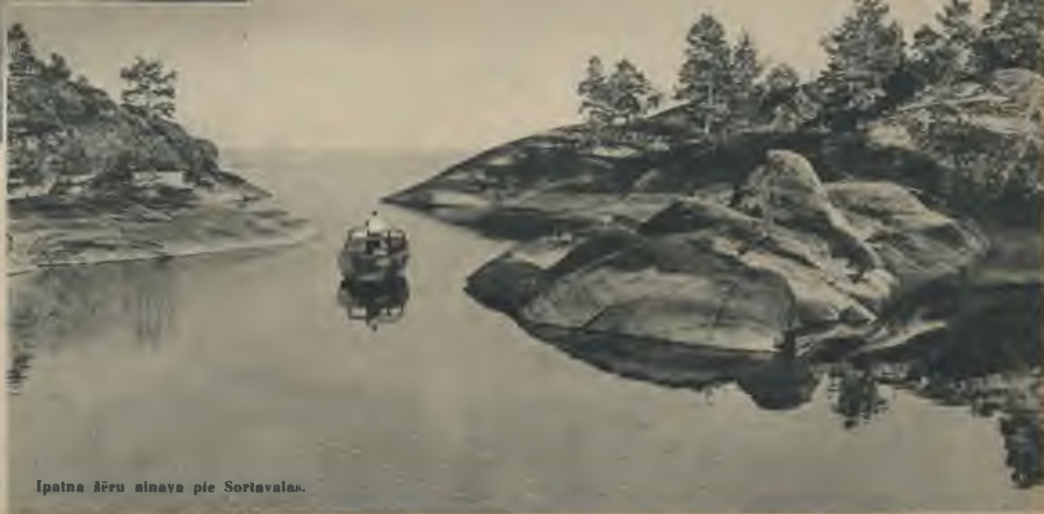
Īpatna āžu ainava pie Sortavalas.

ILLUSTRETS NEDEĻAS ŽURNĀLS „LAIKMETS”. Atb. izdevējs ARTURS FREIMANIS. Atb. redaktors EDUARDS TŪBELIS. Atb. redaktora vietnieks ALBERTS PRANDE. Žurnāla „Laikmets” redakcija un apgāds Rīgā, Kaļķu ielā 25. Numurs maksā 30 Rpf. Abonēšanas maksa par 3 mēn. ar piesūtīšanu — RM 3,50. Abonementu pieņem visās pasta iestādēs. Nākamais numurs iznāks 16. janvārī. Tālruni: Atbildīgais redaktors 22588, redakcija 22614.