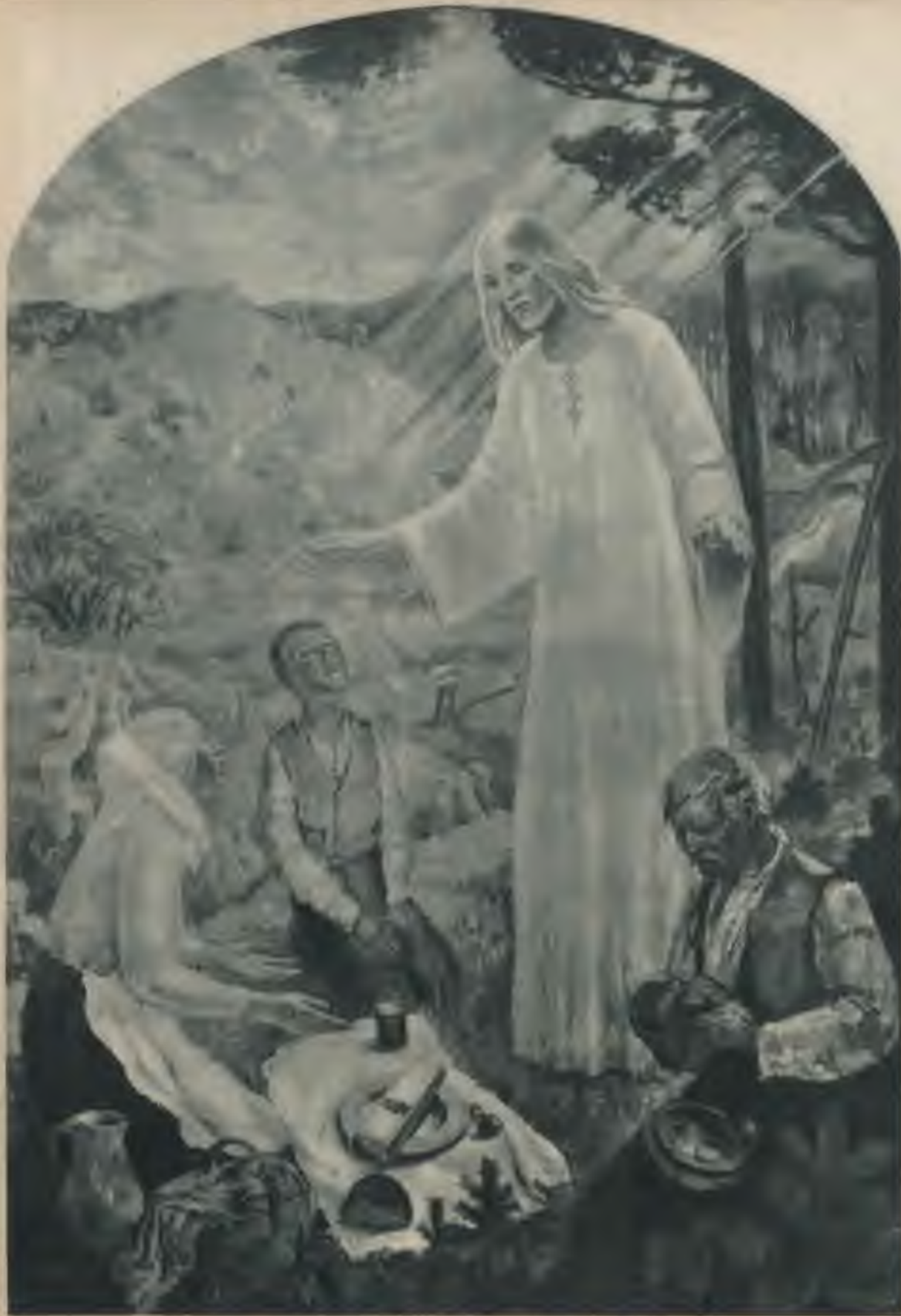
Augusts Annuss — Kristus svēti darba laudis, Tērvetes baznīcas altāra glezna.