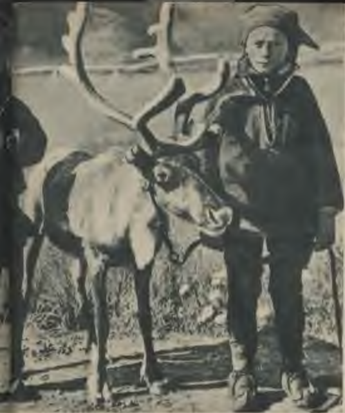
Sīksto lapu zemes dēlu Helakā bagātība ir ziemeļbriedis.