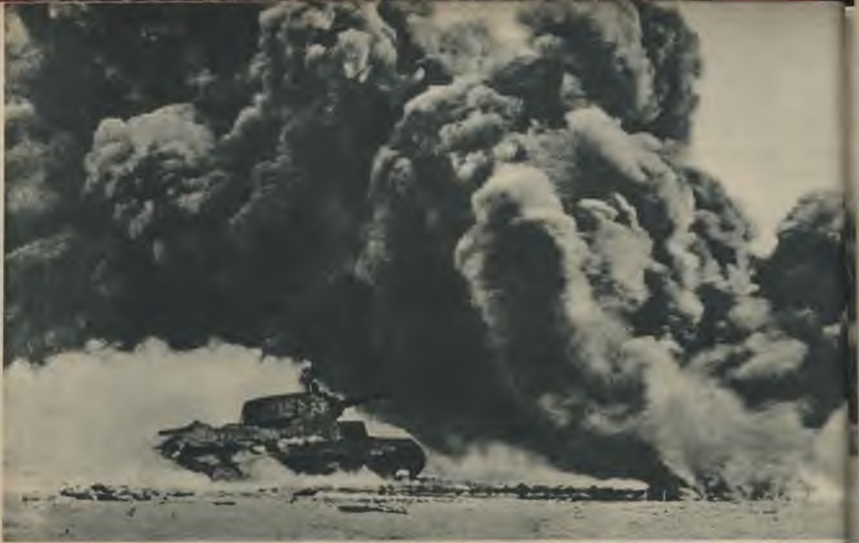
Viens pēc otra tiek iznīcināti boļševiku tanki. Tikai dūmu mutuļi norāda trāpījumu vietu.