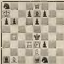
Mats 2 gājienos.

(Publicēts 1935. g. 8. V „Bottroper Volkszeitung“)