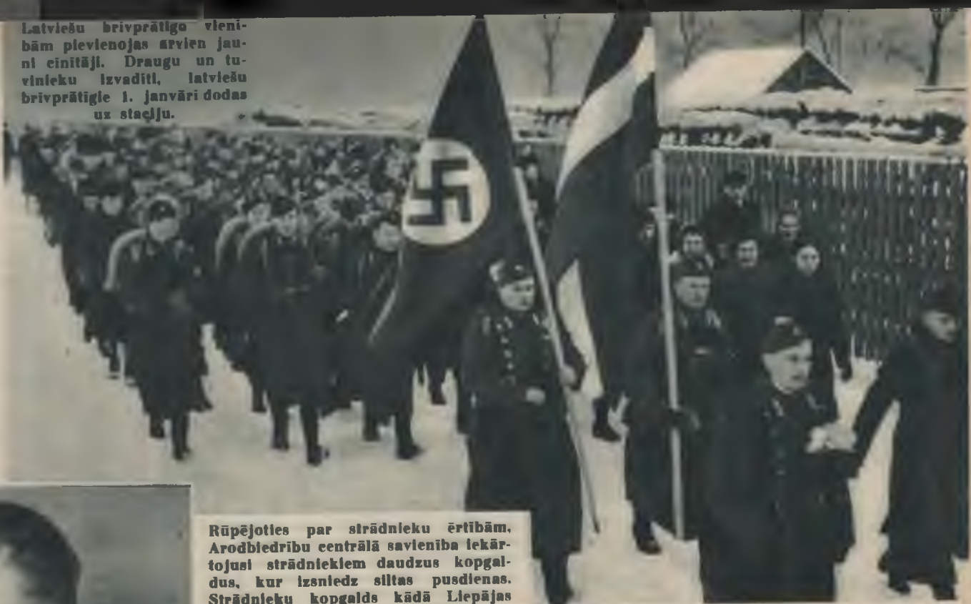
Rūpējoties par strādnieku ērtībām. Arodbiedrību centrālā savienība iekārtojusi strādniekiem daudzus koptalpus, kur izsniedz siltas pusdienas. Strādnieku koptalpus kādā Liepājas kokapstrādāšanas fabrikā.

Latviešu brīvprātīgo vienībām pievienojas arvien jauni ciniņāji. Draugu un tuvinieku izvadīti, latviešu brīvprātīgie 1. janvāri dodas uz stačļu.