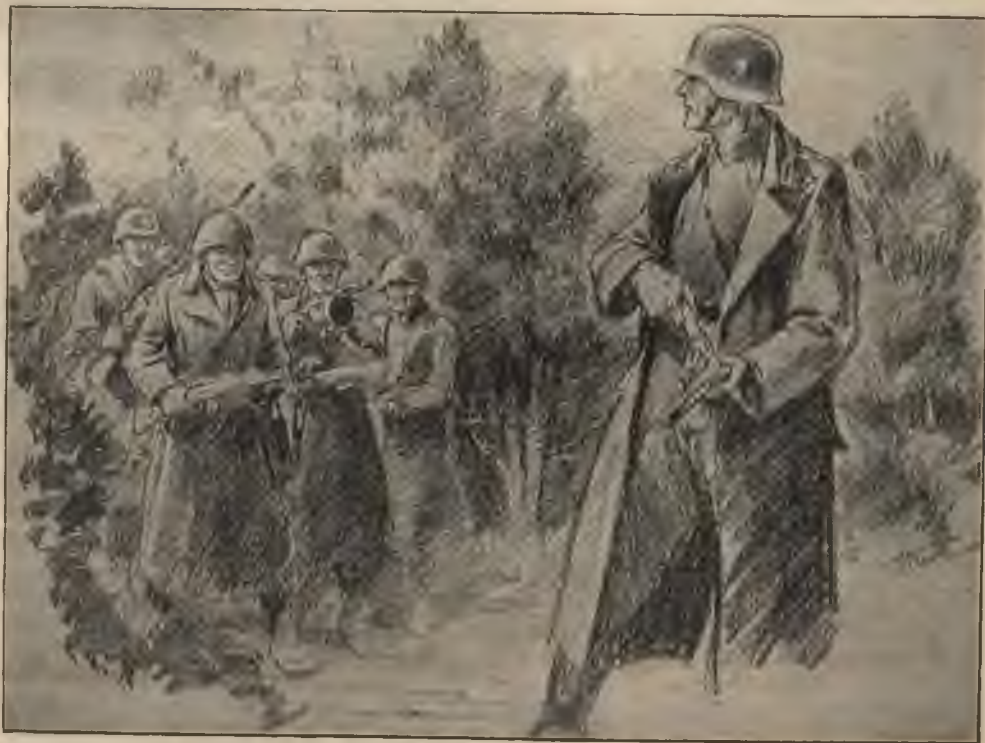
Viņš lēni, it kā apmācības stunda demonstrēdams, izņem aptveri no savas pistoles.

Divainas lietas notiek Pēterpilī! Tiešām, 7. novembrī vajadzējis notikt lielam izlaušanās mēģinājumam. Apbruņoti daudzu (Turpinājums 24. lapp.)