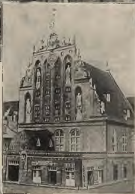
1855. g. kāpnes nojauktas un ieeju sēdza jumts. 1816. g. nams paplašināts ar šauru piebūvi Mazās Grēcinieku ielas pusē.