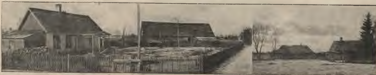
Mārtiņa Puriņa saimniecība