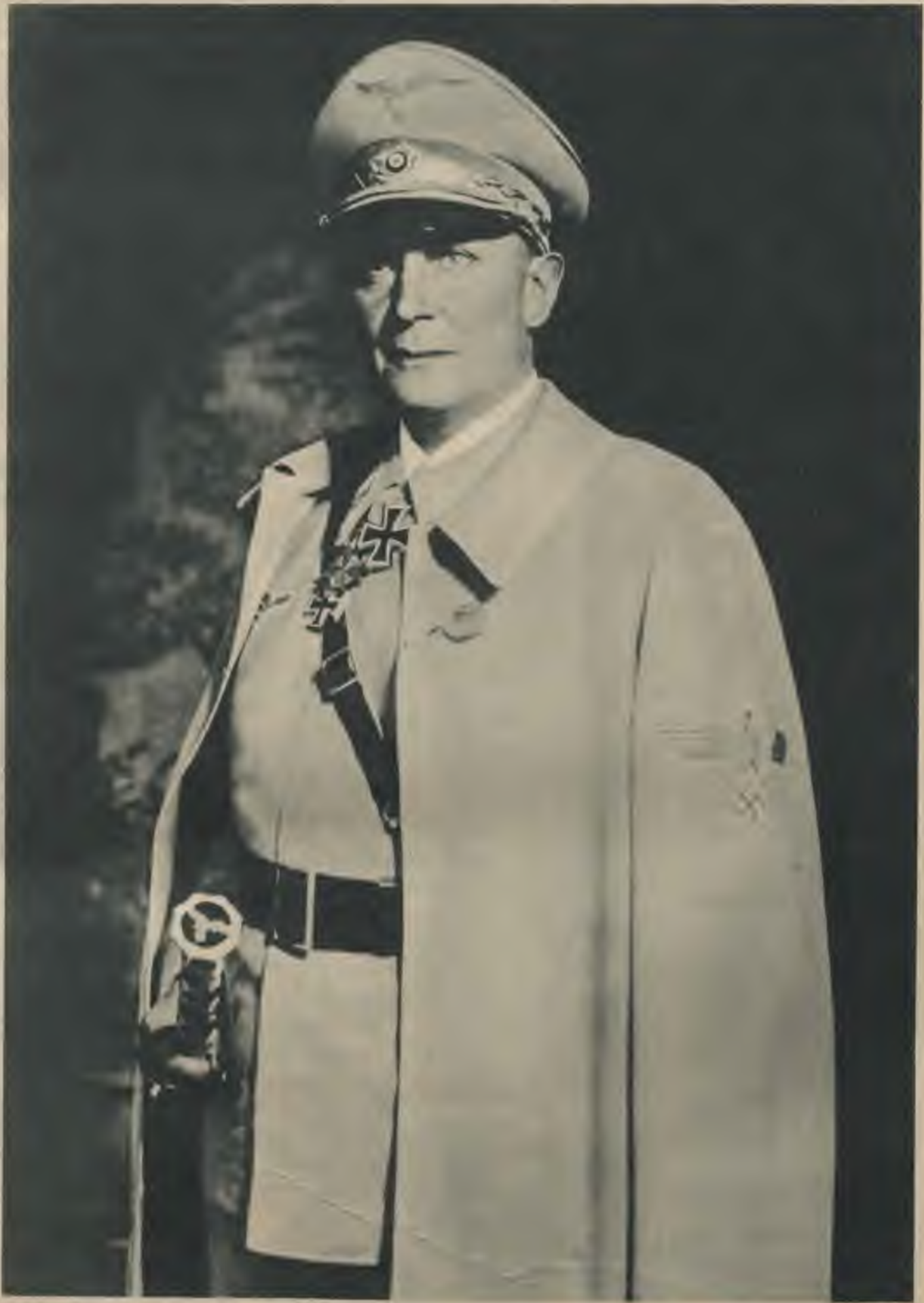
Valsts maršals Hermanns Goerings