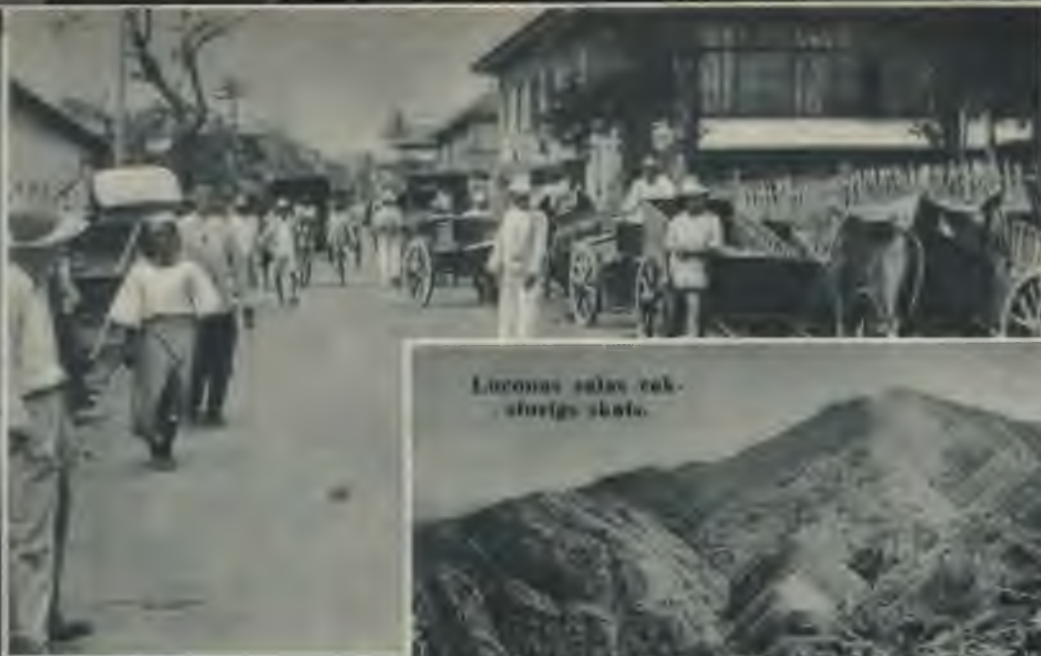
Luceonas salas vak- stūrīgs skats.