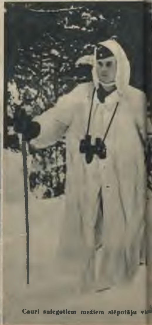
Cauri sniegotiem mežiem slēpotāju vācu