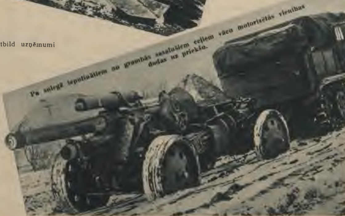
Pa sniegtā lepuļājiem no pļonbās sastrādājam ceļiem vācu motorizētās vienības dodas uz priekšu.