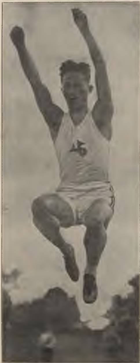
Pasaules rekordista Naondo Tajimas lēciena dinamika.