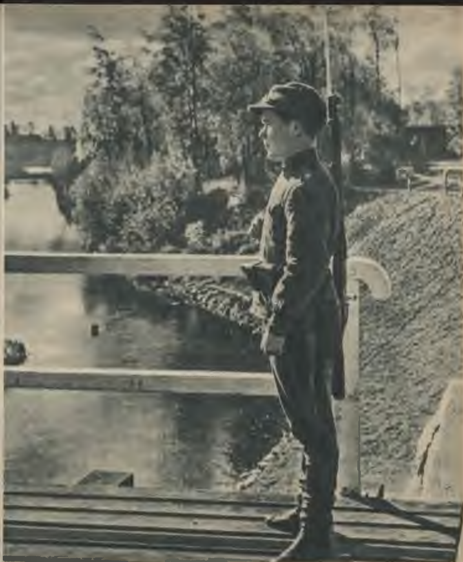
Posteni par dzimteni.