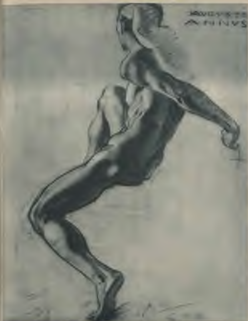
Augusts Annuss — Zīmējums.