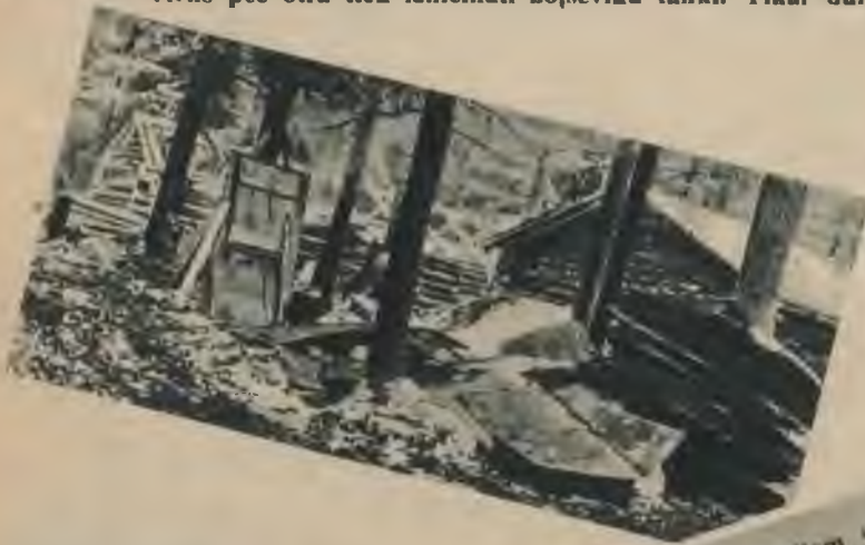
Vācu karavīri gādā sev siltu pajumti. No apakšiem bakšiem tiek uzceltas nelielas koku mājiņas, kas arī 35 grādu salā dod siltu patvērumu.