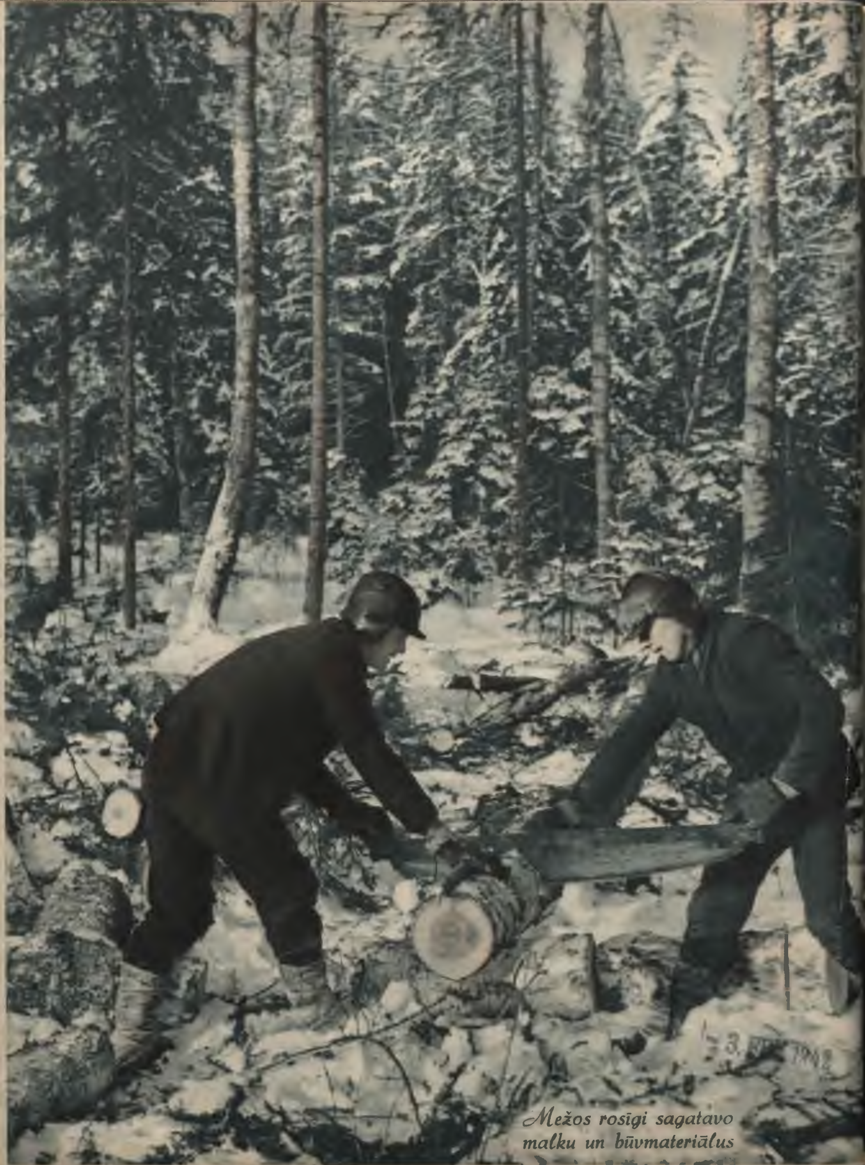
Mežos rosīgi sagatavo malku un būvmateriālus