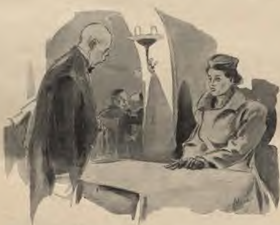
Jaunava droši apsēdās pie smagā ozola galda nomaļā vietā un pasūtīja vīnu.

Otrā dienā Ziemas biedrībā viņai bija jāatbild par vīna glāzēm goda tiesai. Kāds no jaunākajiem sportistiem bija pasteidzies iesniegt priekšniekam rakstisku sūdzību par biedrības noteikumu pārkāpšanu un meistas goda aptraipīšanu. Lieta vairs nebija jauka. Daļa sportistu pieprasīja Baibas izslēgšanu. Bet ziemas vidū bija Šveicē noliktas Eiropas meistarsacīkstes, uz kurām Sniega Roze gatavojās... Šogad viņai bija jāuzvar. Viņa bija norūdīta kā tērauda atspere, vēl tikai vajadzēja padeldēt slēpes sniegā. Ziemas biedrības vīriem nebija viegli. Viņi zināja, ko ar Baibu zaudē. Tādas slēpotājas vairs otras nebija visā val-