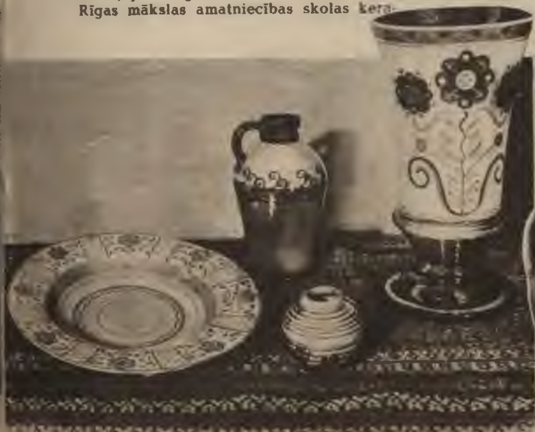
Rīgas mākslas amatniecības skolas darbi.