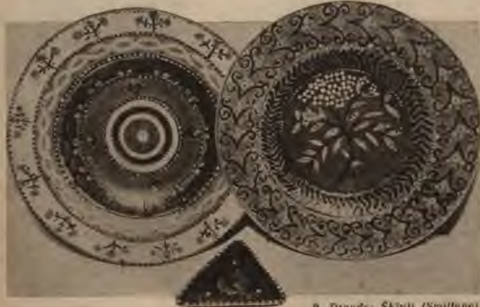
P. Drande: Šķivis (Smiltene).