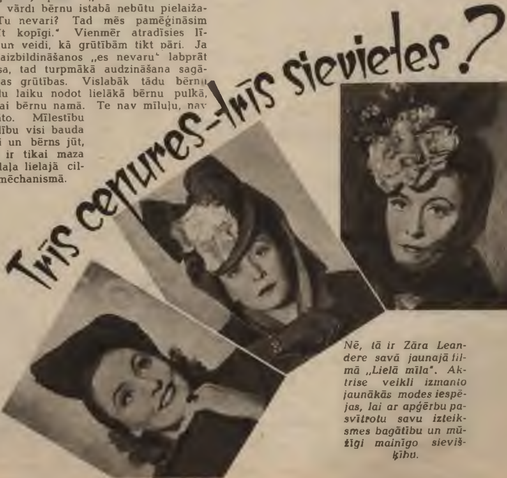
Nē, tā ir Zāra Leandere savā jaunajā filmā „Lielā mīla”. Aktiise veikli izmanto jaunākās modes iespējas, lai ar apģērbu pasvītrotu savu izteiksmes bagātību un mūžīgi mainīgo sievietes ķihu.

Šis piemērs rāda, ka bērnus stipri ietekmē sugestīvs spēks. „To es nevaru” — šie trīs vārdi bērnu istabā nebūtu pielaižami. „Tu nevari? Tad mēs pamēģināsim to darīt kopīgi.” Vienmēr atradīsies līdzekļi un veidi, kā grūtībām tikt pāri. Ja bērna aizbildināšanos „es nevaru” labprāt uzklausa, tad turpmākā audzināšana sagādā lielas grūtības. Vislabāk tādu bērnu uz kādu laiku nodot lielākā bērnu pulkā, kaut vai bērnu namā. Te nav milužu, nav izlutināto. Mīlestību un gādību visi bauda vienādi un bērns jūt, ka tas ir tikai maza sastāvdaļa lielajā cilvēces mehānismā.