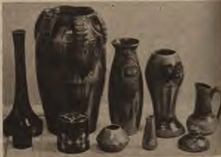
P. Steinbergs: Vāzes (Rīga).