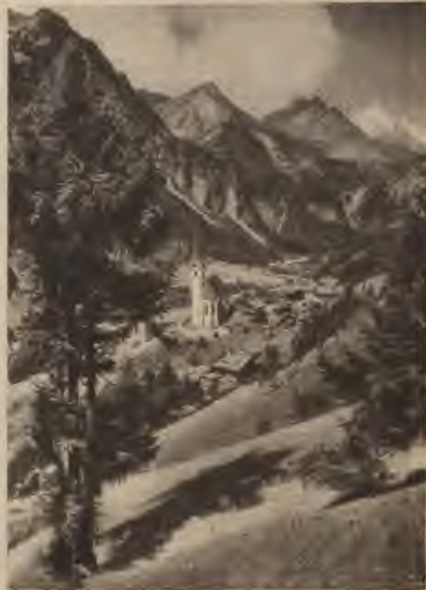
Heiligenbluta — raksturīga ainava krāšņajā Kārnēnas novadā.

Runājot par Ostmarku, visbiežāk iedomājas Vīni, ar tās omulīgo tautas mūziku un dziesmām, kas sadzejotas par jauno vīnu un arī pie šī vīna glāzes dziedamas; iedomājas Vīnes opereti, kuņas klasiskie pārstāvji ir Johāns Strauss, Franzijs von Suppé, Karlis Millöckers un Franzijs Lehar's, — viņu melodijas no „Sikspārņa”, „Jautrās atraitnes”, „Vieglās kavalerijas” un „Čigānu barona” pazīst visa pasaule. Vīnes Burgteātris no Josefa Kainza līdz Paula'i Wessely redzējis uz savas skatuves neskaitāmus slavenus māksliniekus. Tādiem vārdiem kā: Haydn's, Mozart's, Schubert's un Beethoven's, kas Kālenbergā