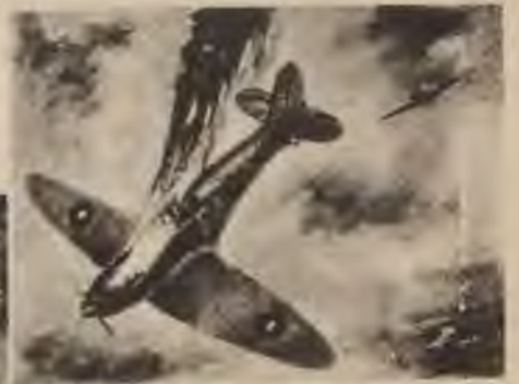
Sašautā ienaidnieka lidmašīna degdama krīt — tā neapstrīdami uzskatāma par iznīcinātu.

Ši lidmašīna nav pieskaitāma iznīcinātām, jo Vikersa „Wellingtonam” ir 5—6 vīru apkalpe, bet ar izpletņiem izlēkuši tikai 4 vīri. Šādos gadījumos nosakot lidmašīnu iznīcināšanu, skaidri jāzin tās tips un apkalpes lielums.