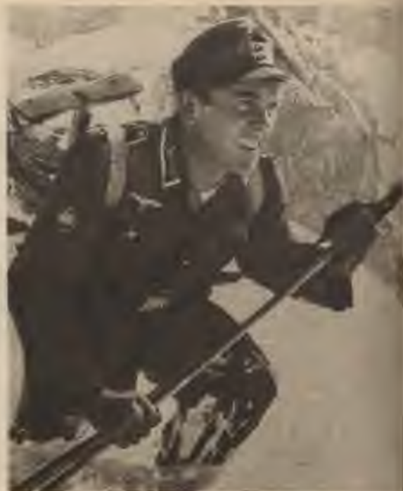
Ostmarkas kalnu strēlnieks, savu pienākumu pret dzimteni pildīdams, pārvar kalnu pārejas grūtības.

Ostmarkas dēli vienmēr pierādījuši šo mīlestību pret vācu dzimteni. Lai tie būtu tirolieši, kas gāja savā varoņīgajā atbrīvošanas cīņā pret Napoleonu, vai tie bija nacionālsociālisti, kas par savu vācietību kļuva Vadoņa ideju asinsliecinieki, lai tie būtu tagadējie kaŗavīri, viņi visās frontēs, kur cīnās vācu ieroči, nepagurdami pilda savu pienākumu. Pazīstama ir Ostmarkas kalnu strēlnieku varoņdziesma cīņā par Norveģi-