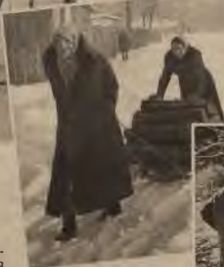
Kad pilsētā pietrūkst pajūgu malkas pārvešanai, tad rīdžnieces prlecīgas par katru klēpi malkas, ko uz raģaviņām var pārvest no malkas laukuma.