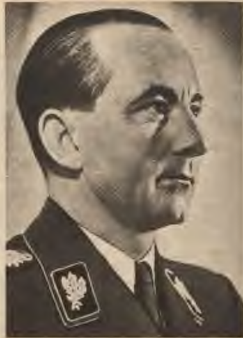
Lielvācijas preses vadītājs reichsleiters Dr. Otto Dietrich s.

Nacionālsociālistisko presi izveidojuŗi žurnālisti, kam nacionālsociālisms nebija tikai vārds, bet dziļākā pārliecība. Jaunās Vācijas preses darbiniekiem bija uzticēts atbildības un goda pilnais uzdevums visplaŗākām tautas aprindām izskaidrot nacionālsociālistisko pasaules uzskatu. Ilgus gadus vācu laikrakstu slejas bija pildījūŗi žīdu