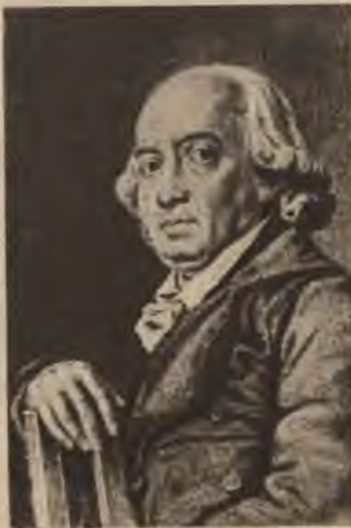
Johann's Gottfried's Herder's. Pēc F. Bury krīta zīmējuma 1790-tos gados.

svešniekam, tā nodota augstākam mērķim: izglītībai. Herder's atceras arī Kurzemi, un šim „morālam un literāriskam tuksnesim” jāklūst par „brīvības un zinātņu noņemtni”. Viņš labvēlīgi domā ietekmēt dižciltīgos un jūsmo par ķeizarieni Katrīnu,