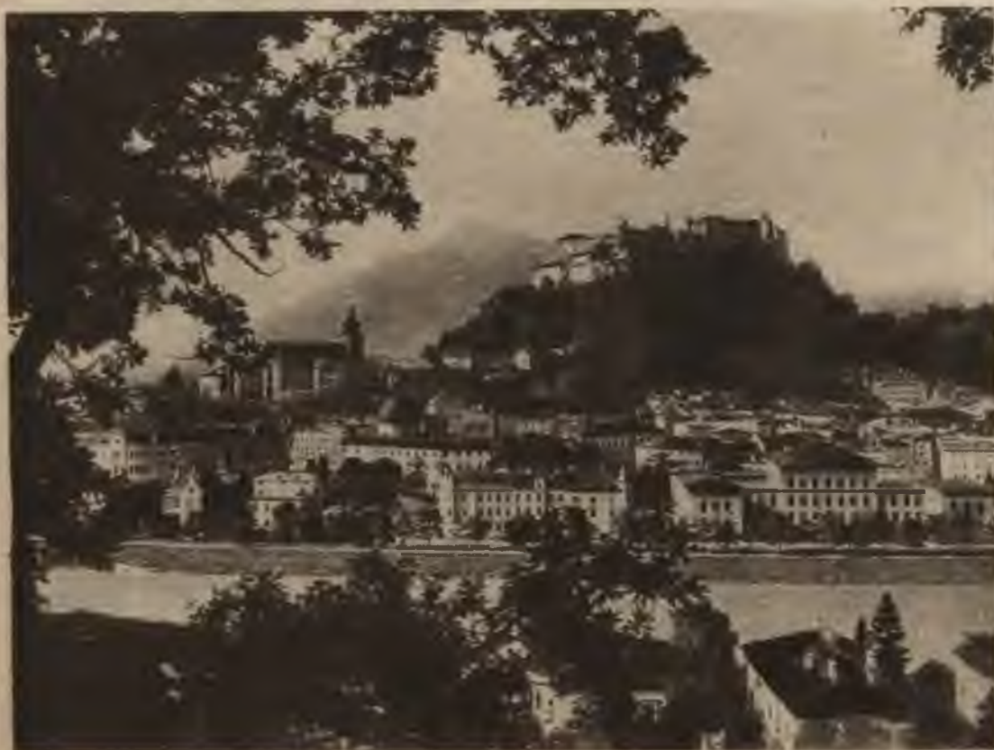
Zalcburga, — šī ainava dod ieskatu par Ostmarkas dabas krāšņumiem.