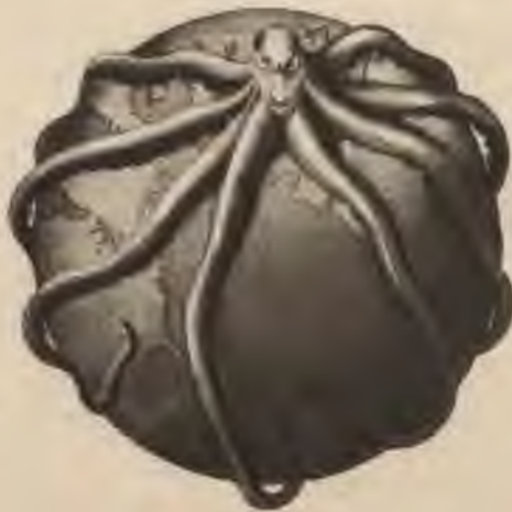
„Melnā Veža” karogneši.

17. gadsimta sākumā Rīga kļuva Zviedrijas galvenā tirdzniecības pilsēta, ar apm. 35% Zviedrijas ārējās tirdzniecības apgrozības. Ziemeļu karš, Rīgas un Vidzemes pievienošana Krievijai noslēdza 400 gadu garo periodu vietējās tirgotāju šķiras tapšanai organizētā lieltirdzniecībā.