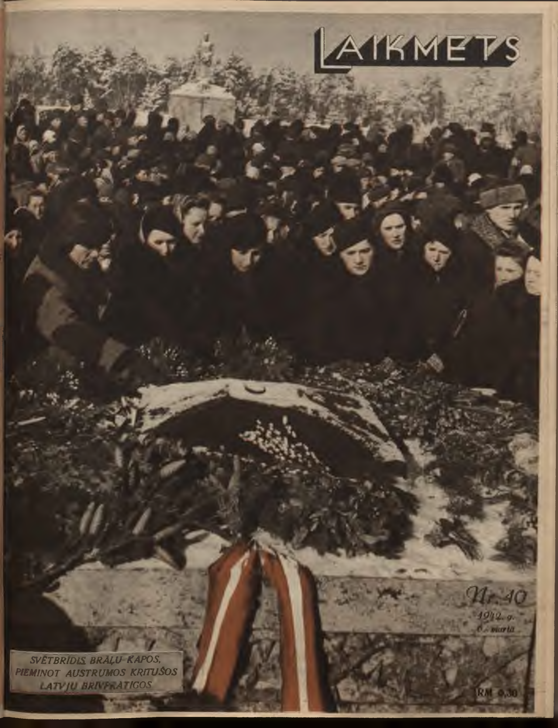
SVĒTBRĪDĪS BRĀĻU KAPOS, PIEMINOT AUSTRUMOS KRITUŠOS LATVJU BRĪVPRATĪGOS