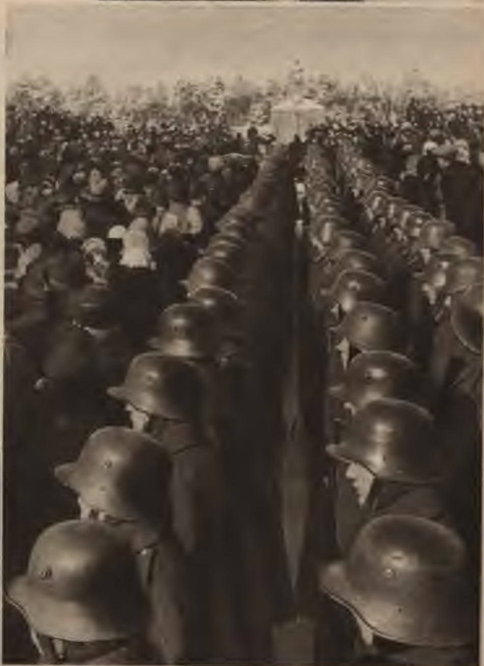
Brāļu kapos noliek vainagu, godinot varoņus, kas krituši, aizstāvoķ latvju zemi pret boļševiku ordām.