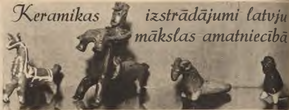
Svilpītes, no kreisās: 1—2 — Latgales; 3—4 — Kurzemes.

smas, lai norēgulētu trauka sienu vienmērīgu biezumu, tā iegūstot ritmiski veidotu primitīvu rotājumu. Vēlāka, mūsu zemes vēsturiskā laikmeta materiāli atklāj jau podnieka virpas veidotus traukus, gan ar ķemmes veida iešvīkotu, gan virves nospieduma raksta rotājumu.