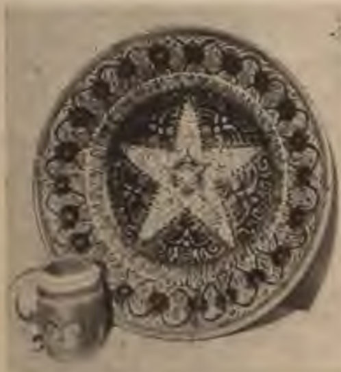
A. Cīruļis: Kausiņš un šķivis.

saglabājuši savas tradīcijas kā formā, tā rotājumā, kas savukārt balstās uz arhaiskās latvju podniecības pirmformām. At-