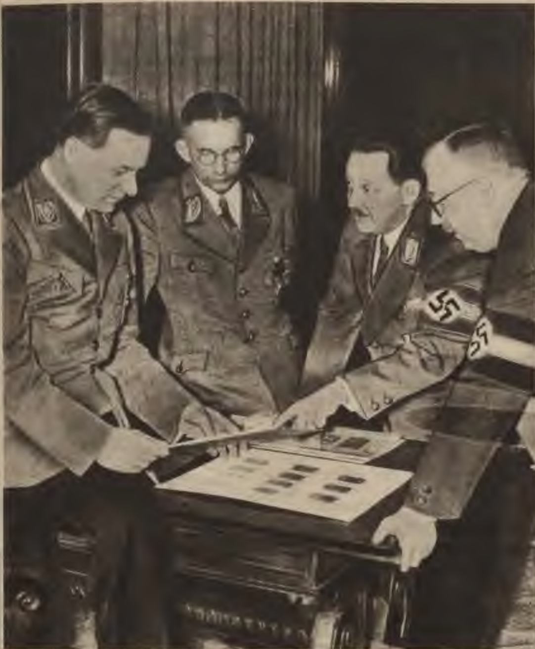
Reichsministra Alfred'a Rosenberg'a tiešā vadībā ministrija ieņemtiem austrumu apgabaliem kārtu saimniecisko un kultūrālo dzīvi no boļševisma atbrīvotās zemēs. — Reichsministrs Rosenberg's apspriežas ar savu vietnieku Dr. Meyer'u, Ukrainas valstskomisāru Koch'u un Austrumu apgabala valstskomisāru Loħse.