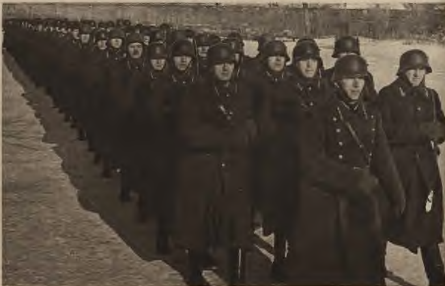
Viņiem pienākas mūsu gādība un rūpes.