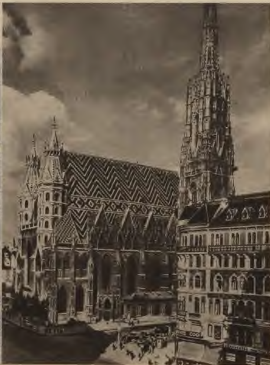
Sv. Stefana katedrāle ir viena no ievērības cienīgākajām celtnēm divu miljonu pilsētā Vīnē.

pie Vīnes komponējis savus nemirstīgos darbus, nav vajadzīgi nekādi paskaidrojumi.