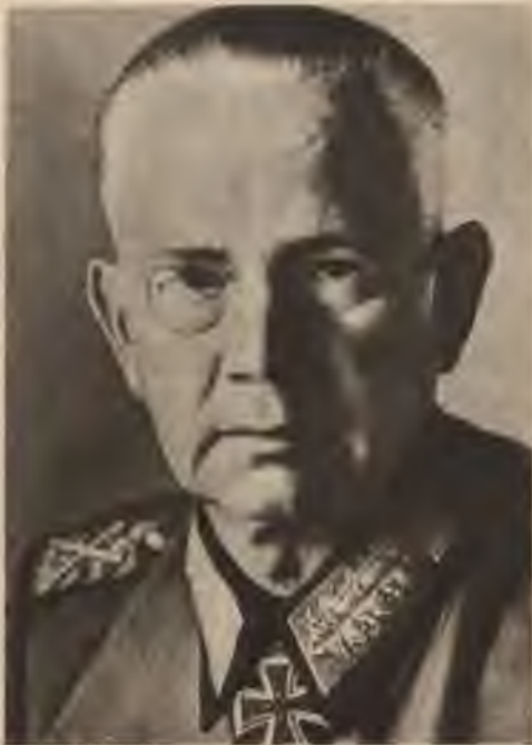
Generalfeldmarsāls von Reichenau's

Sportista gaitās attīstītās augstvērtīgās garīgās īpašības un fiziskās spējas attaisno fiziskās audzināšanas un sporta nodarbēs ziedoto laiku dzīvē ik uz soļa. Vēl jo vairāk tās noder cīņās pret ienaidnieku. Spēcīgs, izturīgs, izveicīgs, siksts, neatlaidīgs, apķērīgs un drošsirdīgs sportists labāk kā kuņš cits var būt arī priekšzīmīgs kaņāvīrs. Sportiskais gars, kas pamudina uzvarēt pretinieku draudzīgās cīņās sporta laukā, vēl jo vairāk skubina katru sportistu — savas tautas dedzīgu dēlu, aizstāvēt savas tēvijas godu kaujas laukā, kad dzīves