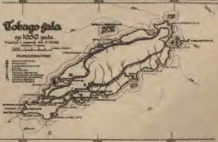
Tobago sala, kuŗu hercogistei nolauģija angļi, paliekot parada kurzemniekiem miljardu vērtības.

Letras de Hercego... 1710 Le 10 Mars 1710