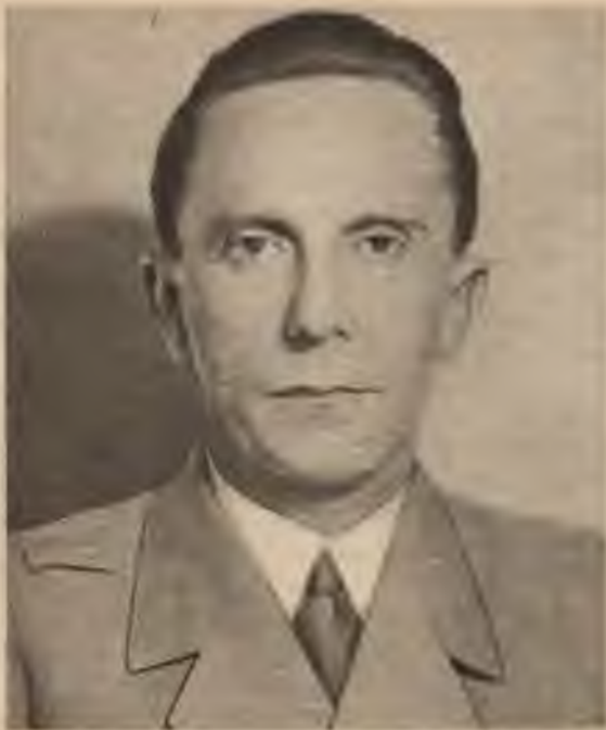
Reichsministrs Dr. Josef's Goebbels, kuŗu tieŗā vadībā veidojusies nacionālsociālistiskā prese.