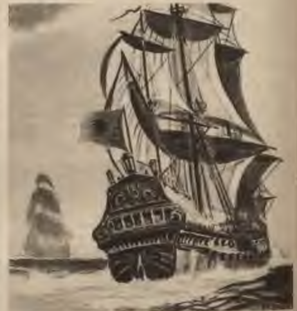
Kurzemnieku būvētie kuģi ceļā uz savu koloniju — Tobago salu.

Tobago, tāpat arī Gambijas, koloniju pārvaldīšanā kurzemnieki pierādījuši uzņēmību un organizatoriskas spējas, saistot kolonijas ar dzimto zemi visos saimnieciskos un kultūrālos virzienos. Angļiem, holandiešiem un frančiem par pārsteigumu, kurzemnieki ātri sāka izmantot kolonijas lielākas zemes bagātības nekā tās bija domātas kolonijas nododot hercogam. Turklāt vēl kurzemnieku humānā apiešanās ar iedzimtajiem angļiem nepatika, jo angļu koloniālā politika bija pilnīgi pretēja un balstījās uz iedzimto izmantošanu, kā to redzam vēl tagad. Tādēļ hercogam bija jāzaudē kolonijas, bet angļiem goda vārds ar hercogu parakstītā 1664. g. 17. novembra līgumā. Atstāsīm pašiem angļiem aplēst fantastiskās summas, kuras tie palikuši parādā latviešu tirdzniecības ciltskokam no 1664. g.