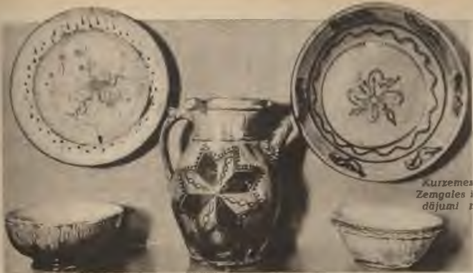
Kurzemes un Zemgales izstrādājumi mālā.

nevišķi podniecības centri saskatāmi Cēsīs, Tukumā, Talsos, Liepājā, Rucavā u. c.