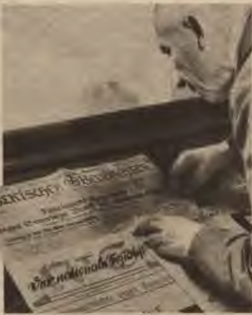
Adoll'a Hitler'a uzmetums nacionālsociālistiskās kustības laikraksta „Völkischer Beobachter" galvas zīmējumam.

Atvietojojot nespējīgos veco uzskatu žurnālistus ar jauniem spēkiem, kas auguŗi līdzī nacionālsociālismam, Vācijas prese īsā laikā pārvarēja nedroŗību un vienmuŗi-