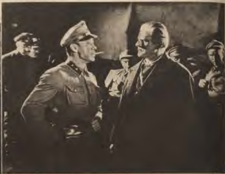
„Ciems sarkano liesmās”. — Pirmizrāde „Splendid - Palacē”