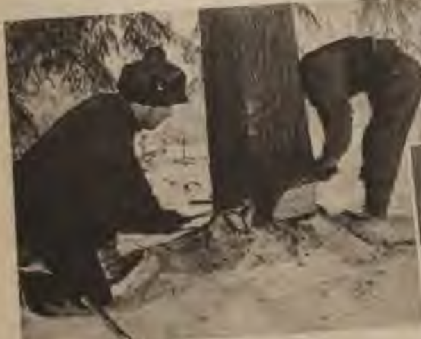
Pat lielākā sala dienās meža darbos strādā desmitiem tūkstošu lauku cilvēku, gatavojot materiālus būvniecībai un rūpniecībai, kurināmo sev un pilsētām.