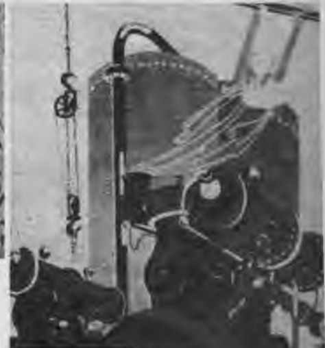
Lūk, cik naivi un bezgarīgi demonstrē pret-statu starp ti-cību un techni-ku, lai vientie-sīgie laudis re-dzētu garu, kas bēg no mašīnām.

Lai postītu ģimenes dzīvi, bezdievju pro-paganda izlaiž sievietēm uzsaukumu atstāt mājas. Kā viņu ideālu nostāda kopgaldū, kopīgu mazgātavu un bērnu patversmi. Uz-turēt ģimenes dzīvi un mājas nozīmē tum-