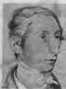
Carl Maria Weber's.