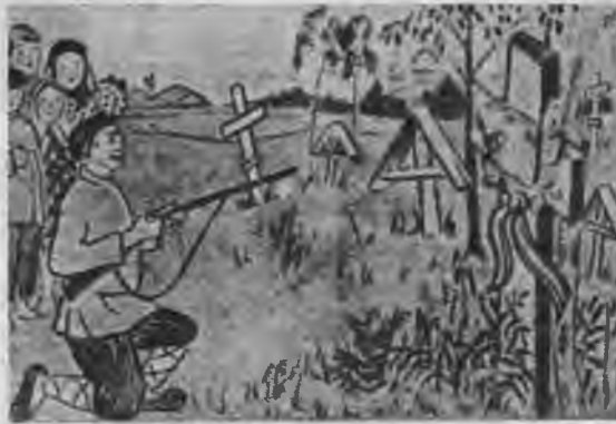
Karikatūra rāda ģeķīgu boļševiku lielīša-nos — šaut uz svētbildēm un krustiem.

1930. gadā parādījās bezdievju izdevnie-cībā grāmata ar virsrakstu: Antireliģiskā audzināšana ģimenē. Tanī uzsvērts, ka re-liģijas iespāids visvairāk vērojams agrā bērnībā, tādēļ mātei — komunistei, cik vien