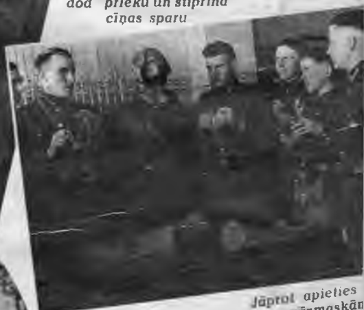
Jāprot apieties gāzmaskānā

Austrumos tagad jāizcīna pēdējā cīņa, kas izšķirs mūsu nākotni uz gadsimtiem. To izcīna par būt vai nebūt, par ģimeni, īpašumu, zemi, kultūru un dzīvību. To izcīna par Eiropas tautu nākotni vispār. Tiem, kam ir tiesības strādāt dzimtenē un kam ir pienākums plašajos austrumos kalpot zem ieročiem, tagad jāizšķirās. — To savā plašajā runā latviešu brīvprātīgo propagandas un organizācijas galvenās komitejas rīkotajā koncertā uzsvēra Latvijas ģenerālapgabala SS un policijas vadītājs ģenerālmajors Schröder's.