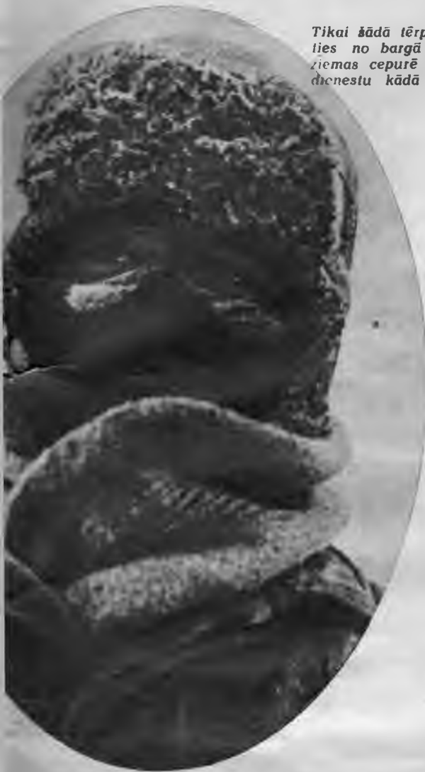
Tikai šādā tērpā iespējams pasargāties no bargā sala. Vācu kaņavīrs ziemas cepurē un sejas maskā veic dienestu kādā austrumu aerodromā.

Japāņi Javā izceļ arvien jaunus desantus un izveido spēcīgas operāciju bāzes stratēģiski svarīgākos punktos visā salas piekrastē. Bandoengas telpa Javas salas ziemeļdaļā jau atrodas pilnīgi japāņu rokās.