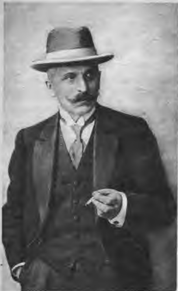
Akadēmiķis prof. Vilhelms Purvītis

Šī gada 3. martā akadēmiķis prof. Vilhelms Purvītis, lielmeistars, kā vārds pazīstams tālu pāri dzimtenes ārēm, atskatījās uz savu 70. dzimšanas dienu.