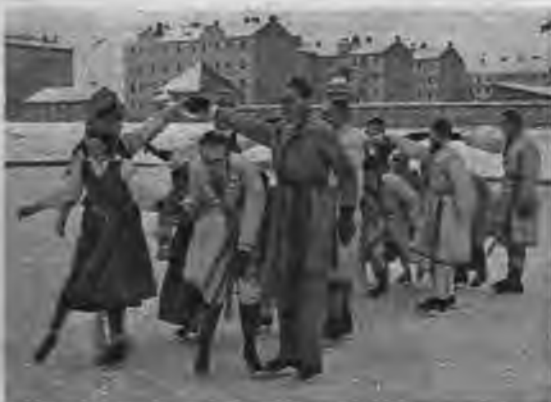
Daiļslidotāju polonēze Tautas palīdzībai par labu rīkotajos ledus svētkos.

tie ledus svētki Rīgā bija pulcējuši simtiem dalībniekiem un vairāk nekā tūkstoš skatītāju. Jaunatnei bija izdevība izmēģināt savas spējas dažādās ātruma un veiklības sacīkstēs. Lielu sajūsmu skatītājos radīja daiļslidotāji kas tautiskos tērpos slidoja polonēzi, saules deju, krusta deju u. c. E. T.