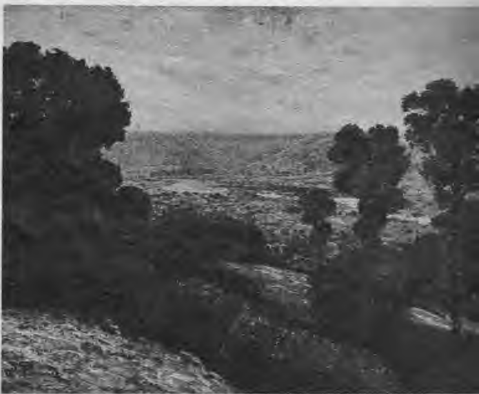
Prof. V. Purvītis: Siguldas leja