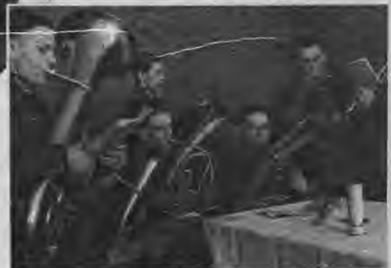
Pašu orķestris un koris sniedz patīkamu atpūtu brīvajās stundās.