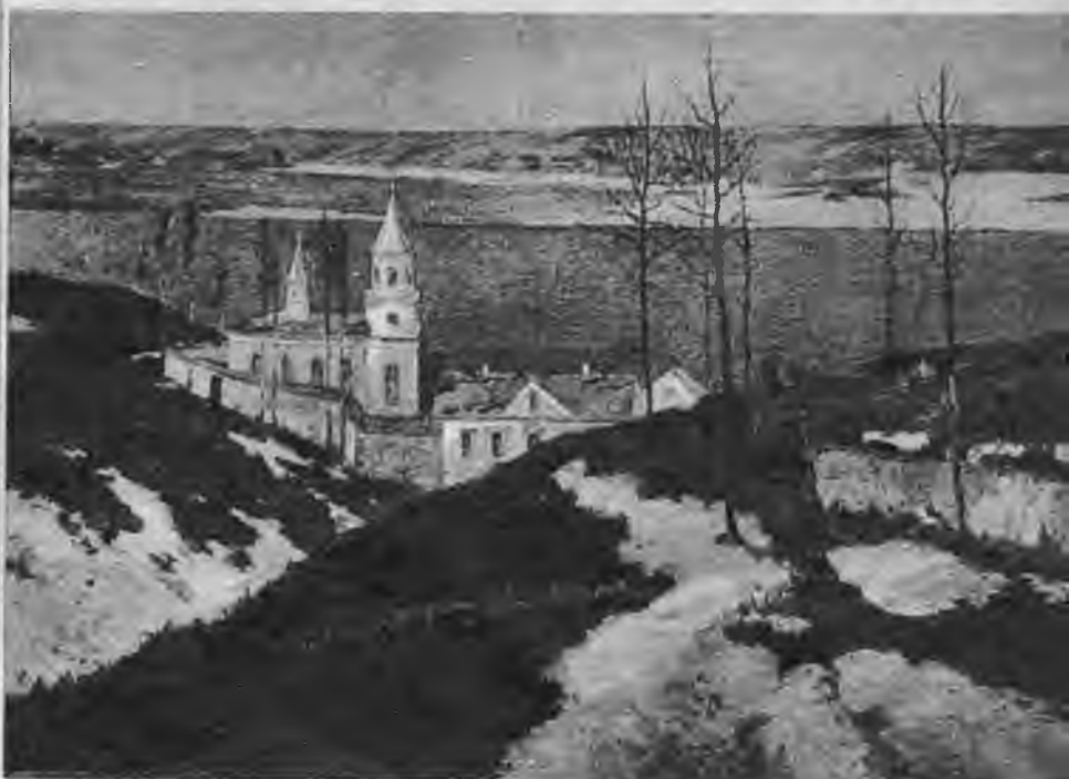
Prof. V. Purvītis: Pēdējie stari

Mūsu ievērojamākam ainavu gleznotājam šūpulis kārts Vidzemē — Zaubes pagasta Jaužu mājās. Tur gūti bērniņas saulainie iespaidi un izjūtas. Jau pusaudža vecumā P. nokļūst Vitebskas gubernā, kur tēvs uzņēmis dzirnavas. Apmeklēdams Drisas apriņķa