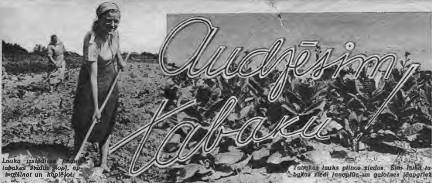
Laukā izstādītas jaunās tabakas stādus kopā, apmēģinot un koplējot.