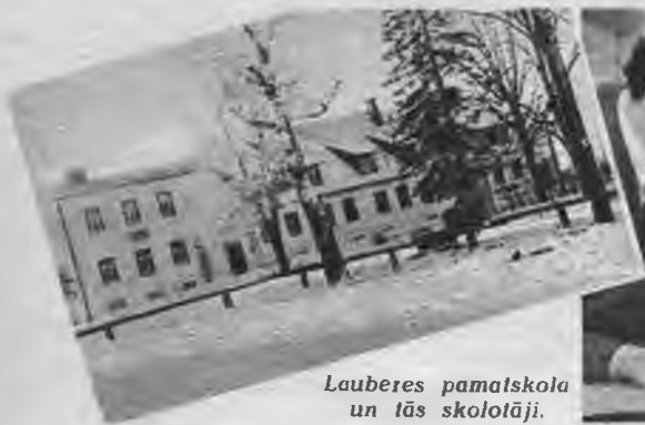
Lauberes pamatskola un tās skolotāji.

Pusdienas laikā visas domas protavs, saistās ar virtuvi un saimniecību.