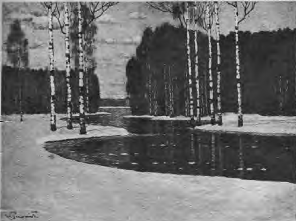
Prof. V. Purvītis: Pavasāra plūdi

vien iegūst pirmās šķiras mākslinieka gradu, bet arī Romas prēmiju, kas nodrošina studijas ārzemēs. Šo balvu latvju mākslinieks dabū skarbā sacensībā, pie tam vēl būdams sveštautietis. Apceļojis ārzemes, Purvītis apmetas uz dzīvi Rīgā. Drošā un spēcīgā impresioniskā krāsu valoda un mākslinieciskā dabas izjūta šejienes izstādēs saņēl skatītājos satraukumu. Purvītim jādzird pat asi pārmetumi. Tak ievērojamie panākumi Vakareiopā (1898. g. 2. godalga Parīzes pasaules izstādē, 1901. g. zelta medaļa Mūnchenē, 1902. g. zelta medaļa un nopelnu krusts Lionā) apklusina šausirdīgo nesaprašu balsis. Ievērojamais gleznotājs drīzi vien iegūst nedalītu atzišanu arī dzimtenē.