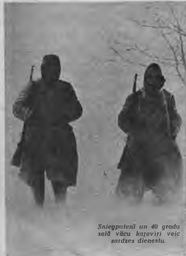
Sniegputeņi un 40 gradu salā vācu kaņavīri veic sardzes dienestu.

Visbargākā salā turpinās vācu kaņavīru darbība austrumu frontē. Vācu kaņavīri un OT vīri visu ziemu cīnījies ar sniegu un salu. Pa nakti aizputinātos aerodromus agrā rītā notīra no sniega un ar smagiem veltņiem nogludina, sagatavojot skrejmašīnu lidmašīnām.