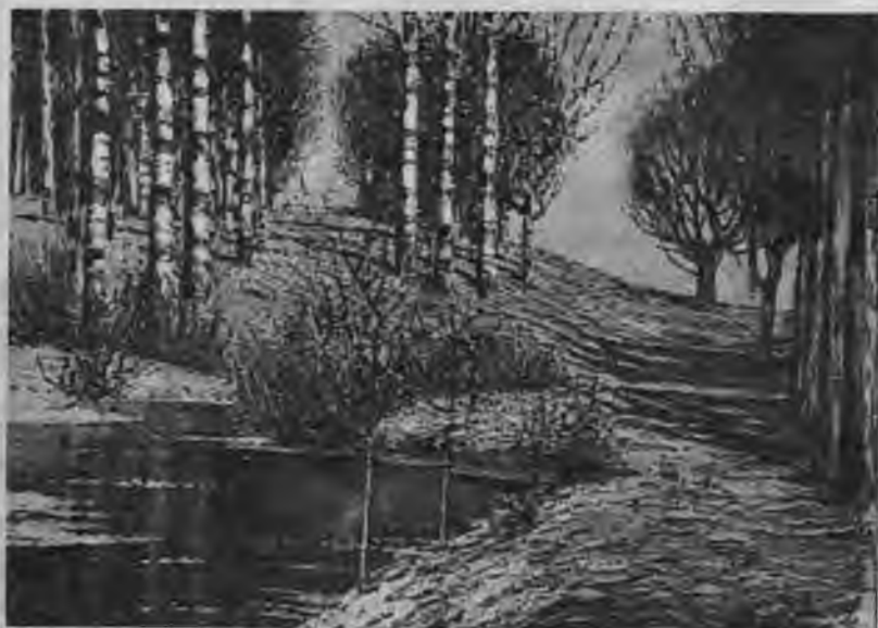
Prof. V. Purvītis: Pavasari

Talants un cītīgs darbs Kuindži darbnīcā sagādā Purvītim pelnītus laurus: 1897. g. par savu gleznu „Pēdējie stari” viņš ne-