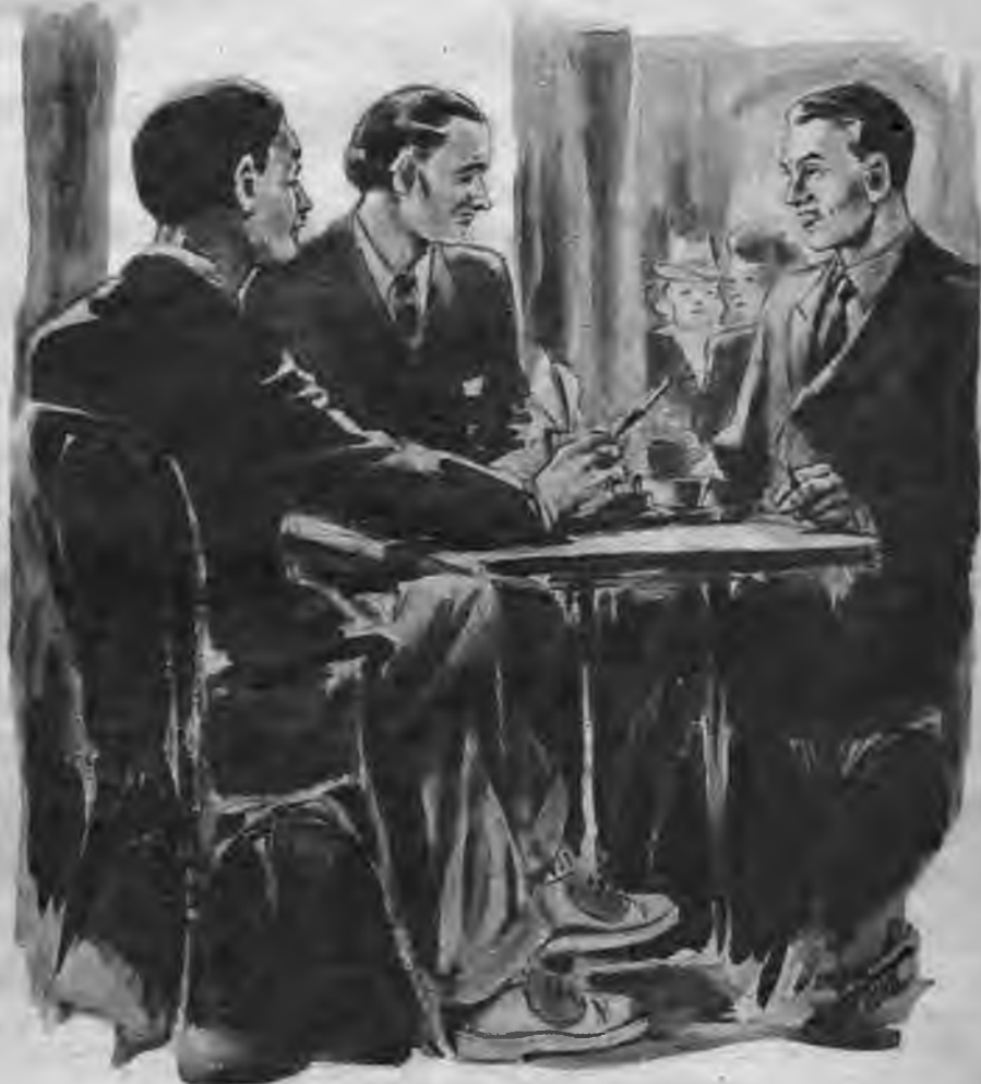
Jaunekļi cienas pilnām acīm paraudzījās Griķī.