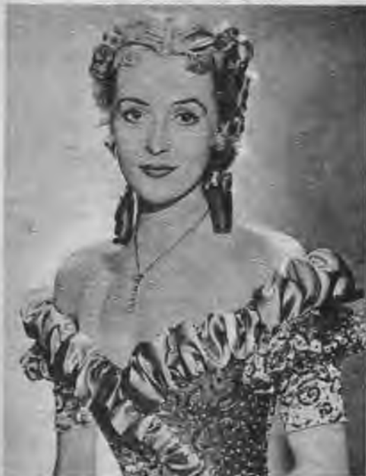
Frau Luna „Splendid Palace“