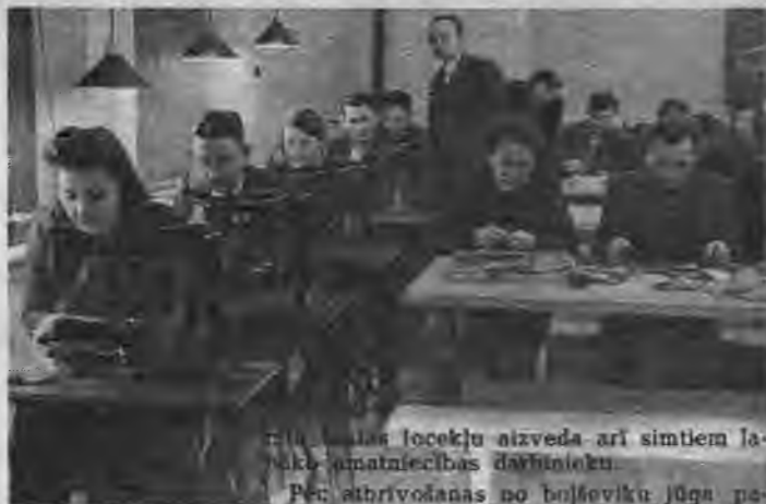
Latviešu meistaritājs locēkļu atzveida arī simtiem tālāko amatniecības darbinieku.

Latviešu amatnieku tradīcijas ir senas un dziļas; tās saglabājušās cauri gadsimtiem pat visnelabvēlīgākajos apstākļos. Kad pagājušā gadsimta vidū Krievijas valdība izdeva likumu par amatniecības brīvību, atļaujot ar amatu nodarboties katram, neatkarīgi no viņa prasmes, amatniecība būtu apstākus nemākulībā. Tikai pašu amatnieku organizācijas: Rīgas amatu meistarību brālība „Sv. Jāņa gilde”, dažas provinces pilsētu gildes, Latvijas rūpnieku un amatnieku savienība u. c. rūpīgi sekoja mācekļu un zeļļu apmācībām un savu biedru amata prasmei. Sava stāvokļa aizsardzībai un uzlabošanai amatnieki, izmantojot vācu amatnieku pieredzi, sāka dibināt kooperatīvus.