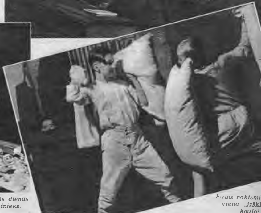
Pirms naktsmīna viena „izšķīnī” kauja!