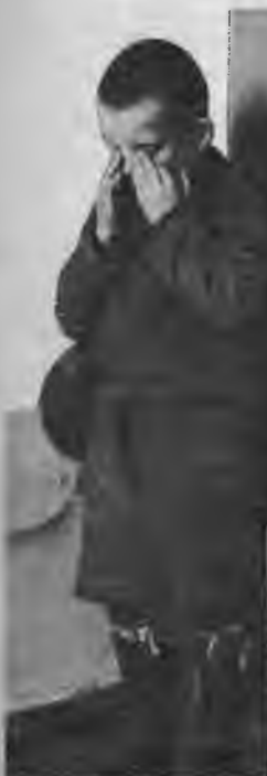
Skolas disciplīnas pār-kāpējs saņem sodu — viņam jūstāv kaklā.