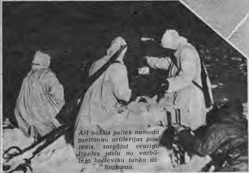
Arī naktīs paliek nomodā prettanku artilērijas postenis, sargājot svarīgu frontes joslu no varbūtējām boļševiku tanku uzbrukuma.

Visbargākā salā turpinās vācu kaņavīru darbība austrumu frontē. Vācu kaņavīri un OT vīri visu ziemu cīnījies ar sniegu un salu. Pa nakti aizputinātos aerodromus agrā rītā notīra no sniega un ar smagiem veltņiem nogludina, sagatavojot skrejmašīnu lidmašīnām.