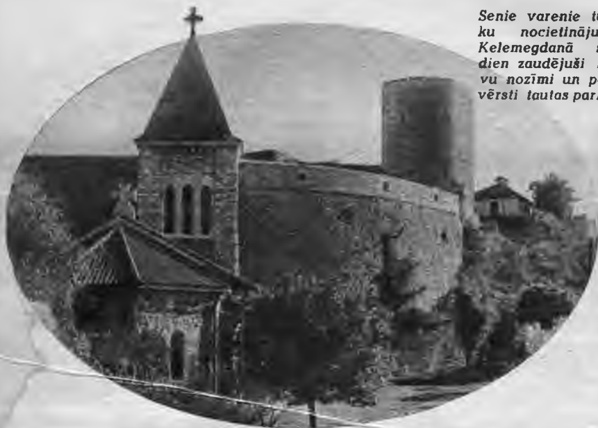
Senie varenie turku nocietinājumi Kelemegdanā šodien zaudējuši savu nozīmi un pārvērsti tautas parkā.