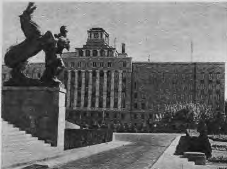
Belgrades galvenā iela ar skatu uz Albānijas pili.

kus pēdējām Vīnes modēm redz galēju nabadzību, blakus debesskrāpjiem, kādi varētu atrasties arī Čikagā, netīras būdas, kuŗās skatoties apmeklētājam šermuļi skrien pa kauliem. Saule vasarā karsti dedzina, bet tagad ziemā valda Sibīrijas stepju aukstums.