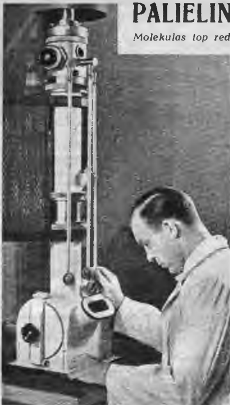
Jaunākā tipa vienkāršots pārmikroskops — palielina 50.000 reizes.

labus, apm. 20.000—30.000 kārtīgus palielinājumus. Jau ar to bija sperts liels solis uz priekšu mikropasaules noslēpumu noskaidrošanā. Cilvēka tiešai skatāmībai atklājās baktēriju iekšējā uzbūve, sūkbūtnes, kas vēl mazākas par baktērijām (t. s. virusi); varēja saskatīt arī ārkārtīgi sīko, t. s. kolloido daļiņu uzbūvi. Visiem šiem atklājumiem ir liela nozīme kā bioloģijā, tā arī teknikā. Ar pārmikroskopa palīdzību tagad tieši sāka pētīt visādas šķiedrvielas, krāsvielu daļiņas, metālu virsmas u. t. t., kam ļoti liela nozīme teknikā. Arī Lielvācijas galvenie rūpniecības uzņēmumi drīz vien atzina pārmikroskopa lielo nozīmi. Lielie Siemens'a - Halske's uzņēmumi Berlīnē, tāpat arī sabiedrība AEG, kuru pē-