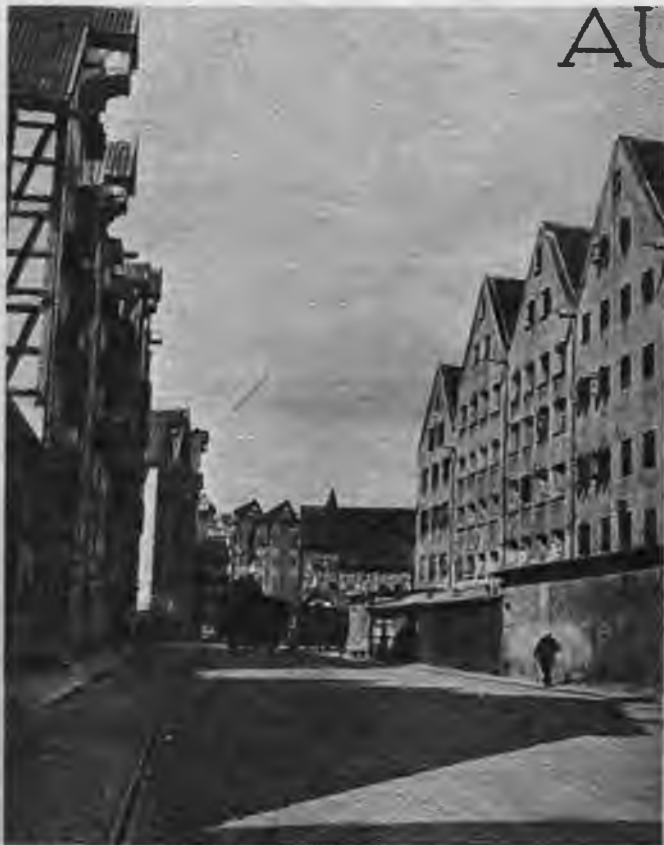
Austrumprūsijas sirds — Königsberga, liecina par Austrumprūsijas seno kultūru.