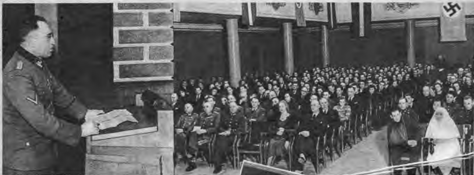
Izcils notikums pagājušā nedēļā bija latviešu brīvprātīgo propagandas un organizācijas galvenās komitejas rīkotais koncerts, kurā ieradās arī austrumos ievainotie latviešu brīvprātīgie. Uzņēmumā Latvijas ģenerālapgabala SS un policijas vadītājs ģenerālmajors Schröder's uzrunā koncerta dalībniekus.