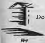
Doma baznīca Rīgā.