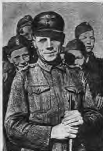
Paavo Nurmi savu audzēkņu vidū jauno dzimtenes sargu nometnē.

Par savu sporta gaitu sākumu Paavo Nurmi stāsta: „Jau bērnības gados gribēju kļūt par sportistu un atlētu. Kopš 8. dzīves gada mans sapnis bija kļūt par lielu skrējēju. Šī doma nobrieda manā bērniskajā prātā lasot toreiz vienīgo sporta laikrakstu. Citi puikas manā vecumā un es ar aizrautību lasījām par toreizējiem slavenajiem sportistiem skrejceļiņā. Es jau toreiz viegli spēju uzvarēt savus mazos pretiniekus un saskatīju sevi līdzvērtīgu tiem slavenajiem vīriem, par kuŗiem biju lasījis. Kopš tā laika mana vienīgā doma bija palikt labā formā. Sākot ar 12. dzīves gadu man nācās jau meklēt darbu, lai arī no savas puses sagādātu attiecīgo devu ģimenes uzturam. Es pelnīju 20 somu marķu mēnesī, no kuŗām savām vajadzībām varēju paturēt 2 markas. Es tomēr neizšķiedu šo mazumiņu kā citi puikas, bet rēgulāri krāju — nākotnei. Tam bija svarīga nozīme mana rakstura veidošanā, jo nekas cits tā neveicina pašdisciplīnu kā krā-