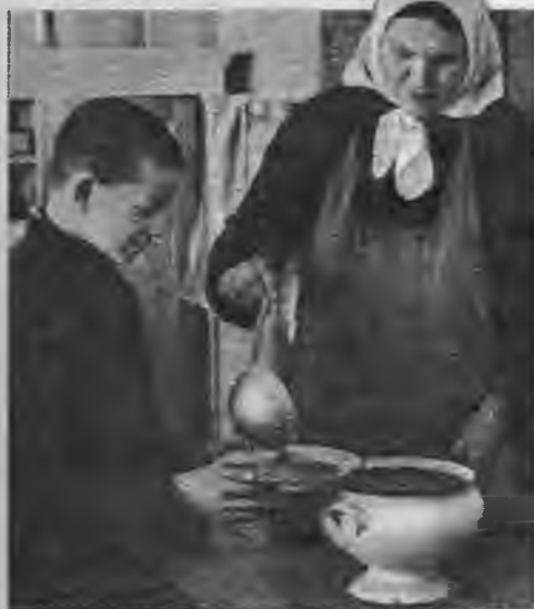
Uzņēmumi no Lauberes 6-kl. pamatskolas.

Pusdienas laikā visas domas protavs, saistās ar virtuvi un saimniecību.