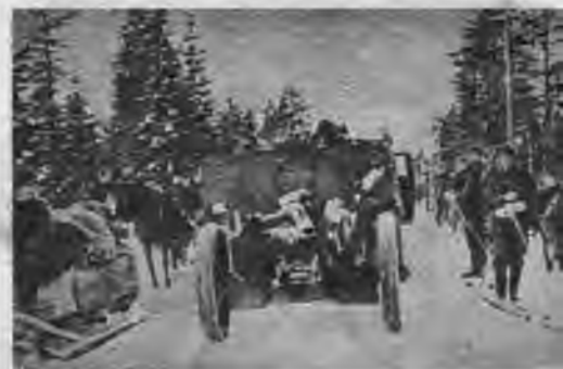
Bolševikiem atņemtus kaŗa materiālus cauri somu triecienu grupām nogādā aizmugurē. Aina no kultūrfilmas „Somijas brīvībai“.

Somu kaŗavīri pielauzušies ienaidnieka bunkuram un uzbrūk tam ar liesmu metējiem. Aina no kultūrfilmas „Somijas brīvībai“.