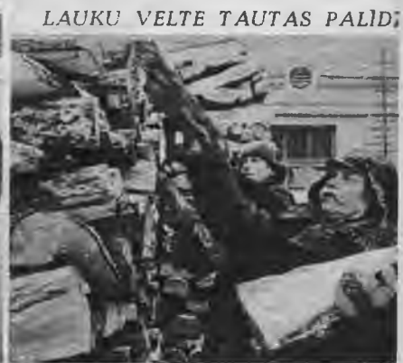
Boļševiku laikā cietušajām rīdzinieku nēm lauksaimnieki no mežiem piegādā