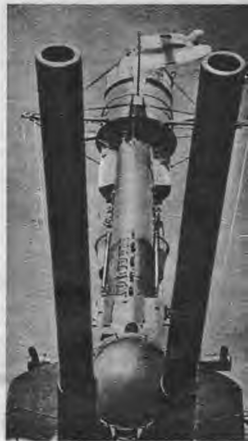
Somu ieroču spēks un vīru drosme stāv nomodā par Somijas brīvību. Aina no kultūrfilmas „Somijas brīvībai“.