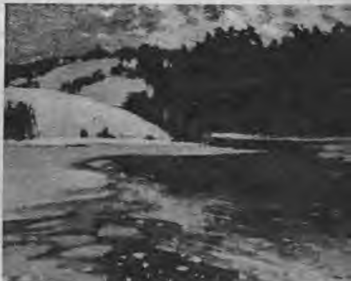
Prof. V. Purvītis: Atkusnī