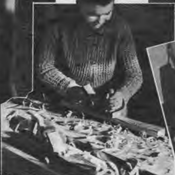
Šis zēns būs dienās labs amatnieks.