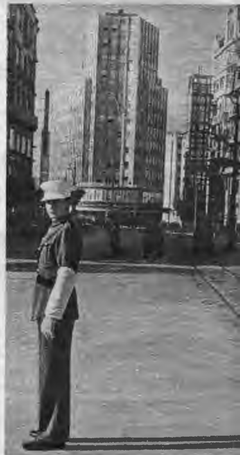
Serbu pasta nams.

„Dobar dan, gospondine!” pusaudzā zēns ar kruķiem ubagodams stāv pie durvīm un murmina savu: „Labdien, kungs!” Vējš nežēlīgi svilpo Terazijā, serbu galvaspilsētas galvenajā ielā, tomēr bieza ļaužu drūzma plūst pa ietvēm. Belgrade ir pretstatu pilsēta. Divnozīmīga kā šīs pilsētas vēsture un nostāja ir arī šīs pilsētas seja. Šeit bla-