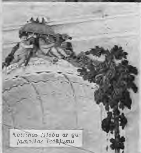
Kaivinas istoba ar guļamkāpas rotājumu.