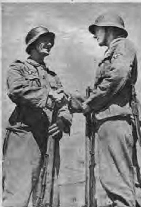
Ar vācu ieročiem atbrīvoti no boļševiku terora, latvieši atkal draudzīgi apvienojušies ar vācu kaņavīriem kopējā cīņā pret boļševisma nevēru.