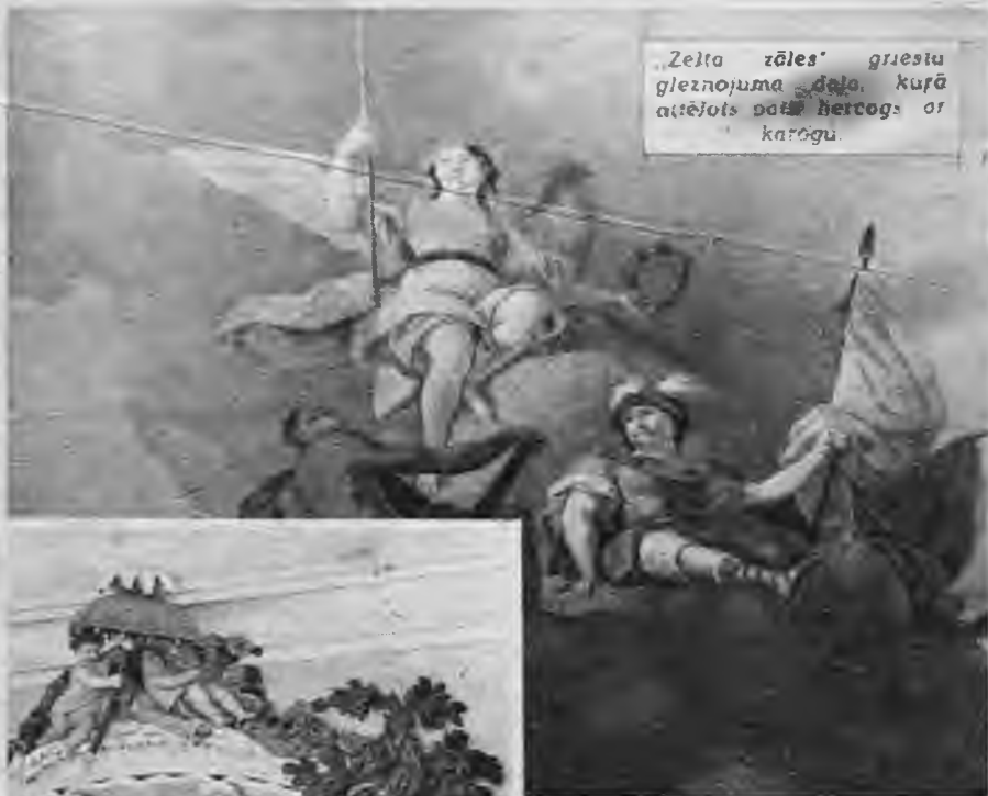
„Zelta zāles” griestu gleznojuma daļa, kurā attēlots pati hercoga orķestrīgu.