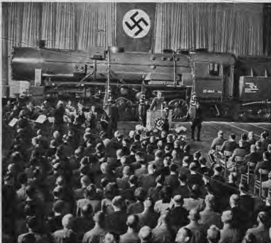
„Der Vierjahresplan“ uzņemami

Vadonis prasa no vācu kara rūpniecības ārkārtīgi daudz. Šīs prasības attiecas ne tikai uz ieroču, tanku un municijas ražošanu, bet arī uz visām pārējām nozarēm, kas tieši vai netieši kalpo kara vajadzībām. Neredzēti bargi, 1941/42. gada ziemā radās vajadzība konstruēt austrumu frontei sevišķi augstas kvalitātes lokomotīves.