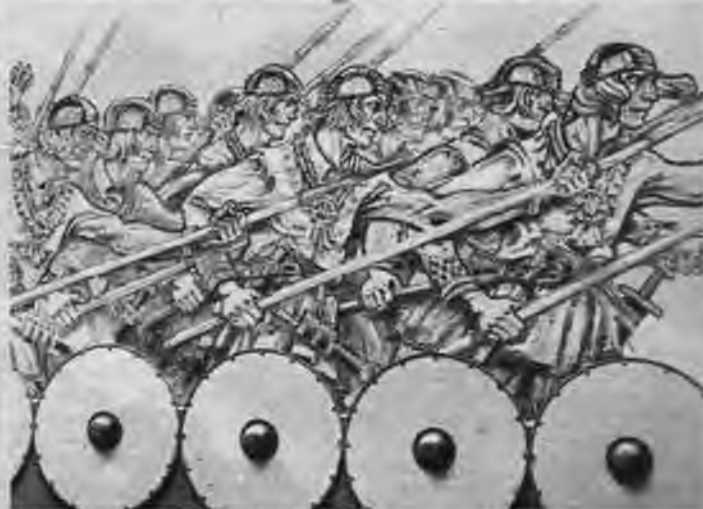
Baltijas lauku vēsturi iezīmē jau vairāk nekā 1000 gadu senas cīņas ar uzmačīgajām austrumu ordām. Vācu krustnešu ordeņa