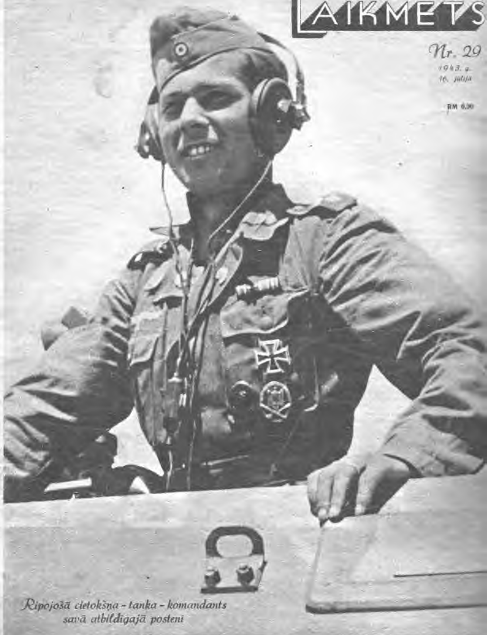
Ripojošā cietokšņa - tanka - komandants savā atbildīgajā posteni