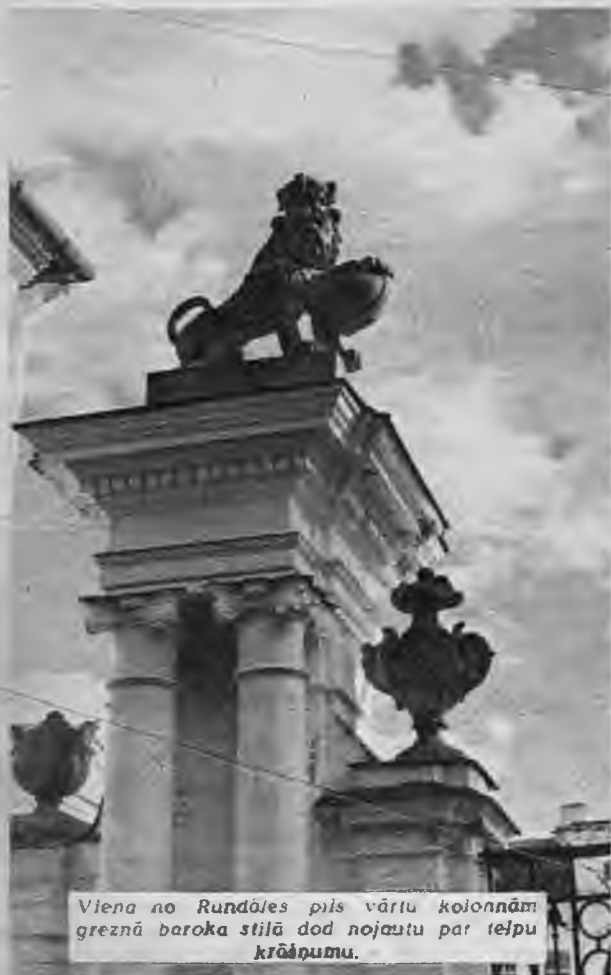
Viena no Rundāles pils vārtu kolonnām greznā baroka stilā dod nojautu par telpu krāsojumu.