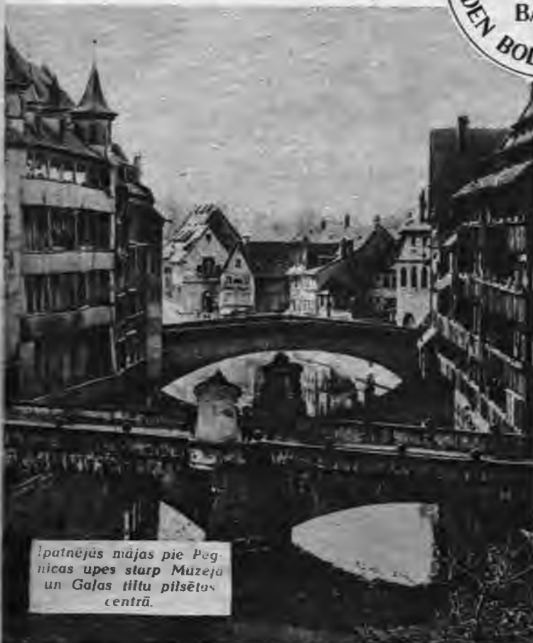
Ipatnējās mājas pie Pegnitas upes starp Muzeja un Galas tiltu pilsētas centrā.

Divas pretstatu pasaules — vecā ķeizaru laikmetu Vācija un nacionālsociālistiskā Lielvācija — nekur citur nav tik spilgti saskatāmas savu raksturīgāko pazīmju resp. īpatnību izpaušmē kā Nirnbergā. Citās pilsētās, ko sāka pārveidot pēc laikmetīgi un visos sīkumos izstrādātas izbūves plāna, kā Lielvācijas galvaspilsētā Berlīnē, nacionālsociālistiskās kustības pilsētā Minchenē, tautas sacelšanās pilsētā Gracā, nacionālsociālistiskās audzināšanas pilsētā Baireitā, ārejas tirdzniecības pilsētā Hamburgā, Lincā, Drēzdenē, Veimārā, Augsburgā, Vircburgā, Ķelnē, Minsterā u. c., jaunās grandiozās Vadoņa celtnes pa lielāki daļai iekļāvušās vai iekļausies šo pilsētu tagadējās robežās. Tādā kārtā jaunbūves ar savu monumentālītāti, kas atspoguļos tagadējā Lielvācijas nacionālsociālistiskā laikmeta varenību, tikai ievērojami pārveidos šo pilsētu seju. Nirnbergā turpretim jaunās celtnes piešķirs pilsētai pilnīgi jaunu seju, jo tās ceļ nevis nojaucot vecās būves, vai izmantojot apbūvētām piemērotus brīvus laukumus pilsētas robežās, bet ārpus tām.