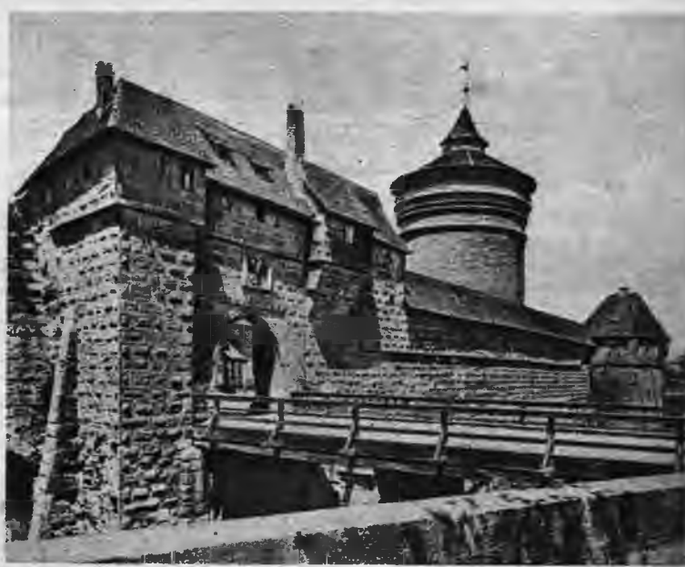
Daļa Nirnbergas vecpilsētas nocietinājumu ar Sieviešu vārtiem un Resno torni, kas labi saglabājušies no viduslaikiem.

Angļu gaisa terora uzbrukumos stipri cietusi tieši Nirnbergas vecpilsēta, kur līdzās daudzām sagraudātām dzīvojamām ēkām un slimnīcām iznīcinātas arī daudzas mākslas vērtības. E. Tūbelis.