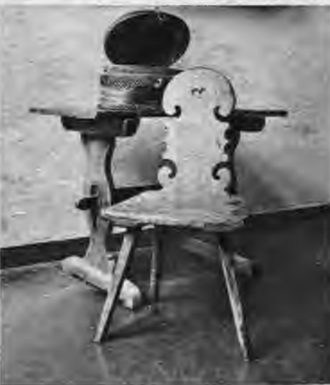
Ar lielu gaumi un mākslniecisku izjūtu mūsu tēvi darinājuši savas māļļietas. Atlētā — Pērkones novada krēsls, aiz tā galds ar vāceli.