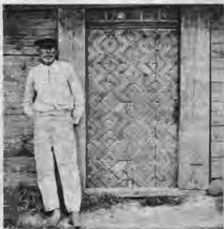
Rakstā rotātas durvis Pērkones Skatres ciemā.