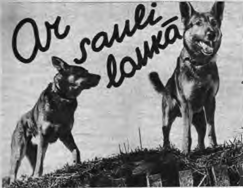
Modrie lauku sētas sargi.

Pavasārā pieaugums lauku sētas dzīvnieku saimēs ir saimnieču lielākais prieks. Sekojot racionālās saimniekošanas principiem, šai sētā audzē tikai tīrsugas Šropširas aitas. Katra no šīm pieaugušām aitām dod līdz 6 kg vilnas gadā.