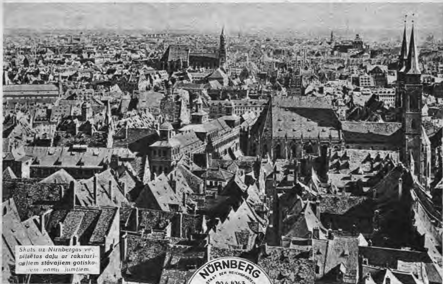
Skats uz Nirnbergas vecpilsētas daļu ar raksturīgiem stāvjiem gotiskajiem namu jumtiem

Speciāls zīmogs ar uzrakstiem: „Nirnberga — valsts partijas pilsēta” un „Mūsu Vadoņa padzen bolševismu”, ar ko apzīmēto šakarā ar Vadoņa 54. dzimundiešu izdotās pastmarkas.