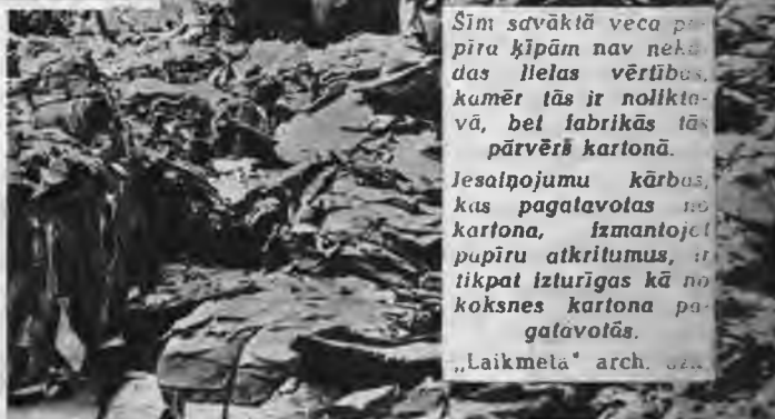
Šim savāktā veca papīra kļūpām nav nekādas lielas vērtības, kamēr tās ir noliktavā, bet fabrikās tās pārvērš kartonā.

Laikā no 2. līdz 4. maijam čakli piedalīsimies šās šķietami nevērtīgās un tomēr ļoti noderīgās izejvielas vākšanā! A. M.