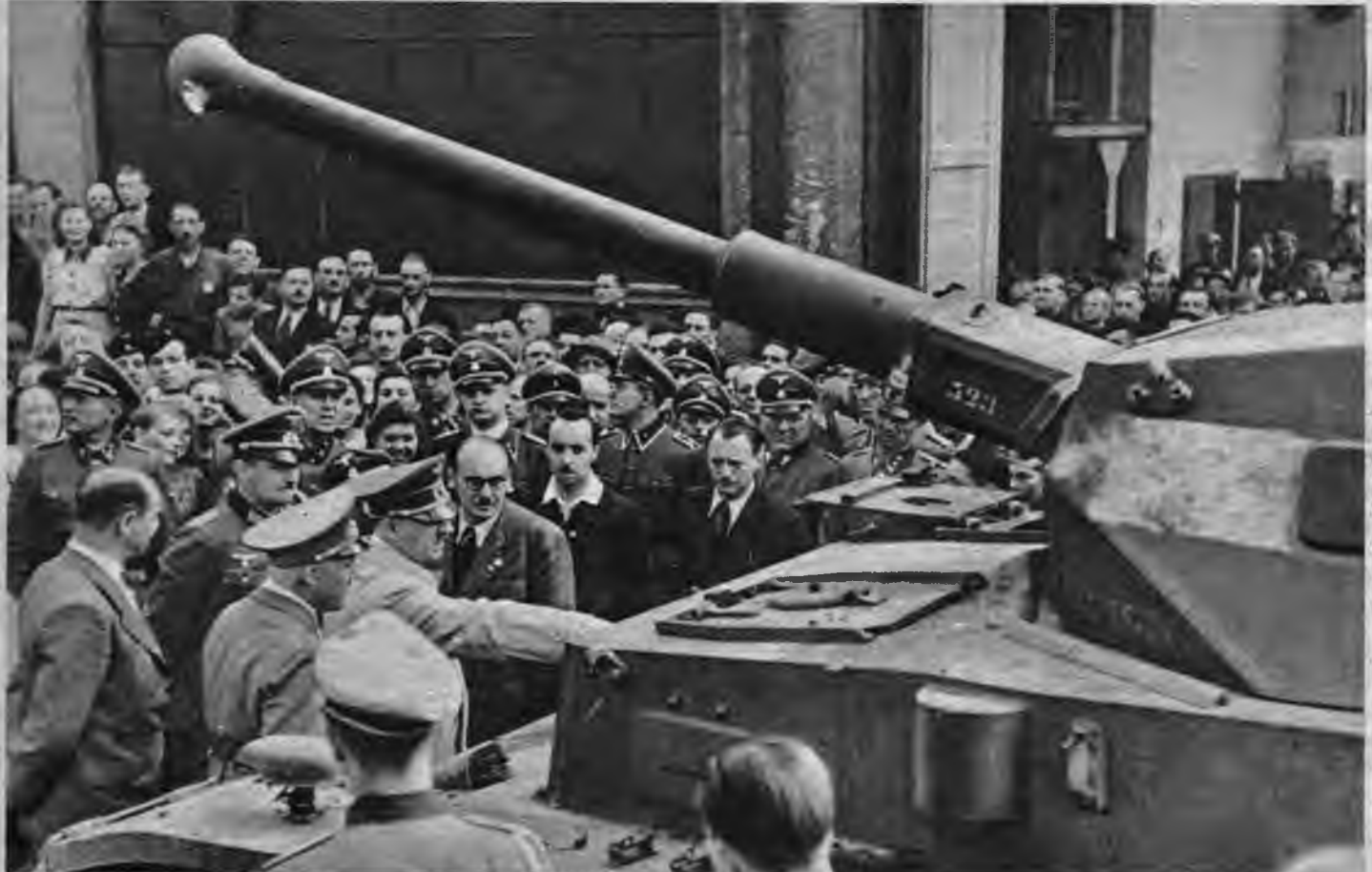
Vadonis apskata kādu bruņošanās rūpniecības uzņēmumu.

1943. gada 1. maijam ir sevišķi svarīga nozīme, jo taisni tagad spilgtāk nekā jebkad mēs apzināties briesmas, kādas Eiropas kultūras pasaulei draud no žīdu boļševikiem un žīdu kapitālistiem. Esam pārcietuši ziemu, kur bija jāpārvar daļa laba krīze. Tomēr vadība un fronte pārspējusi šīs grūtības. Tāpat nesatricināta stāv aizmugure — Jaunās Eiropas iekšējā fronte. Ienaidnieks guvis panākumus, tomēr ne vienā vietā tas nav sasniedzis savu mērķi, proti — satriecis savu pretinieku. Fronte dosies ciņā ar jauniem spēkiem un jauniem ieročiem. Dzimtene zina, ka tā nedrīkst atslābt. Arī mūsu tautas labākie dēļi devušies uz fronti, kur tie drošsirdīgi cīnīsies. Viņi grib nodrošināt savai tautai laimīgu dzīvi nākotnē. Viņi iekļāvušies ciešā frontes kaņavīru kopībā. Sekosim viņu piemēram un vienosimies arī mēs visi — roku un gara darbinieki — vienā ciešā darba kopībā. Ja šis 1. maijā gūtās atziņas realizēsīm nākamajā ciņā un darba gada ikdienā, tad būsīm šos svētkus pareizi svinējuši.