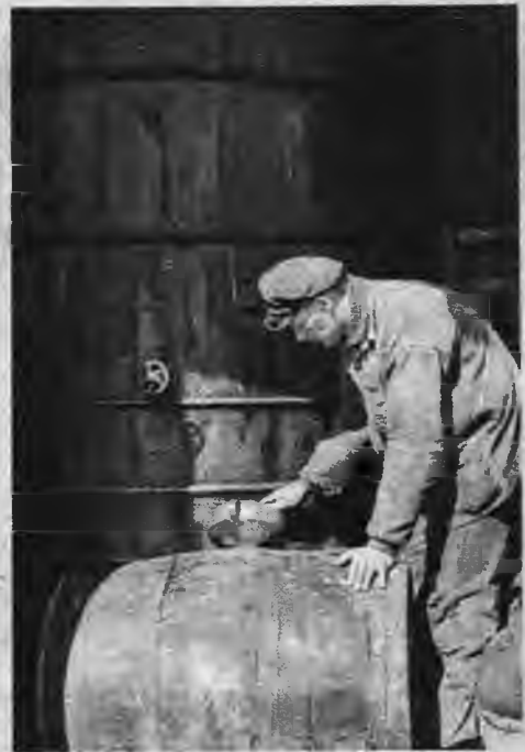
No kauliem iztvaicētos taukus nostādina lielos metāla kublos, no kuriem tos pārņēma mucās. Šos tehniskos taukus nosūta citās fabrikās tālākai pārstrādāšanai.

Apsverot visas no kauliem iegūtās vērtības un to daudzpusīgo lietošanu, jākonstatē, ka kauli