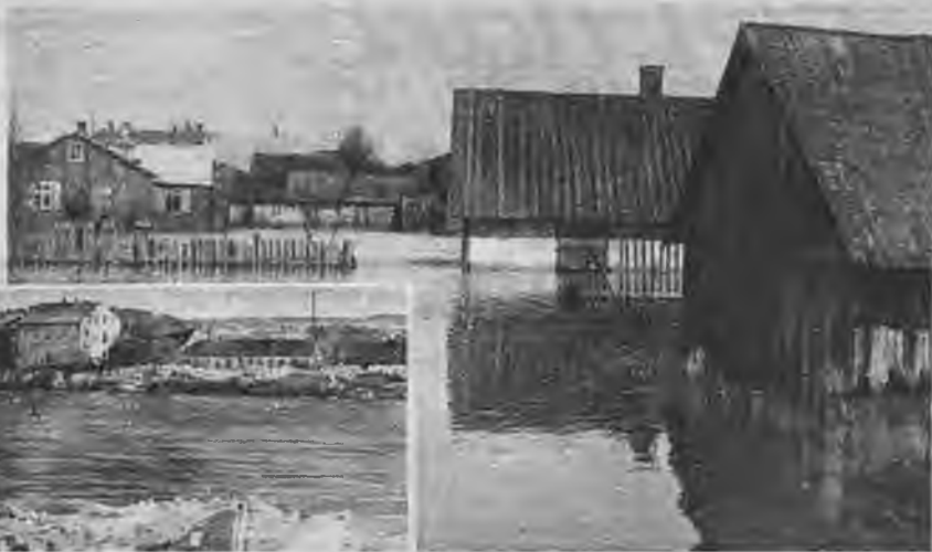
Daugavas palu ūdeņi ik pavasarus applūdina pilsētu.

Daugaviņa, melnacīte, Kā tā melna netecēs, Melnā tek vakarā. Pilna dārgu dvēselīšu. T. dz.