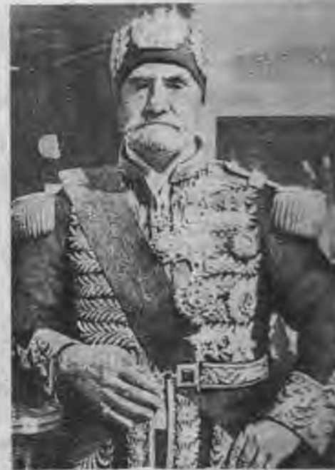
Pašreizējais Tunisijas bejs — valdnieks par miljoniem muhamedānu.

nijā būvēja dzelzceļus un zemes ceļus. Tā Tunisijas bagātības padarītu ērtāk pieejamas eksportam. Uzplauka tirdzniecība un turienes rūpniecība. Galvaspilsēta Tunisija kļuva par vienu no lielākajām un modernākajām Āfrikas pilsētām, kas gandrīz ne ar ko neatšķīrās no Francijas modernajām dienvidu ostas pilsētām. Tunisija — saukta arī par Āfrikas pērlī, kļuva par vienu no visbagātākajām Francijas kolonijām. Pa-reizi izmantota, tā spēja dot eksporta preces miljonu vērtībā. Tādēļ nav brīnums ka arī angļi un amerikāņi sīkai iekārtoja šo apgabalu. Tunisija tagad kļuvusi par tīru lauku. Pēc amerikāņu iebrukuma Āfrikā Vācijas un Itālijas kaŗaspēka vienības pilnīgā sazīnā izcēla desantu Tunisijā. Lai noturienes sargātu Eiropu pret angļu un amerikāņu iebrukumu.