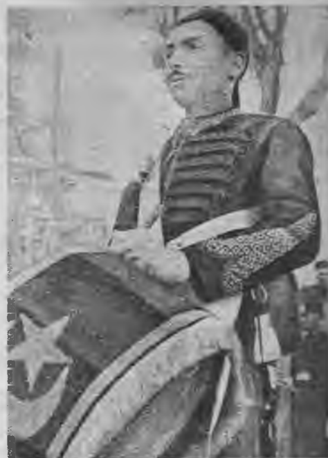
Tunisijas valdnieks joprojām ir bejs, kas ciešā sadarbībā ar franču iestādēm vada savu valsti. Viņš ir valdnieks un viņam pienākas arī valdnieka gods. Bejam izbraucot no pils, atskan goda sardzes bungu rīboņa.

Nākošajos gados Tunisijā notika rosīgs uzbūves darbs. Francija savā jaunajā kolo-