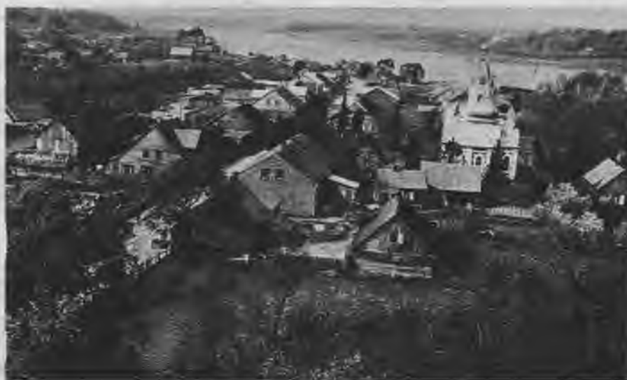
Kad aizskrējušas pavasara straumes un sazafojuši darzi, Jaunjelgava bauda vasaras mieru.