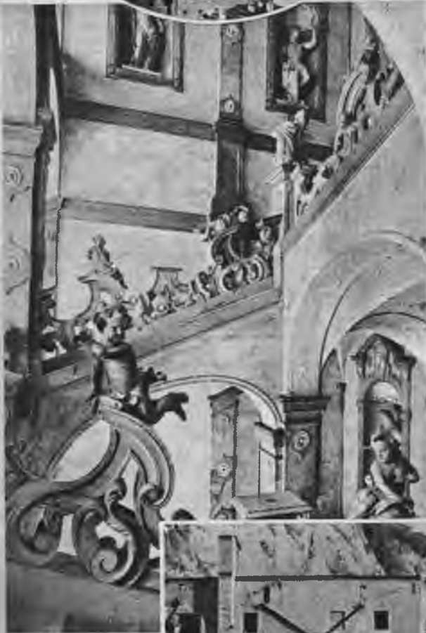
Marmora kāpnes Mirabellas pīlī, ko Zalcburgas firsts Wolf's Dietrich's dāvāja savai draudzenei Salome'i von Alt.

Zalcburgas archibīskapu zirgu stāļu stūrītis ar peldbaseinu zirgu peldināšanai. Uz baseina iezogojuma sienām gleznojumi ar augstu mākslas vērtību. Baseina vidū — zirgu dresētāja statuja, arī ievērojams mākslas darbs. — Vispār — nav otras pilsētas pasaulē, kur zirgam būtu bijusi ierādīta tik cienīga vieta kā Zalcburgā, — jo zirga attēli šeit sastopami visdažādākajos veidos pie visām ievērojamākām celtnēm.