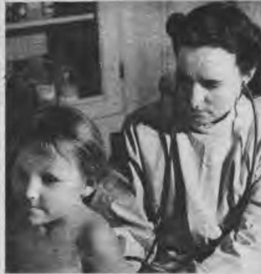
Par jauno pilsoņu veselības sargāšanu kaļa laiku pastiprināti rūpējas veselības kopšanas punktu ārsti.

Jaunās mātes par daudz klausu vecajām kaimi- nienēm, kādēļ ne reti atrodam zīdaiņus notītus kā kūniņas. Zīdaiņim ne- pieciešamas kustības, un rociņas un kājiņas jā- atstāj svabadas. Ja tagad