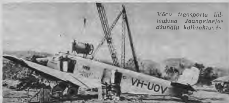
Vācu transporta lidmašīna Jaungvinējas džungļu kalnraktuvēs.

Slavenais Bruklīnas gaisa tilts Ņujorkā ir vācu inženiera J. A. Röbling'a meistardarbs.