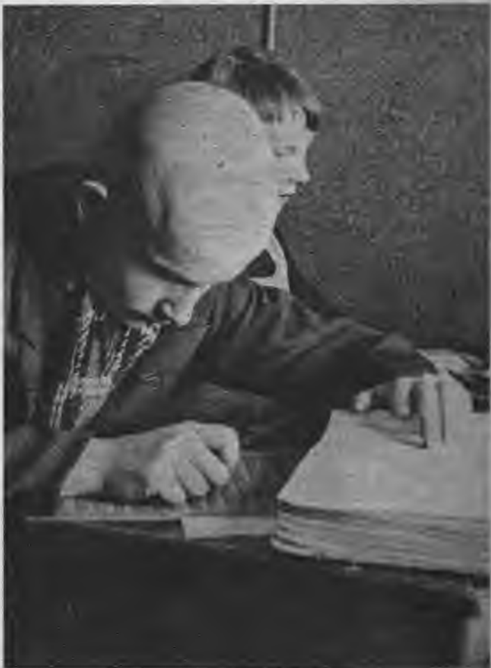
Institūta audzēkņi, lasot punktraksta gramatas tekstus, to par raksta caur metalla plātes lodziņiem uz bleza papīra lapām.