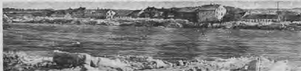
Pavasara palos Daugava Jaunjelgavas krastus nosēf ar lieliem ledus gabaliem.