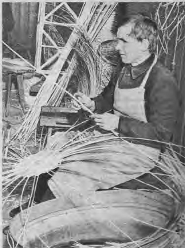
Tā top vīri