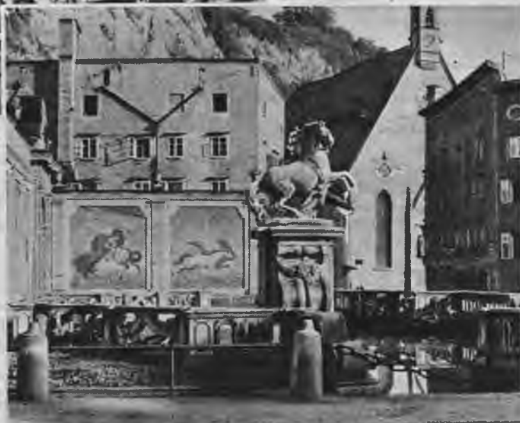
— nav otras pilsētas pasaulē, kur zirgam būtu bijusi ierādīta tik cienīga vieta kā Zalcburgā, — jo zirga attēli šeit sastopami visdažādākajos veidos pie visām ievērojamākām celtnēm. Uzņ.: Laikmeta arch.

Zalcburgas archibīskapu zirgu stāļu stūrītis ar peldbaseinu zirgu peldināšanai. Uz baseina iezogojuma sienām gleznojumi ar augstu mākslas vērtību. Baseina vidū — zirgu dresētāja statuja, arī ievērojams mākslas darbs. — Vispār — nav otras pilsētas pasaulē, kur zirgam būtu bijusi ierādīta tik cienīga vieta kā Zalcburgā, — jo zirga attēli šeit sastopami visdažādākajos veidos pie visām ievērojamākām celtnēm. Uzņ.: Laikmeta arch.