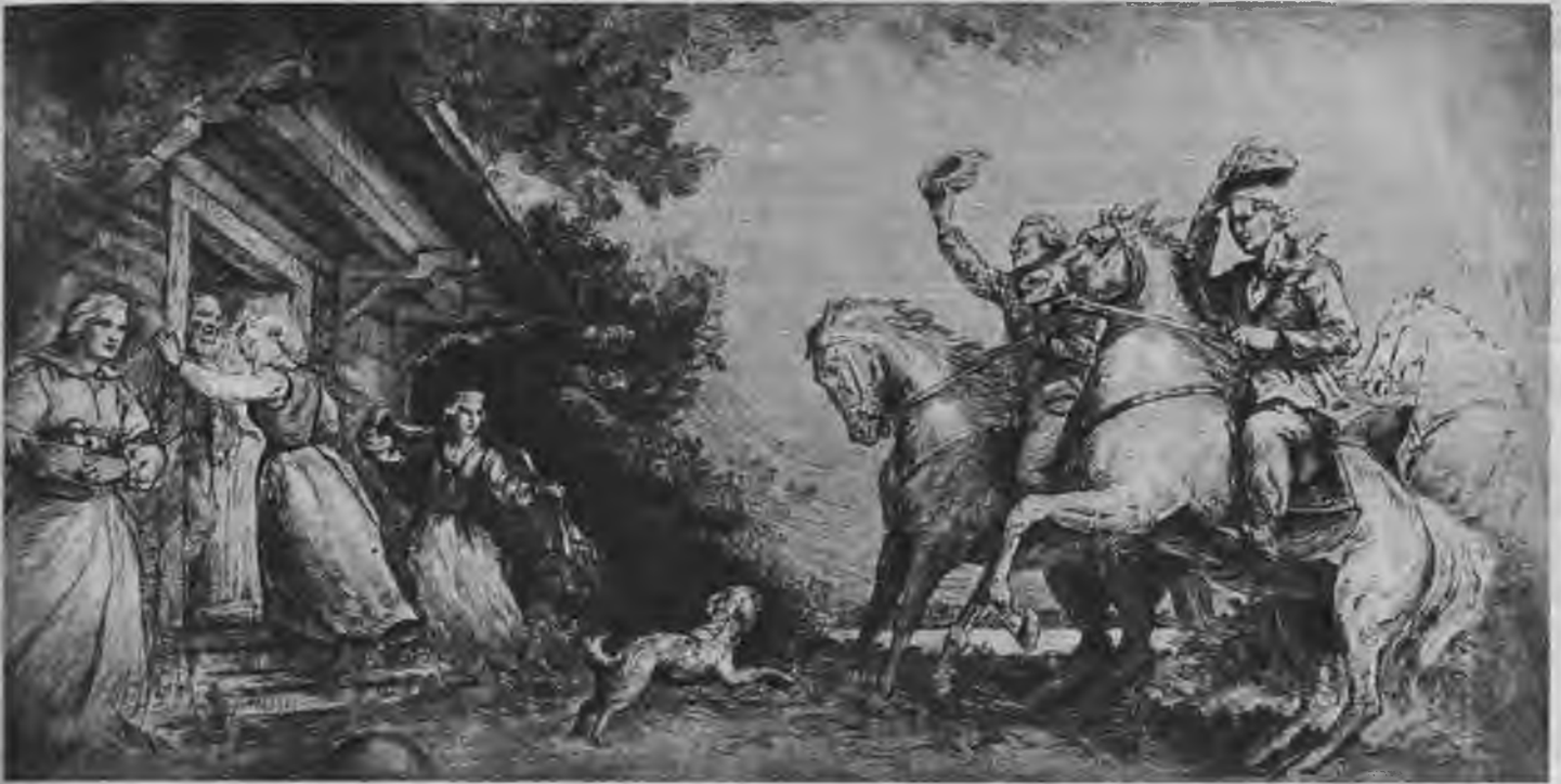
Iz jaunās mākslas atklātņu sērijas: Jāņa Sternberga asējums — Precinieki